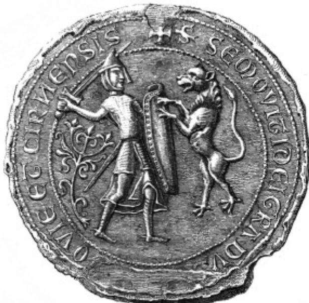
Печать мазовецкого князя Земовита I Конрадовича. 1262 г.

Вместе с тем, с 1230-х гг. продолжалось вторжение в Пруссию Тевтонского ордена. К исходу следующего де-