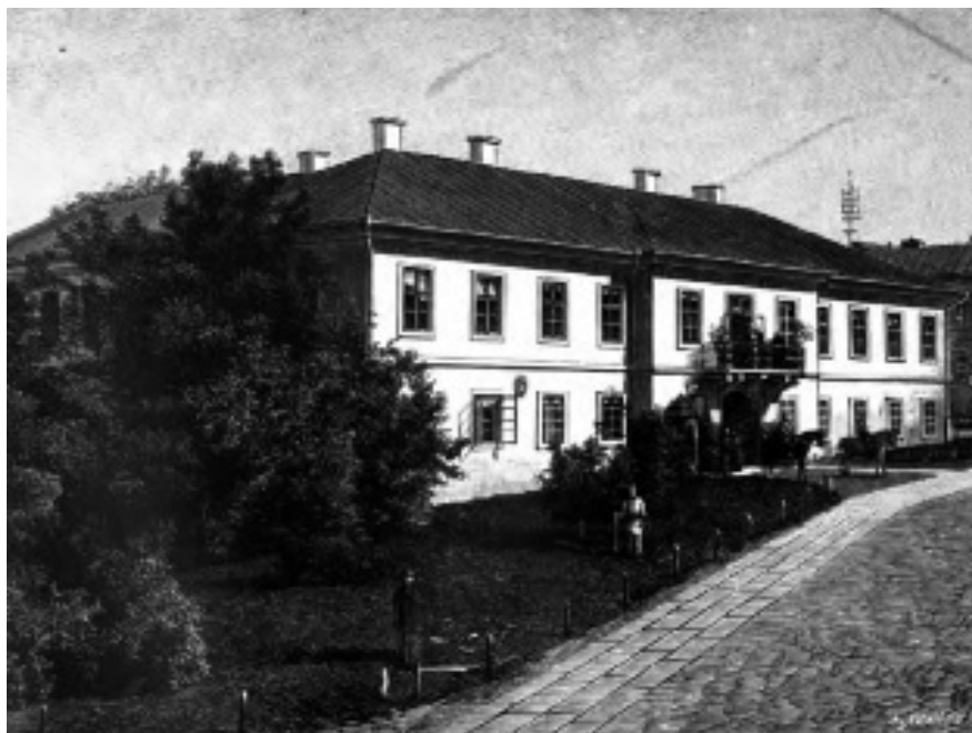
Дом в Черновцах, где останавливался император Александр I. Вид начала XX в.

На следующий день Александр I выехал через Луцк и Дубно в Острог, оттуда через Проскуров, Каменец-Подольск, Могилев и Хотин в Черновцы для встречи с австрийским императором Францем I, который ожидал его в пограничном местечке Новоселица 6 .