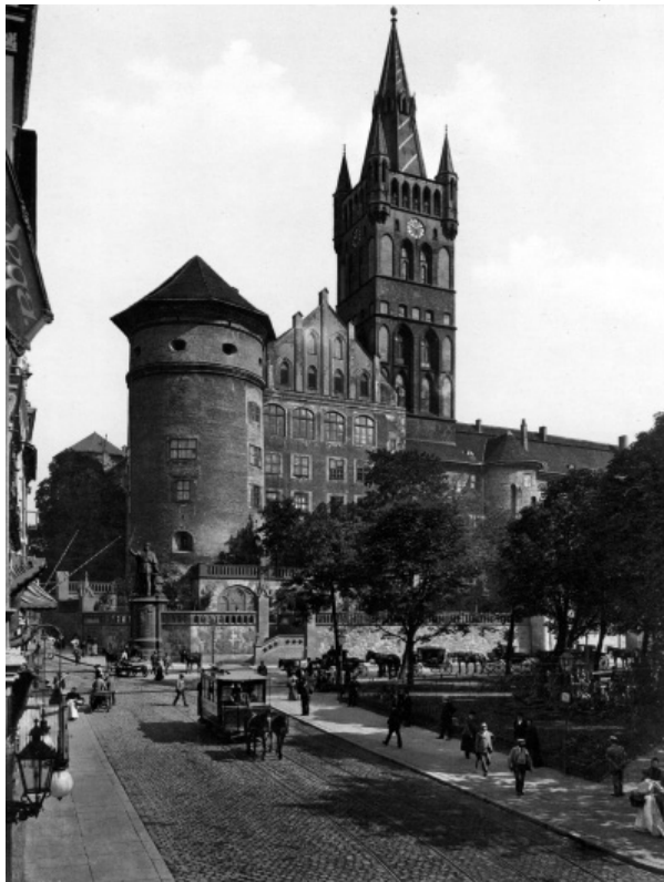
Средневековая крепость Кенигсберга. Фото начала XX в.

Вслед за Н.П. Дашкевичем М.С. Грушевский относил поход к зиме 1254/1255 гг. (или даже к концу 1254 г.), связывая его с заключенным в это время Даниилом и Земовитом договором с тевтонскими рыцарями о разделе ятвяжских земель 45 . Такого же мнения придерживаются и многие новейшие исследователи 46 .