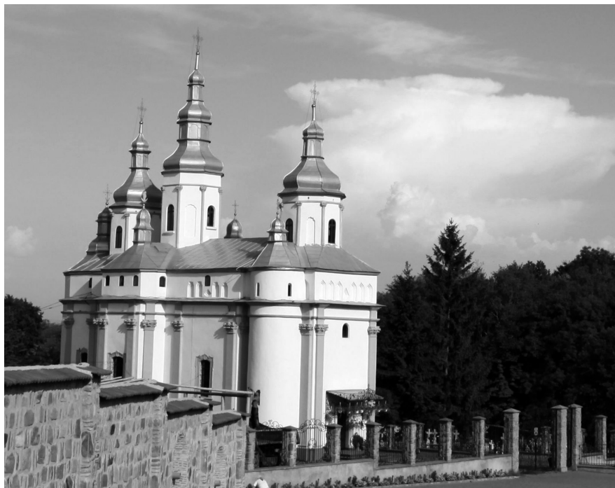
Церковь Свято-Рождества Богородицы мужского монастыря Гореча. Современный вид.

Александр I любил один, без свиты, прогуливаться по Черно-вцам. Однако в эти дни были усилены меры безопасности: без паспорта нельзя было ни попасть в город, ни выйти из него. Везде стояла гражданская и военная стража. На третий день Александр отправился пешком к селу Гореча, которое находилось на расстоянии получаса ходьбы от города, чтобы осмотреть местную церковь ( ныне церковь Свято-Рождества Богородицы мужского монастыря Гореча. - С.С. ). Раньше, до закрытия всех буковинских монастырей во время секуляризации австрийским правительством, эта церковь была монастырем. По преданию, церковь была построена архимандритом Артамоном при денежной помощи императрицы Екатерины II, когда с 1770 по 1774 г. Буковина была занята русскими войсками. Екатерина выделила на церковь 30 червонцев. Конечно, этой суммы бы на церковь не хватило. Русское командование подарило церкви два колокола, которые были отлиты в местечке