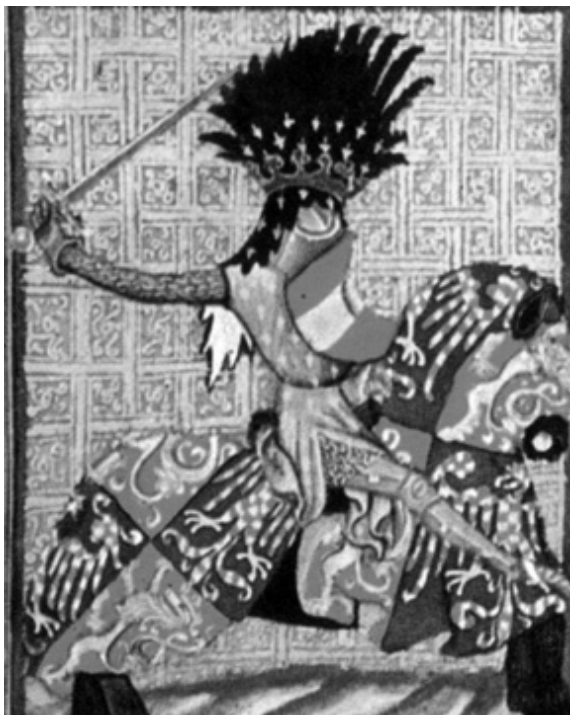
Пржемысл II Оттокар.

Уния с Римом Даниила Галицкого привела к существенной