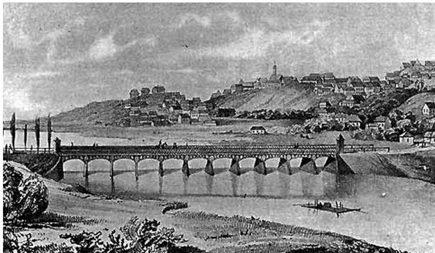
Мост на сваях через р. Прут. Вид начала XX в.

Первоначально российский министр иностранных дел граф Карл Нессельроде известил своего австрийского коллегу о намерении Александра I принять австрийского императора в Каменец-Подольском после окончания проводимых там военных маневров. Однако из-за недостатка помещений пришлось перенести место встречи в Черновцы 5 .