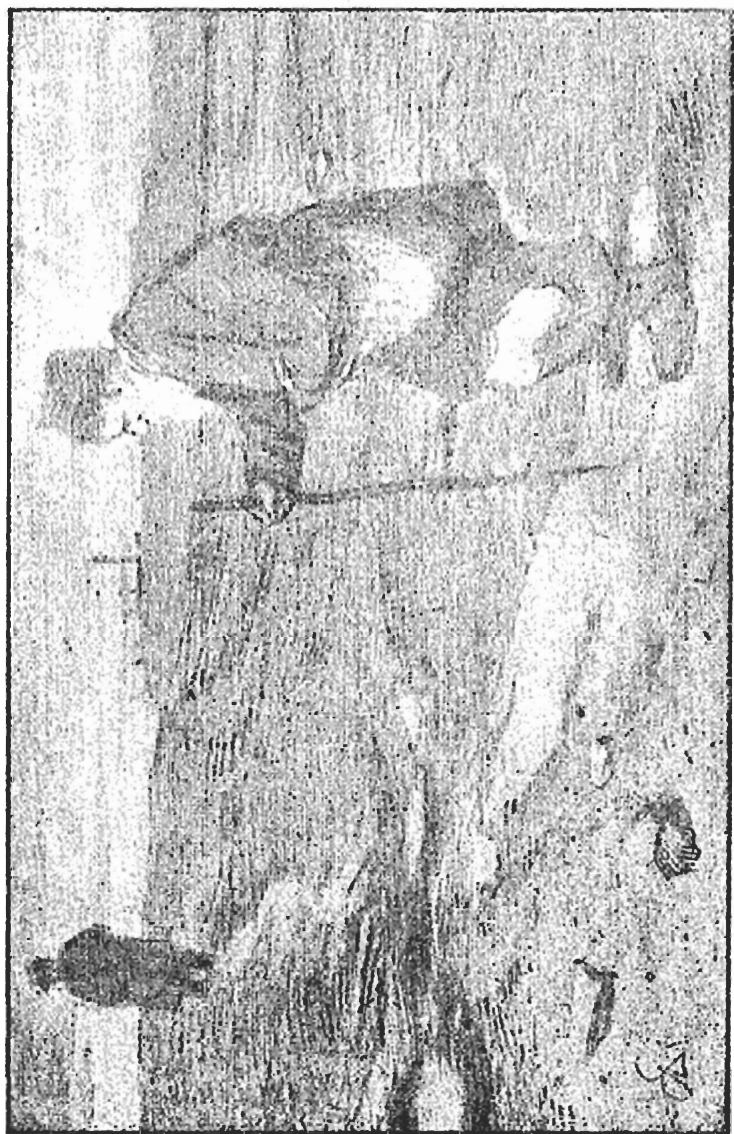
„СТРИБЪ И МЪСЪ“