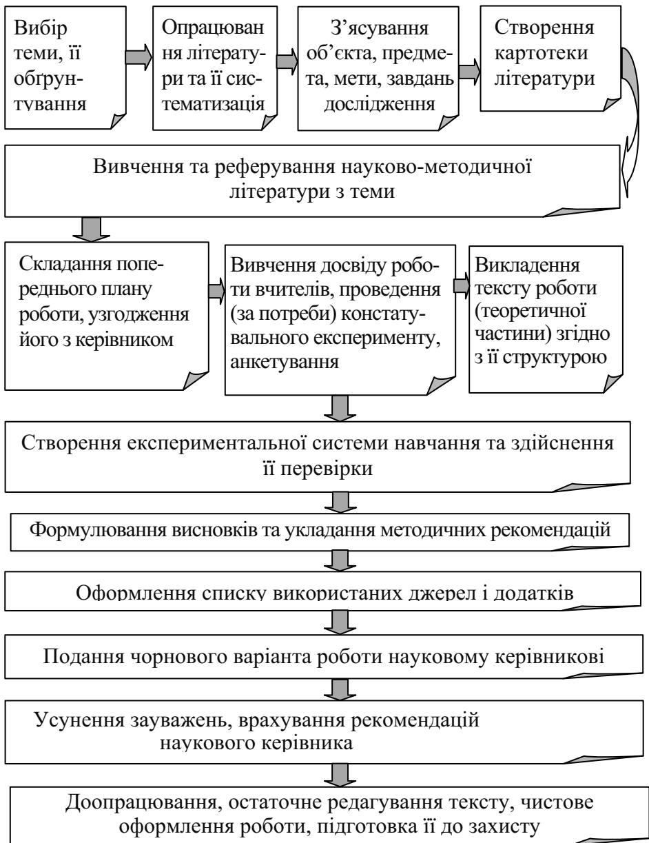
Рис. 3.1. Алгоритм виконання курсової роботи