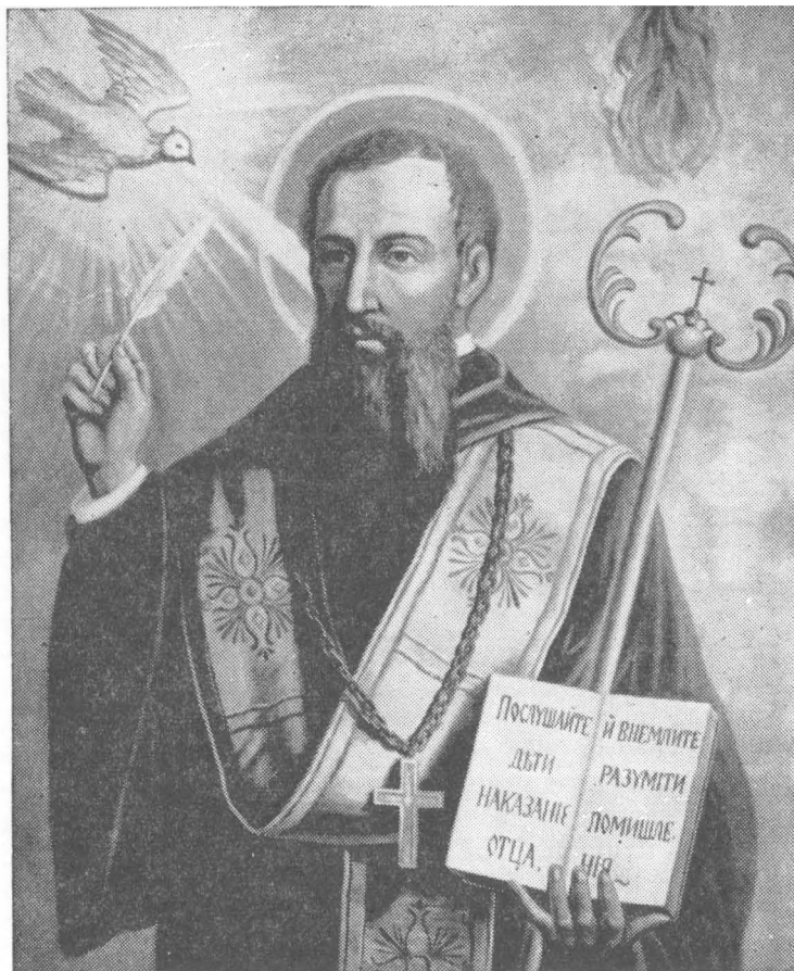
СВЯТИЙ ВАСИЛИЙ ВЕЛИКИЙ, Архиепископ Кесарії Каппадокійської, Отець Східньої Церкви, Патріарх Східного Монашества