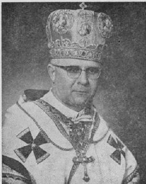
ВПРЕОСВ. КИР МАКСИМ ГЕРМАНЮК, ЧНІ Митрополит Вінніпегський

і витривалою. Він був батьківський і вирозумілий. Маючи своїх вірних розкинутих по цілій Канаді, він майже постійно подорожував і відвідував свої громади.