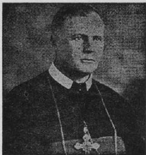
ВПРЕОСВ. АРХИЄПИСКОП КИР ВАСИЛІ ЛАДИКА ЧСВВ., наслідник Єпископа Будки