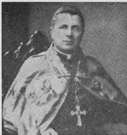
ПРЕОСВ. КИР АНДРЕЙ РОБОРЕЦЬКИЙ Єпископ Саскатунський

мира й Ольги в Вінніпегу, 29 червня 1951 року, в присутності Їх Ексцеленції І. Антоніютті, Апостольського Делегата.