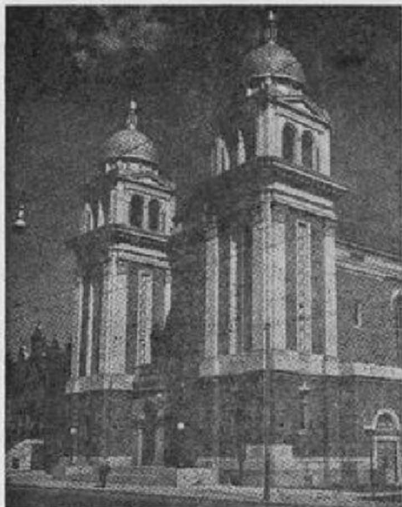
Катедральний Храм св. Володимира й Ольги у Вінніпегу

борецького, продовж свого короткого існування, Епархія набула Єпископську резиденцію і канцелярію та певне число церков і приходств. В Йорктоні, Сестри Служебниці ПНДМ поширили свою дівочу Академію "Серця Христового", а Колегія св. Йосифа, під проводом Братів Християнських Шкіл, тепер поширюється. В тому ж Йорктоні, минулого року збудовано, на спілку з Католиками латинського обряду, дві цілоденні школи. В Саскатуні створено відділ Лицарів Ко-