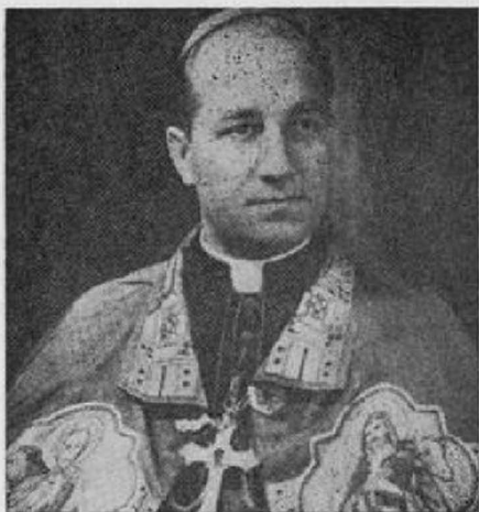
ПРЕОСВ. КИР ІСИДОР БОРЕЦЬКИЙ Єпископ Торонтонський

свої реколекції і конференції, чи то в Вінніпегу, чи в Йорктоні. Отвирались нові парафії і місійні станиці, та життя вірних набирало свіжих сил.