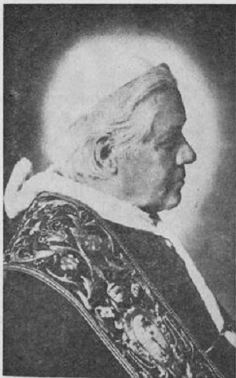
СВЯТИШИЙ ОТЕЦЬ ПАПА ПІЙ Х який назначив першого українського Єпископа для Канади

ВПреосв. А. Шептицький, вже як Галицький Митрополит, вислав до Канади свого секретаря, о. В. Жолдака, щоб перевірити ситуацію. Отець Жолдак відвідав українські громади в Вінніпегу, Стюартбурн, Сифтоні, як також в північній