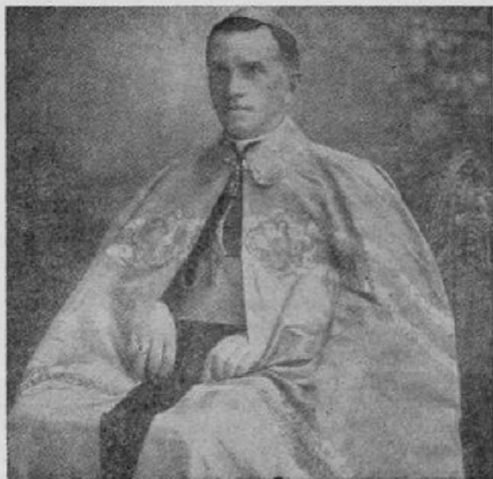
ПРЕОСВ. ЄПИСКОП КИР НИКИТА БУДКА в Канаді був 1912—1927, помер 1949

випадково гостив тоді в Монреалю, і після аудієнції в Головного Губернатора в Оттаві, Преосвященний Никита виїхав до Америки, щоб зложити візиту Єпископові Ортинському в Філадельфії. Потім він повернув знова до Канади. По дорозі до Вінніпегу, він поступив до Торонта, щоб там відвідати громаду своїх вірних. Звідти він вибрався до Вінніпегу, де прибув 19 грудня, і де його інтронізовано в церкві св. Николая 22 грудня. На прийняттю, окрім укра-