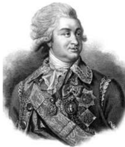
Г.О. Потьомкін, Новоросійський і Азовський генерал-губернатор