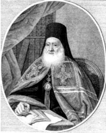
Євгеній (Булгаріс), архієпископ Слов'янський і Херсонський