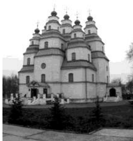
Новомосковський Троїцький собор