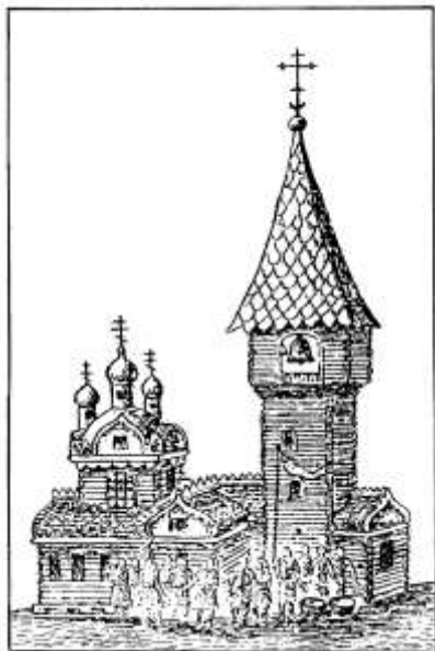
Січова Покровська церква