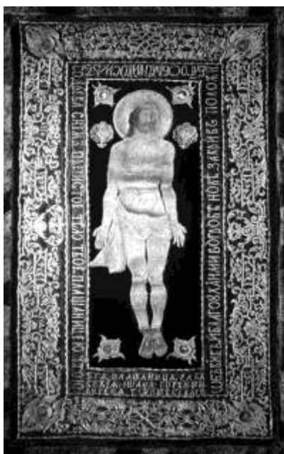
Плащаниця із Покровської Січової церкви