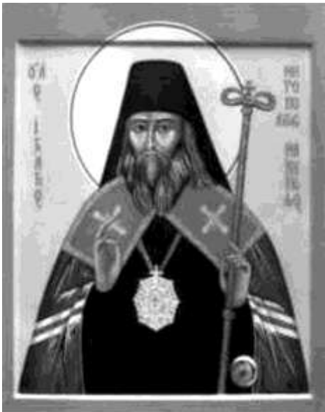
Ігнатій (Газадінов), митрополит Готфійський і Кафійський