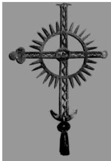
Хрест Січової церкви