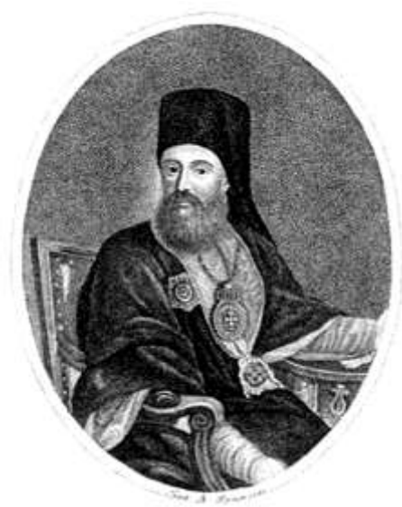
Никифор (Феотокі), архієпископ Слов'янський і Херсонський