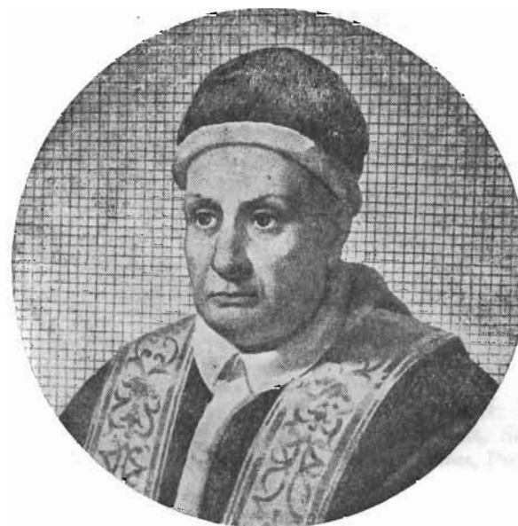
Ex opere musivo in Basilica S. Pauli Romae

Revocet ad se, et habeatur ratio suis loco, et tempore.