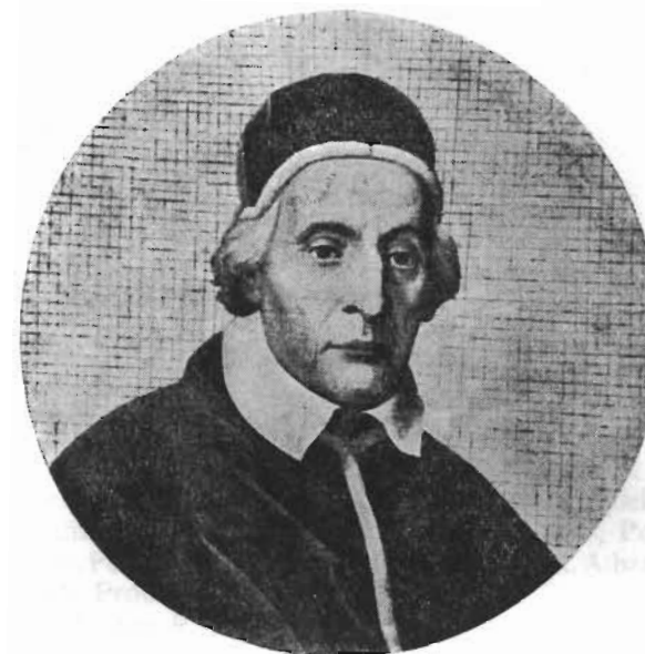
Ex opere musivo in Basilica S. Pauli Romae

CLEMENS XII (12, 16 . VII . 1730 — 6 . II . 1740)