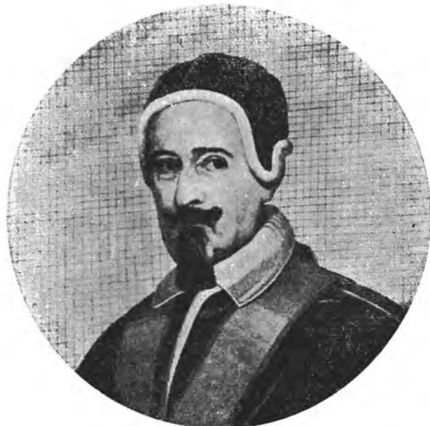
Ex opere musivo in Basilica S. Pauli Romae