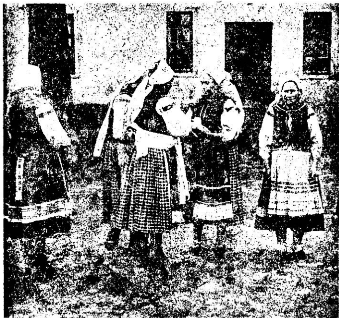
Лемкині перед читальню.

сподні повинні належати і брати чинну участь в Українському Освітнім Товаристві (УОТ), повинні бути членами кооперативи, а також членами своєї