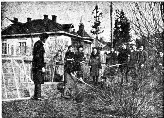
Осінні роботи в саді.

Зробимо місце на квітник коло хати. Цілий город скопаємо й залишимо землю в грубих скибах. Через зиму земля скрушіє й бур'яни вимерзнуть. Грядки під капусту, рослини осінню добре підгноїмо й прикопаємо. Грядки на петрушку, моркву, шпінат, салату й пастернак приладимо під засів, і як тільки настануть добрі приморозки, засіємо їх. Упорядку-