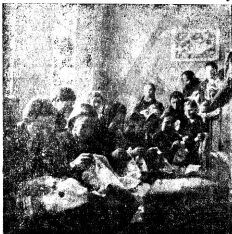
Роботи з вишивками.

Секція, що дбає про здоровя своїх членів, попросить лікаря з викладом про шкідливість уживання