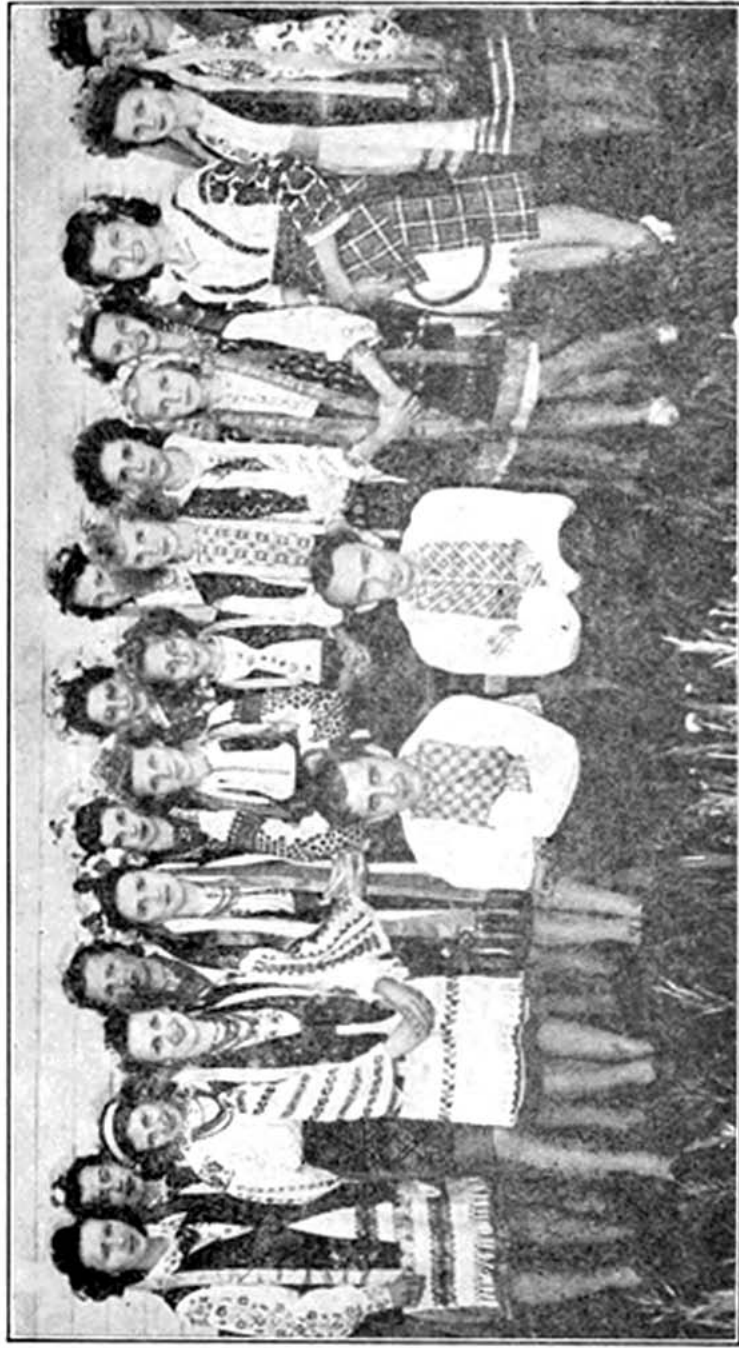
Контест танків на окружнім зїзді СУМК в Іст Селкирк, Ман. Контестанти з відділів у Трансксона, Вінніпег, Іст Селкирк і Паплар Парк. Зїзд відбувся на 1-го липня, 1945.