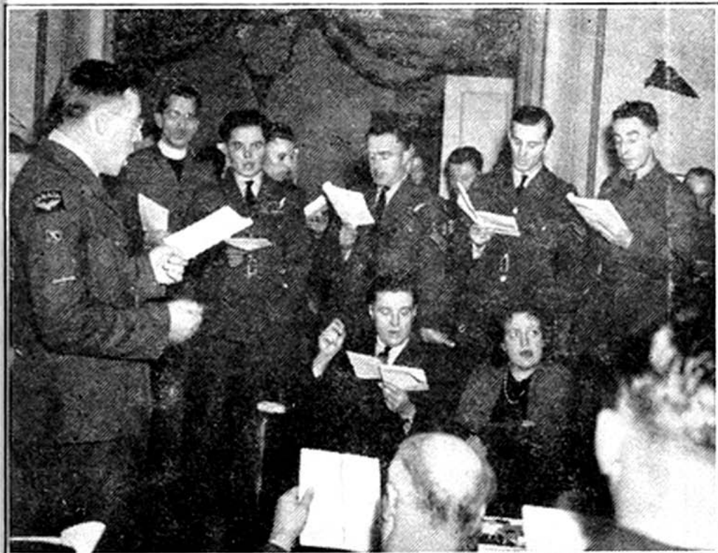
Група українських вояків в Лондоні співає колядки й інші пісні підчас Різдвяних Свят, 7 січня 1945 р. у своїй домівці.