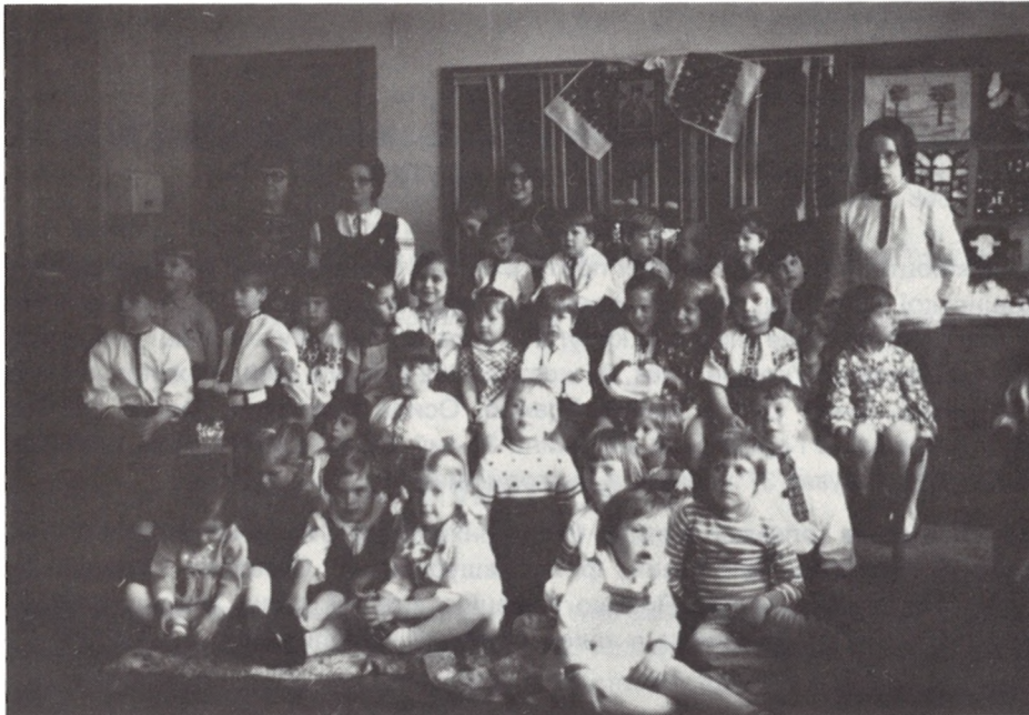
СВІТЛИНА САДОЧКА 33-ГО ВІДДІЛУ СУА ІМ. ЛЕСІ УКРАЇНКИ В КЛІВЛЕНДІ.

Образ життя і праці Відділу був би не повний, якби не згадати про його вклад праці в ділянки збереження традицій, плекання духової культури і пропаганди доброго імені України. Відділ влаштував багато імпрез, з яких найважливішим був величавий концерт в честь патронки Відділу Лесі Українки. Рік-річно влаштовується костюмівку для дітей, Дні Матері, різдвяні чи великодні зустрічі, кілька разів Вишивані вечерниці, раз вишивану забаву для дітей і започатковано балі градуантів. Відчитано понад 100 доповідей з нагоди національних річниць, а також на теми виховні, традицій, плекання здоров'я, суспільні, господарсько-економічні й інші. Протягом кількох років діяв при Відділі під проводом проф. Юлії Холодняк гурток книголюбів, влаштовуючи авторські вечори. Великий вклад праці дали членки у підготуванні всенаціонального свята в 100-річчя поетеси Лесі Українки в Клівленді, в городі Національних Культур.