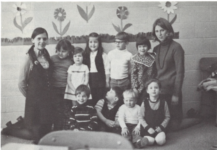
Світличка 108-го Відділу СУА в Нью Гейвені

для товариської зустрічі й розваги. Відділ здобув собі популярність у Нью-Гейвені та околиці й притягає до себе все нових членок. Це ж і запорука його дальшого розвитку.