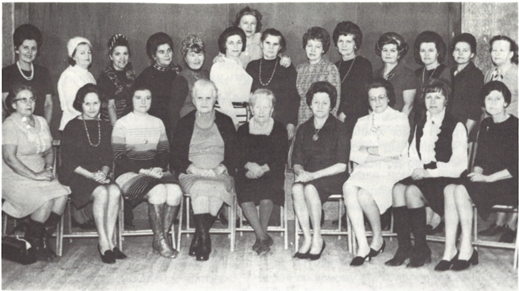
65 ВІДДІЛ СУА НЬЮ БРАНСВІК, НЬЮ ДЖЕРЗІ