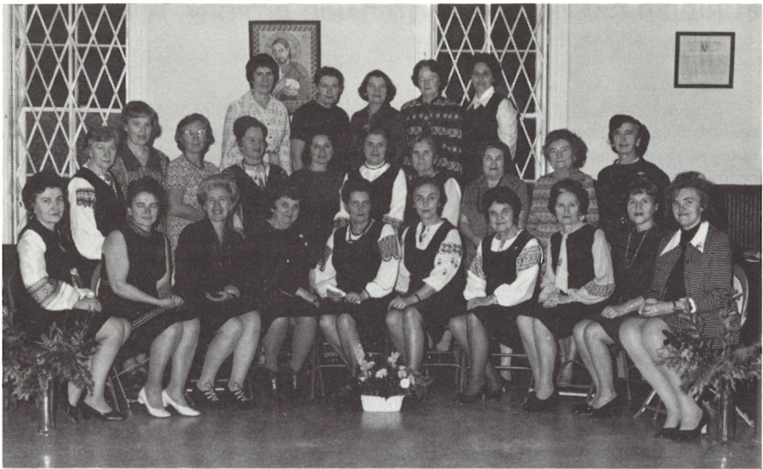
82 ВІДДІЛ СУА НЬЮ-ЙОРК