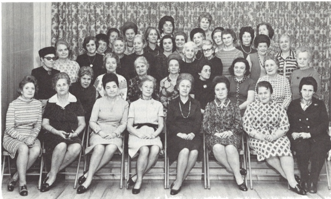
64 ВІДДІЛ СУА НЬЮ-ЙОРК