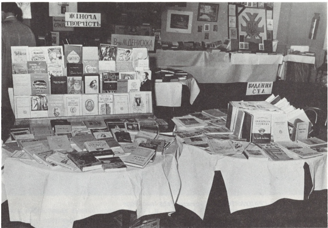
ВИСТАВКА КНИЖКИ влаштована Округною Радою в Нью-Йорк