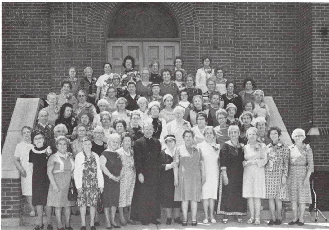
23 ВІДДІЛ СУА ДІТРОЙТ

Щирий привіт та сердечні побажання з нагоди 50-літнього ювілею СУА і найкращих успіхів у конвенційних нарадах пересилає 23 Відділ СУА в Дітройті.