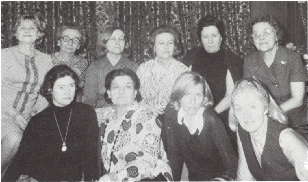
105-ТИЙ ВІДДІЛ СУА ІМ. ЛЕСІ УКРАЇНКИ СТАТЕН АЙЛЕНД