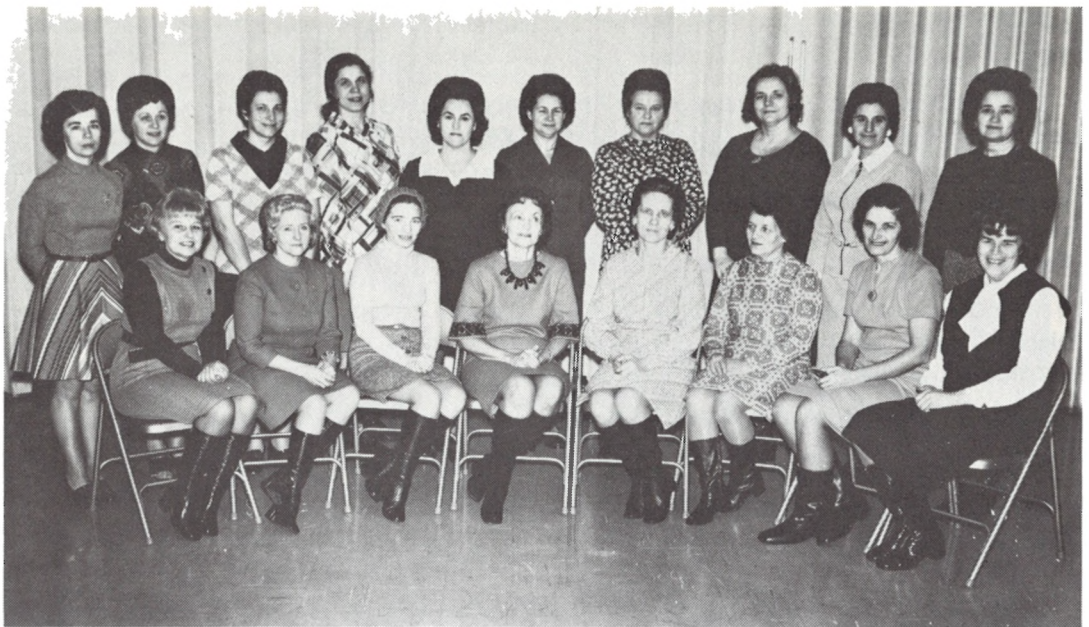
76 ВІДДІЛ СУА ДІТРОЙТ, МІЧ.