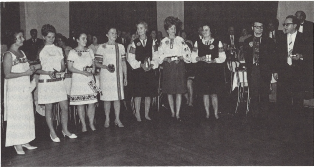
ВИШИВАНІ ВЕЧЕРНИЦІ — Окружна Рада Нью-Йорк

ських бібліотеках започатковано в 1971 р. Окружна Рада була господарем для нарад культурно-освітньої комісії СУА над справами обрядовості на такі теми: "Колядки", "Готування до Різдва", "Різдвяні страви" (1967), "Дівич-вечір" (1969) і "Обрядове печиво" з показом печива, прозірками й весільними піснями у виконанні членок нашої Округи (1970)