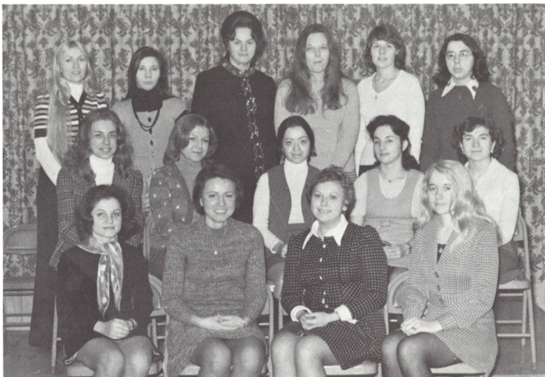
104 ВІДДІЛ СУА НЬЮ-ЙОРК