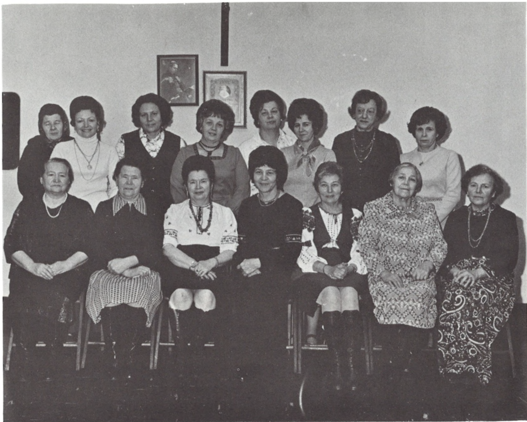
67 ВІДІЛ СУА ІМ. КНЯГИНИ ОЛЬГИ ПЕРТ АМБОЙ, Н.ДЖ.