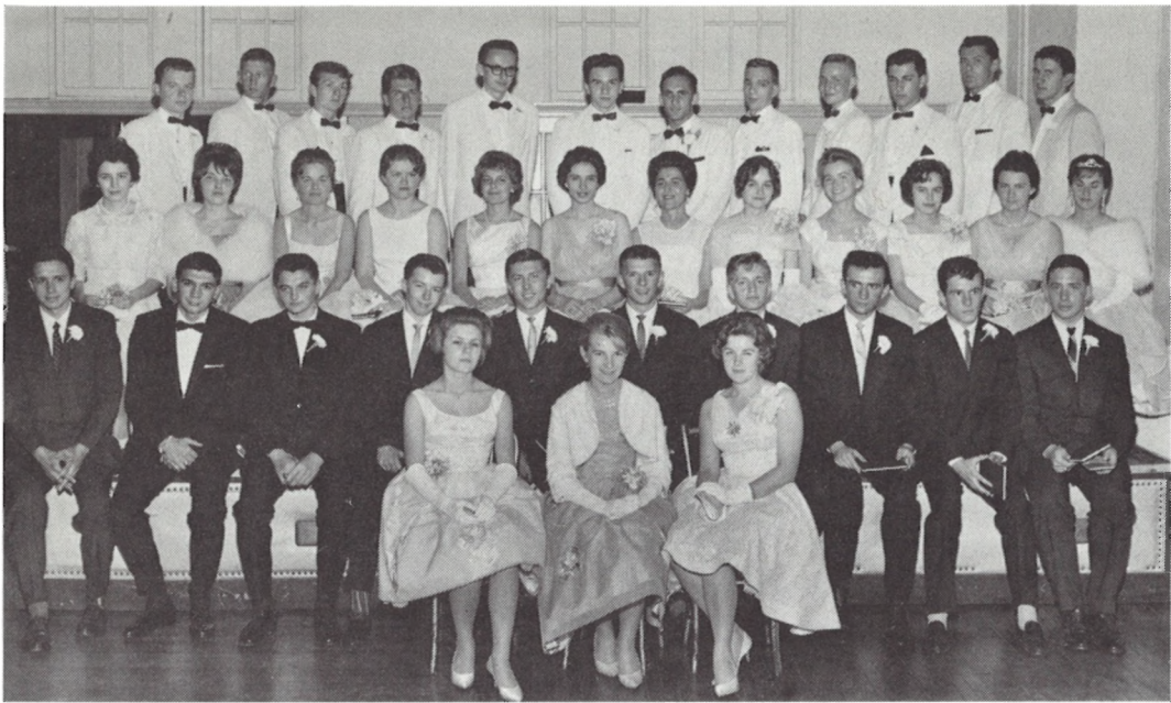
ПЕРША ЗАБАВА ГРАДУАНТОК — Окружна Рада Нью-Йорк

відзначено святочним бенкетом в 1955 р, а в 1970 р. відсвятковано 30-річчя Окружної Ради святочним бенкетом, з виставкою архівних матеріалів, альбомів і т. п. Окружної Ради і Відділів, виданням "Пам'яткової книжки" і створенням Фонду Купівлі Дому СУА в Нью-Йорку, що тепер нараховує 13. 451. 56 дол.