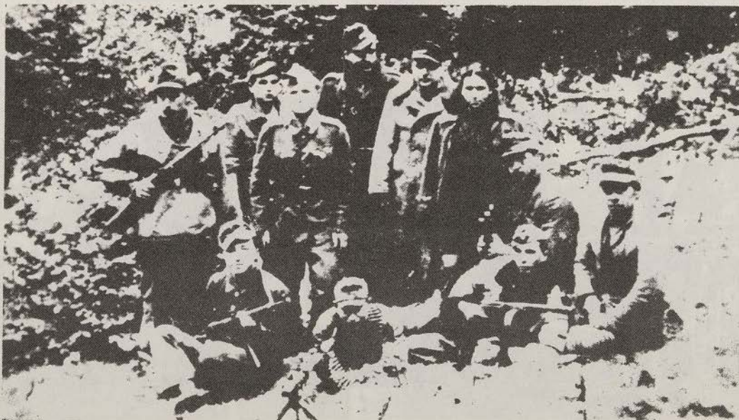
Weapons used by the soldiers of the Ukrainian People's Army were those captured from the enemy. In the above photo a unit of the UPA poses with weapons captured from the Russians.