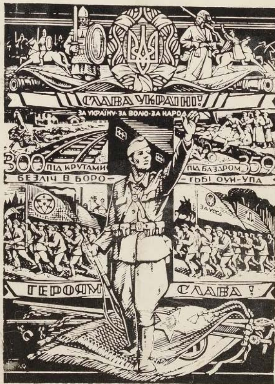
ДЕРЕВОРИТ ВОІНА УПА, НІЛА ХАСЕВИЧА /1949/