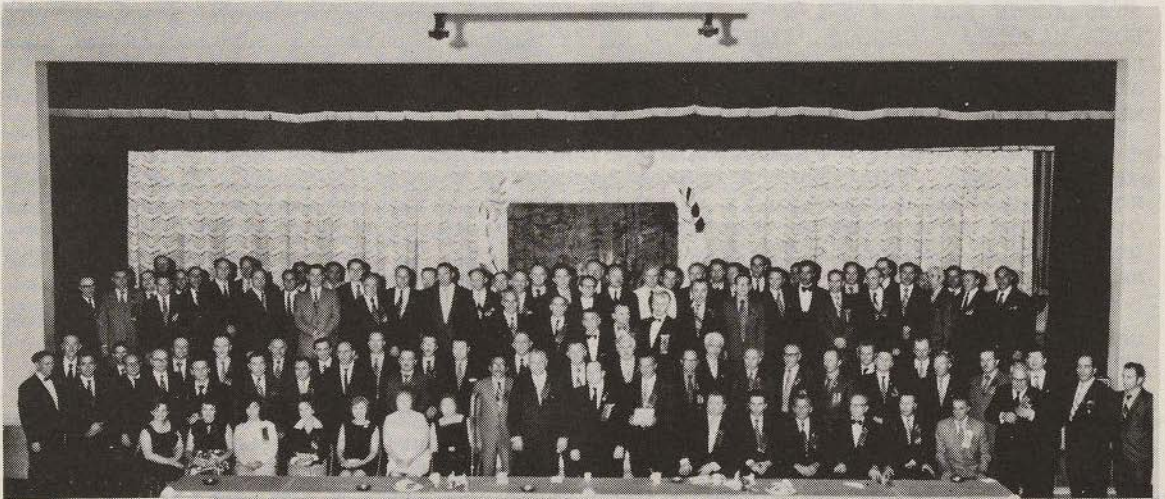
ЗУСТРІЧ - З'їзд членів Товариства й Об'єднання колишніх вояків УПА з нагоди 30 - ліття ПОСТАННЯ УКРАЇНСЬКОЇ ПОВСТАНСЬКОЇ АРМІЇ та 25 - ліття ВЕЛИКОГО РЕЙДУ УПА НА ЗАХІД.

НЕХАЙ ВІЧНА БУДЕ СЛАВА ТИМ, ЩО ЗАГИНУЛИ В ЦІЙ БОРОТЬБІ ЗА УКРАЇНУ - - І ТИМ, ЯКІ С Ъ О Г О Д Н І П Р О Д О В Ж У Ю Т Ь Ц Ю Б О Р О Т Ь Б У !