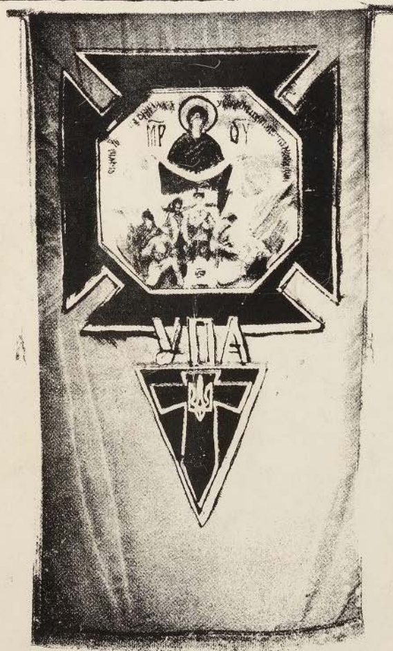
СВЯТА ПОКРОВА — ОПІКУНКА У.П.А.

О Д Н О Д Н І В К А з нагоди ВІДКРИТТЯ ПАМ'ЯТНИКА УПА У ЮВІЛЕЙНОМУ РОЦІ — 40-РІЧЧЯ — УКРАЇНСЬКОЇ ПОВСТАНСЬКОЇ АРМІЇ