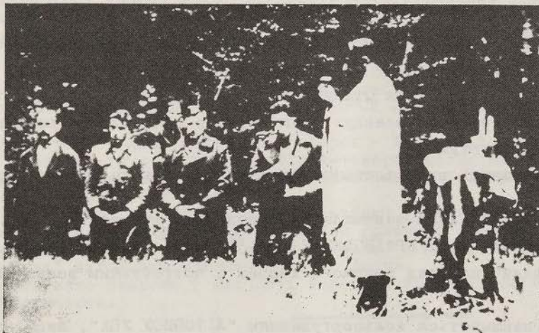
Ukrainian soldiers attend religious services in the field. Priest is preparing to give kneeling soldiers holy communion.

УПА складалася із 80-ти батальйонів, які ділилися на три райони: Північ - 34 батальйони, Південь - 8 батальйонів і Захід 38. Окремі, незалежні одиниці, в числі біля 2,000 осіб, оперували в околицях Києва, Харкова, Кременчука, Умані, Одеси, Кривого Рога, Дніпропетровська, Криму й Донецького Басейну.