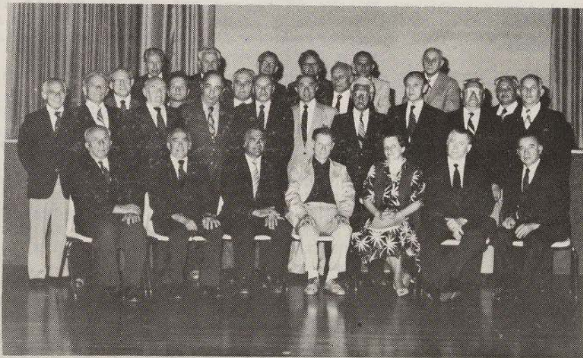
Громадський Комітет Побудови Пам'ятника УПА в Клівленді