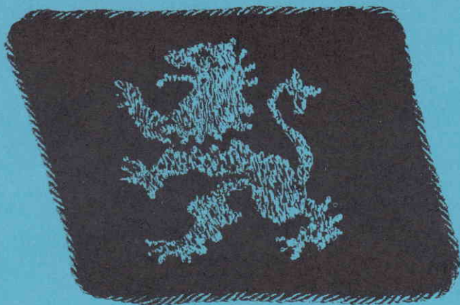
Відзнака вояків Дивізії на комір (срібний лев на чорному тлі)