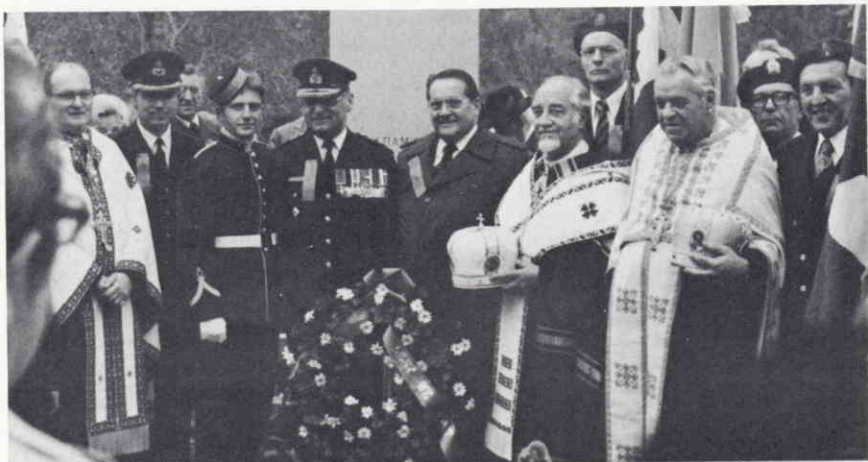
ПОСВЯЧЕННЯ ПАМ'ЯТНИКА НА ПОШАНУ ПОЛЯГЛИХ УКРАЇНЦІВ-КАНАДЦІВ, ВОЯКІВ ЗБРОЙНИХ СИЛ КАНАДИ Неділя, 5 жовтня 1980 р.