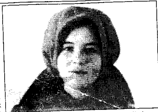
Одна з жертв голоду в с. Михайлівка