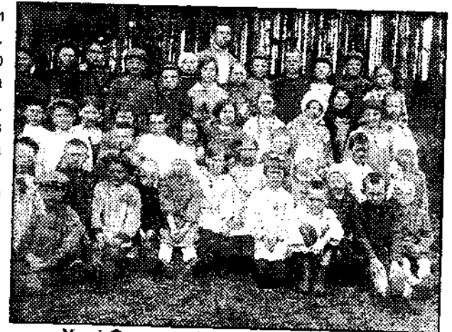
Учні Северинівської школи в урочищі Ярмаківщина, 1928р.