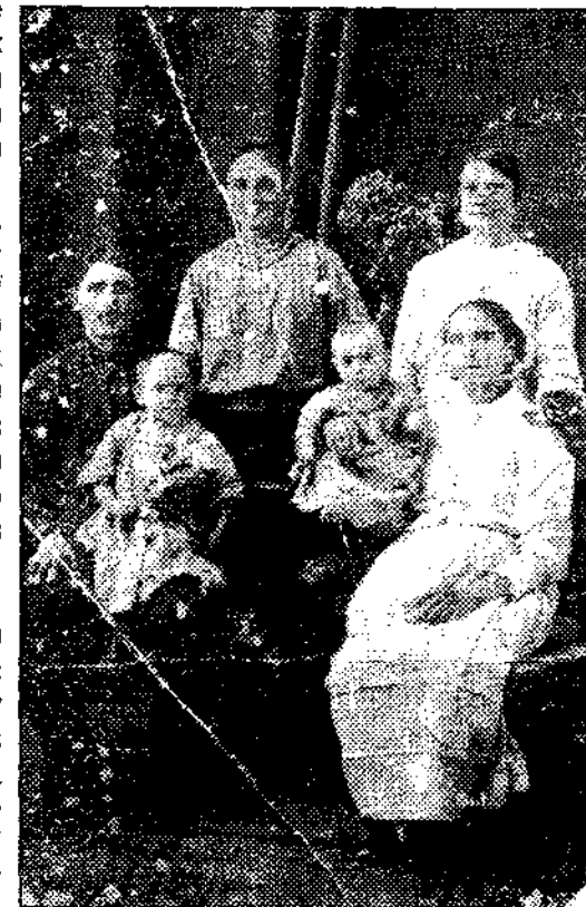
Родина Білокур, фото 20-х років

Люди мерли, як мухи. Помираючи – дичавили: в одній сім'ї рідна дочка приховала від матері ополоник затірок 1) – цього ж дня мати померла, в іншій - мати і батько поїли власних дітей. По всьому селу ходили голі, обірвані люди, котрі просили хоч що-небудь з'їсти, плакали і помирали на ходу, на лавках, у дорозі, у ярах. Людей кидали в ями, у погребі, а найчастіше – де помирали, там і ховали. По селу ходили активісти, котрі забирали худобу, зерно.