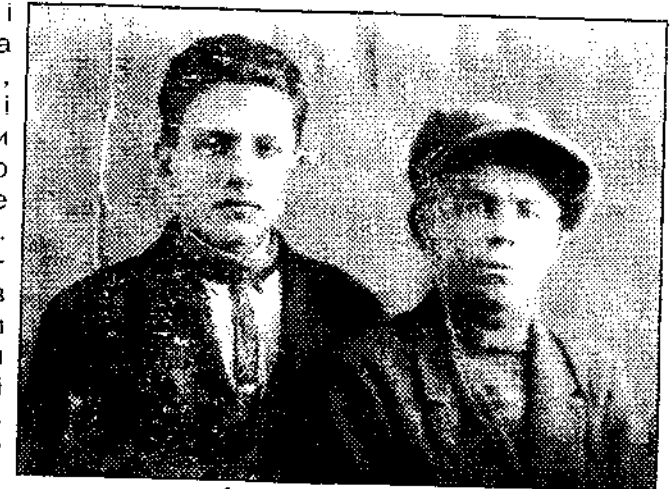
Активісти с. Михайлівка 1933р.