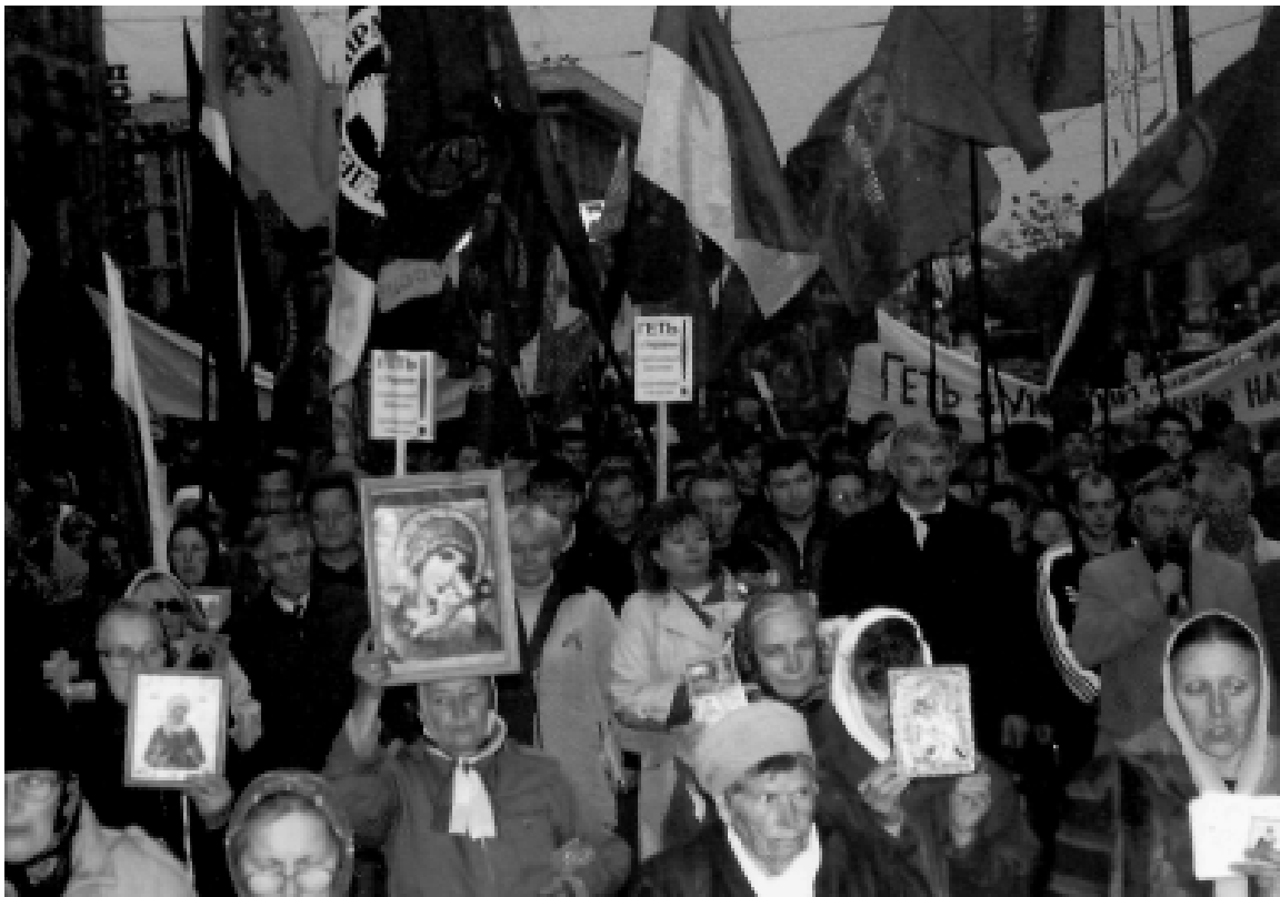
Православные граждане вместе с народом против неонацизма и агрессивности униатов