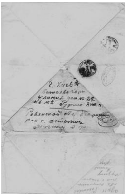
Адрес на конверте «треугольнике».

Апологеты украинского (галицийского) национализма, стремясь обелить и реабилитировать бандеровщину, запустили в массовое сознание миф будто бы воюки ОУН-УПА, борясь «за свободу» Украины, не нападали на солдат Советской Армии, а все свои силы направляли на борьбу с партийно-советским активом, сотрудниками госбезопасности и внутренних дел. Эта ложь опровергается многочисленными фактами, в том числе и содержанием публикуемого письма.