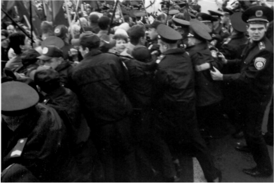
Защита неонацистов от народного гнева