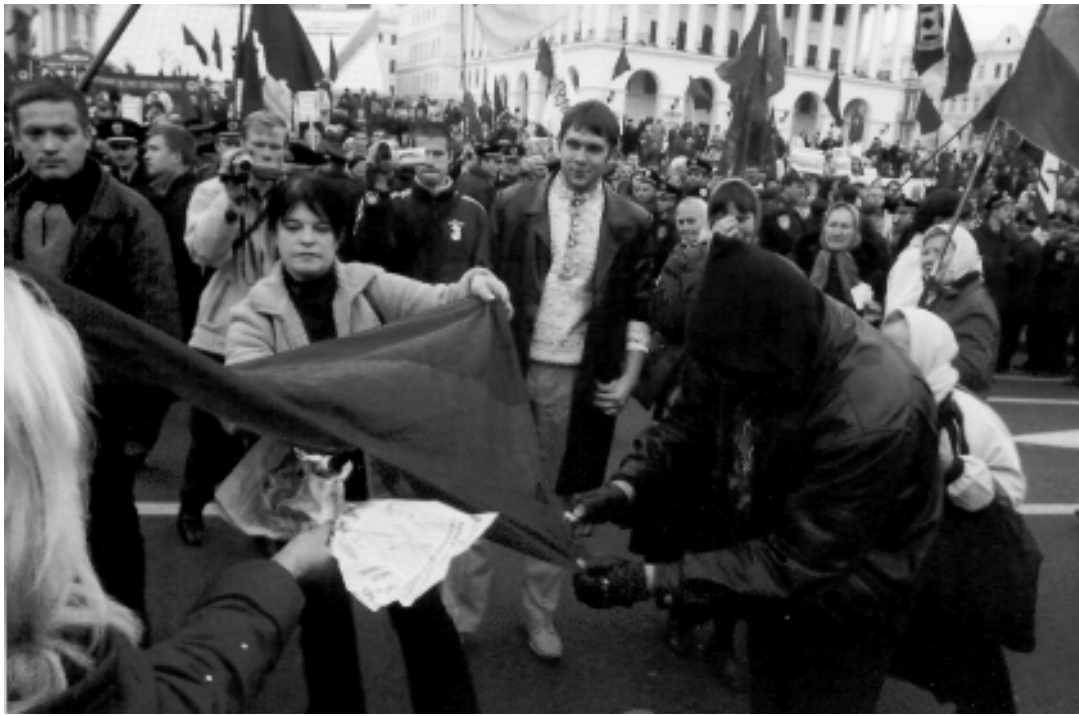
Протестующие сжигают флаги бандеровцев