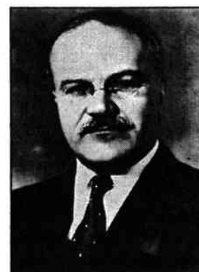
Молотов (Скрябін) В.М.