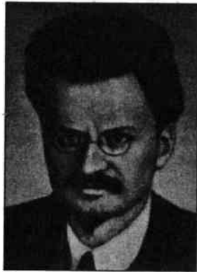
Троцький (Бронштейн) Л.Д.