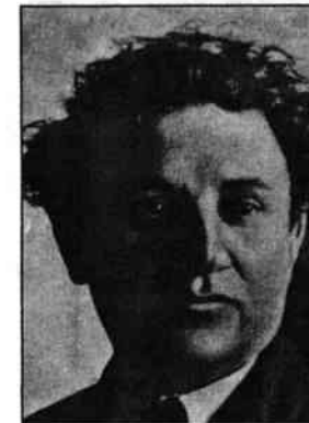
Зінов'єв (Апфельбаум) Г.О.