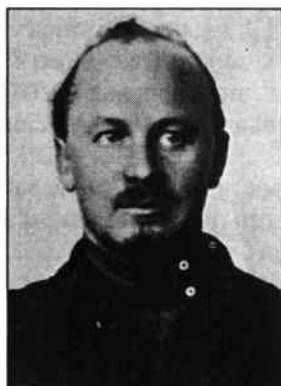
Бухарін М. І.