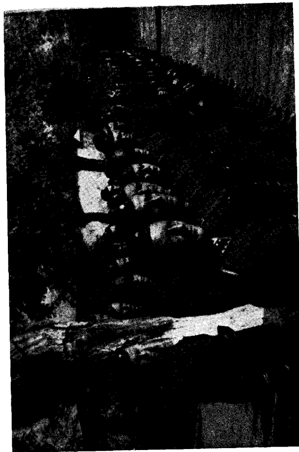
Сотня Південної Групи ДУН-у під час підношення національного прапору в Завберздорфі (Перший зліва в першому ряді мйр. Є. Побігушій)