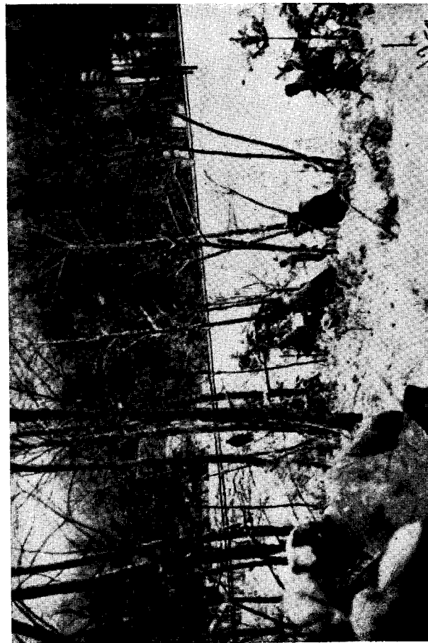
Підхід роя ДУН-у до наступу

До пор. Сидора прийшла делегація білорусів із проханням евакуювати з міста бодай тих громадян, які найбільш загрожені з боку большевиків. Майор дав згоду забрати тих нещасних людей з нами до Л. По обіді покидали ми У. Із сльозами в очах, з виявом щирого жалю й тривоги прощали мешканці міста наших друзів, які так довго й героїчно боронили їх перед большевицькими бандами. На жаль маємо наказ відійти, і ті бідні добросердні білоруси залишаються безборонними на поталу ворогові. Також місцева поліція,