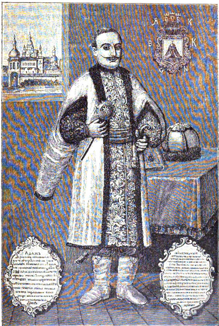
Кіевскій воевода Адамъ Кисель. † 1653 г.