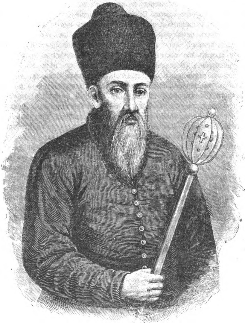
Гетманъ Пётръ Конашевичъ Сагайдачный † 1622 г.

была теперь для Польскаго государства вопросом о томъ, быть ему, или не быть? Сагайдачный не отказался придти на помощь,—хотя и выставилъ при этомъ нѣкоторыя свои условия и привелъ подъ Хотинъ уже тридцать тысячъ козаковъ. Блестящей Хотинской побѣдой, спасшей Польшу, были обязаны до-