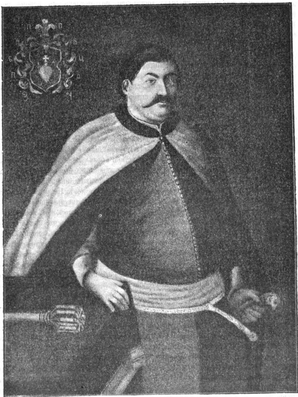
Наказной гетманъ Павелъ Полуботокъ. † 1724 г.