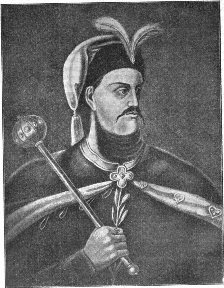
Гетманъ Петръ Дорошенко. † 1676 г.