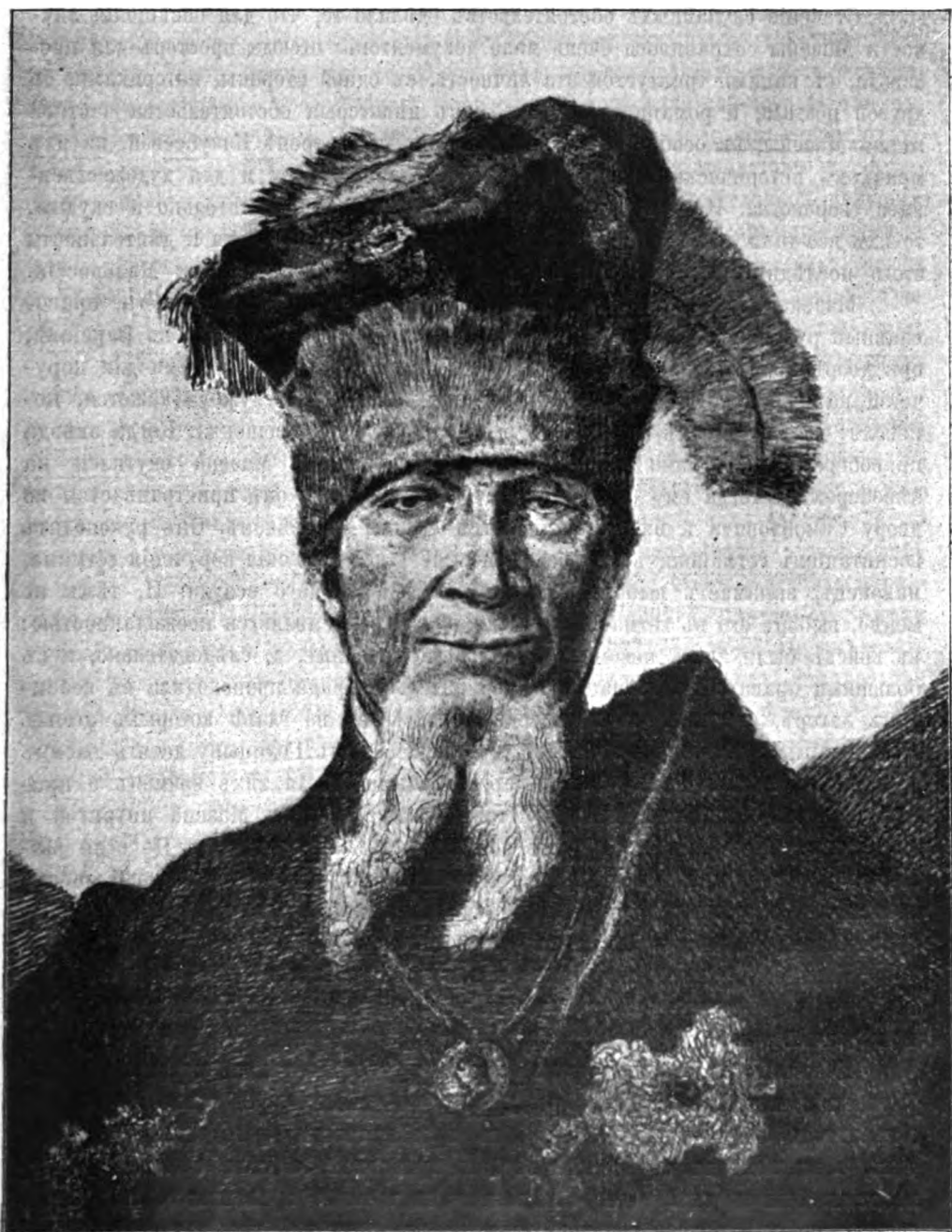
Гетманъ Иванъ Мазепа. По гравюрѣ Норблена.