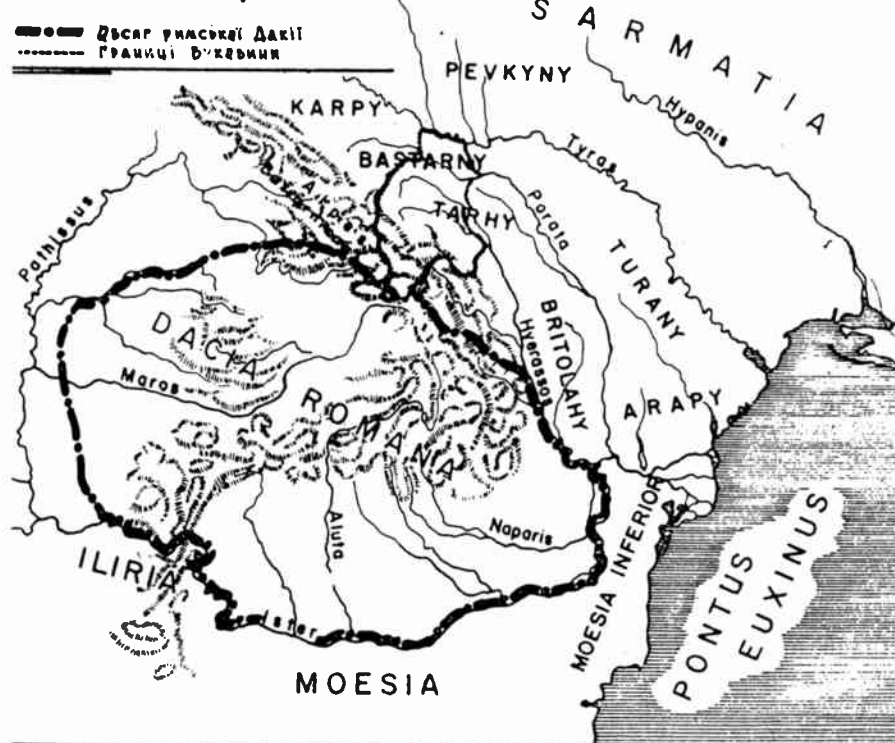
Прикарпатські країни в II - III ст. по Хр.