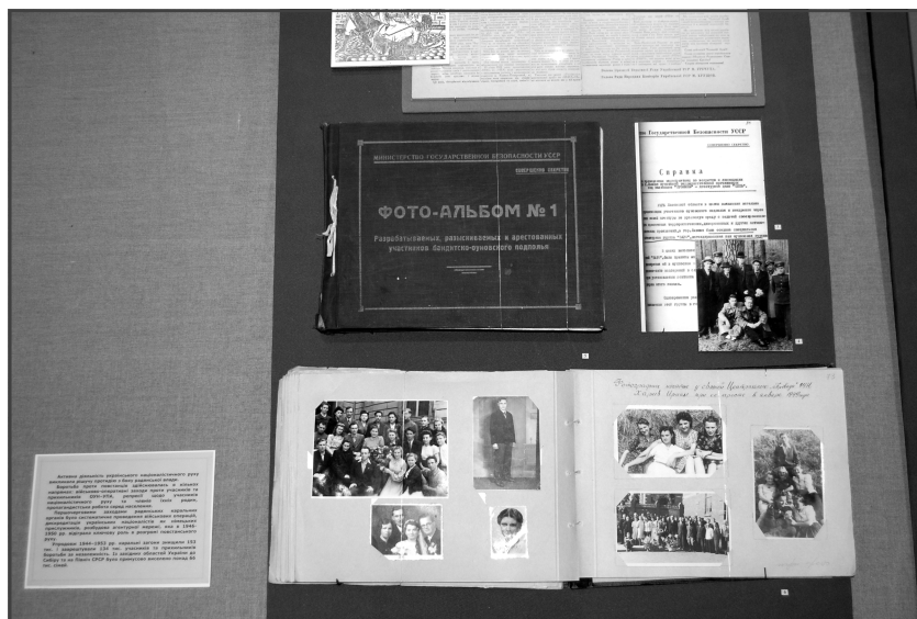
Стенд виставки з матеріалами Галузевого державного архіву Служби безпеки України.

ричної об'єктивності, із залученням як давно відомих, так і малознаних або і зовсім невідомих широкому українському загалові документів та особистих речей лідера ОУН. Таким чином, виставка має неабиякий пізнавальний характер і подає достатньо виважений погляд на постать С. Бандери — з нею буде цікаво ознайомитися як фаховим історикам, так і громадянам, які практично необізнані з історією українського визвольного руху. Особливо слід наголосити, що експозицію зможуть побачити учні київських шкіл та студенти вищих навчальних закладів, які є постійними відвідувачами музею.