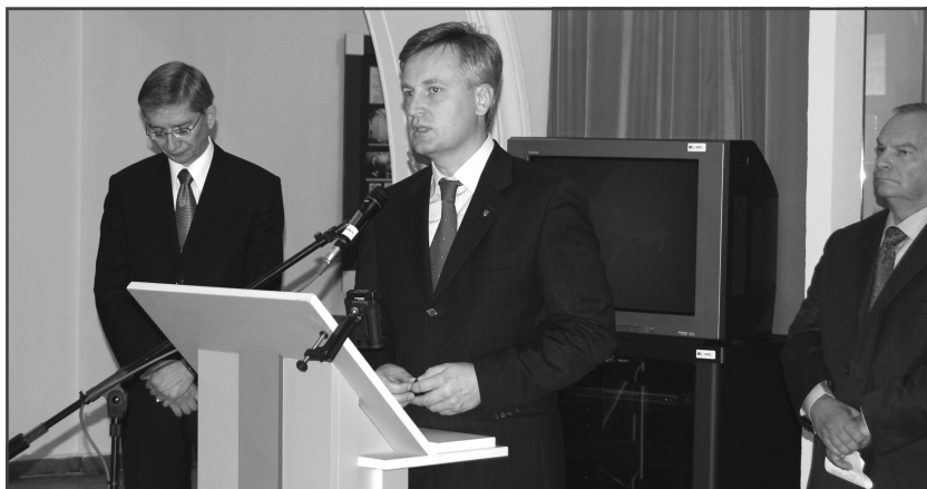
Виступ Голови Служби безпеки України Валентина Наливайченка.