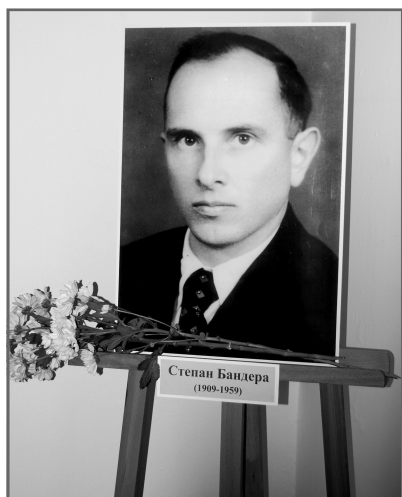
С. Бандера (1909–1959).

До 100-річчя з дня народження і 50-річчя трагічної загибелі найвідомішого діяча українського визвольного руху Степана Бандери (1909–1959) Національний музей історії України підготував спеціалізовану виставку. Це перший випадок, коли у столиці України презентовано велику експозицію, присвячену діяльності керівника Організації українських націоналістів.