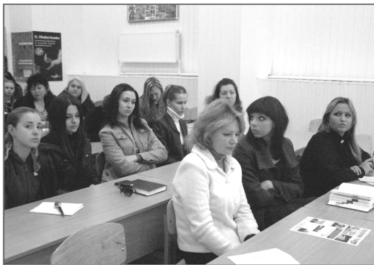
Студенти Інститутів журналістики й телебачення, кіно і театру.

С. А. Кокін розповів про передумови й причини створення державного архіву спецслужб. У першій половині 1990-х рр. за умов зростання наукового й громадського інтересу до архівної спадщини було вжито заходів щодо введення до системи Національного архівного фонду (НАФ) України документального масиву, котрий утворився у процесі оперативно-службової діяль-