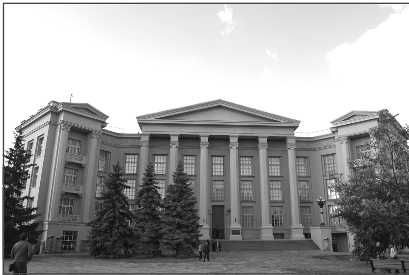
Національний музей історії України.

Виставка експонуватиметься у залах Національного музею історії України до лютого 2010 р. Рекомендуємо всім бажаючим відвідати її, адже подібної експозиції про керівника українського визвольного руху у Києві ще не було.