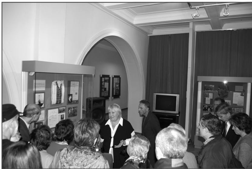
Екскурсія для відвідувачів виставки.