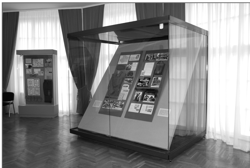
Стенди виставки з матеріалами Галузевого державного архіву Служби безпеки України.

Із фондів ГДА СБ України на виставці представлено надзвичайно цікаві документи. Серед них — архівна кримінальна справа на розстріляного НКВС СРСР отця Андрія Бандеру — батька Степана (з матеріалами за 1940–1941 рр.), маловідомі