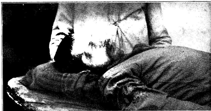
Неизвѣстный, убит гайдамаками на ст. Ромодан (Доставлено в еврейское министерство Миргородским общинным совѣтом)