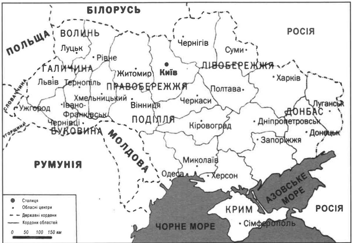
Карта 1. Сучасна Україна