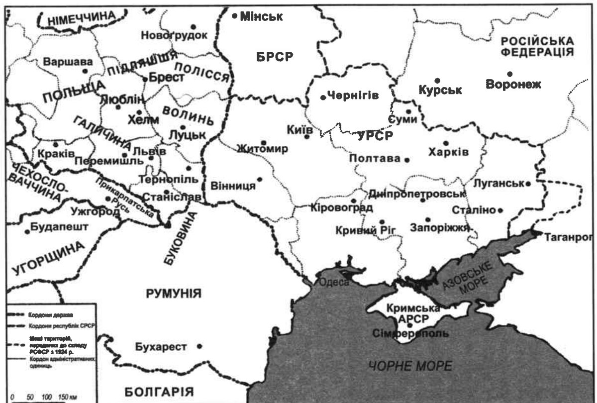
Карта 4. Україна між двома Світовими війнами