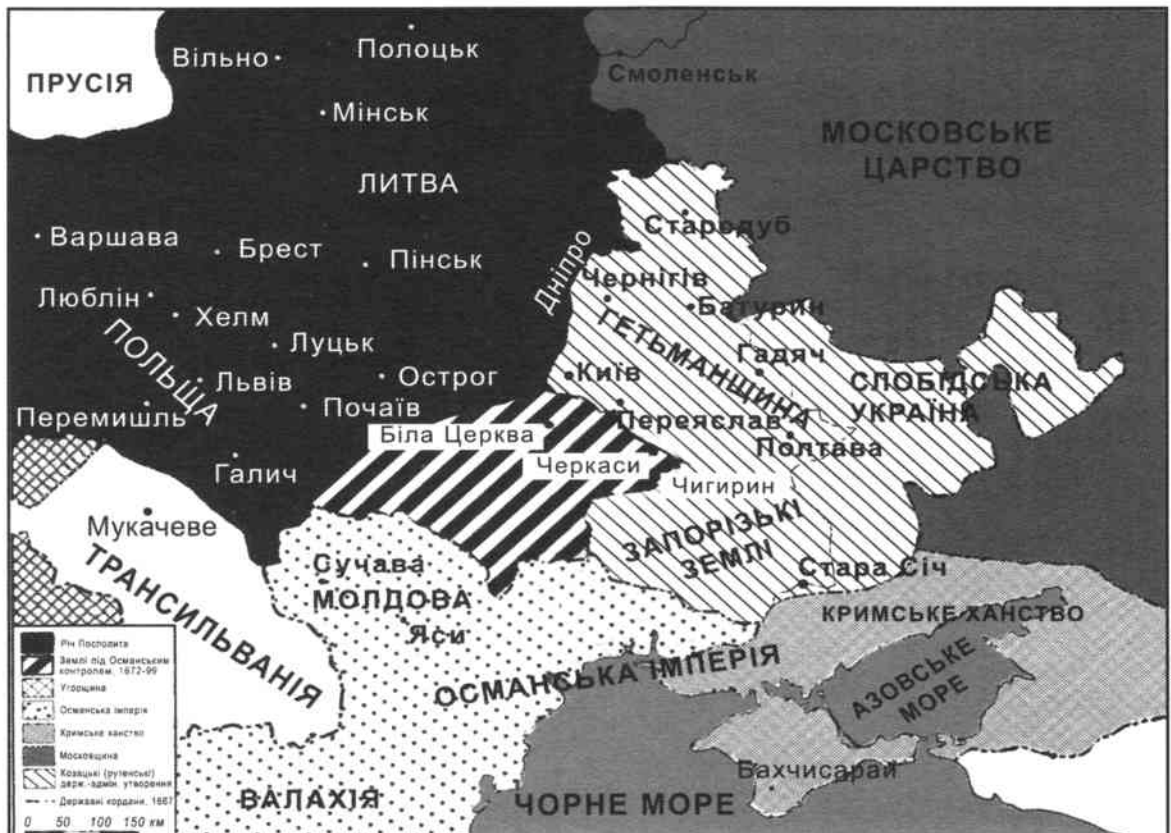
Карта 2. Україна в XVII столітті