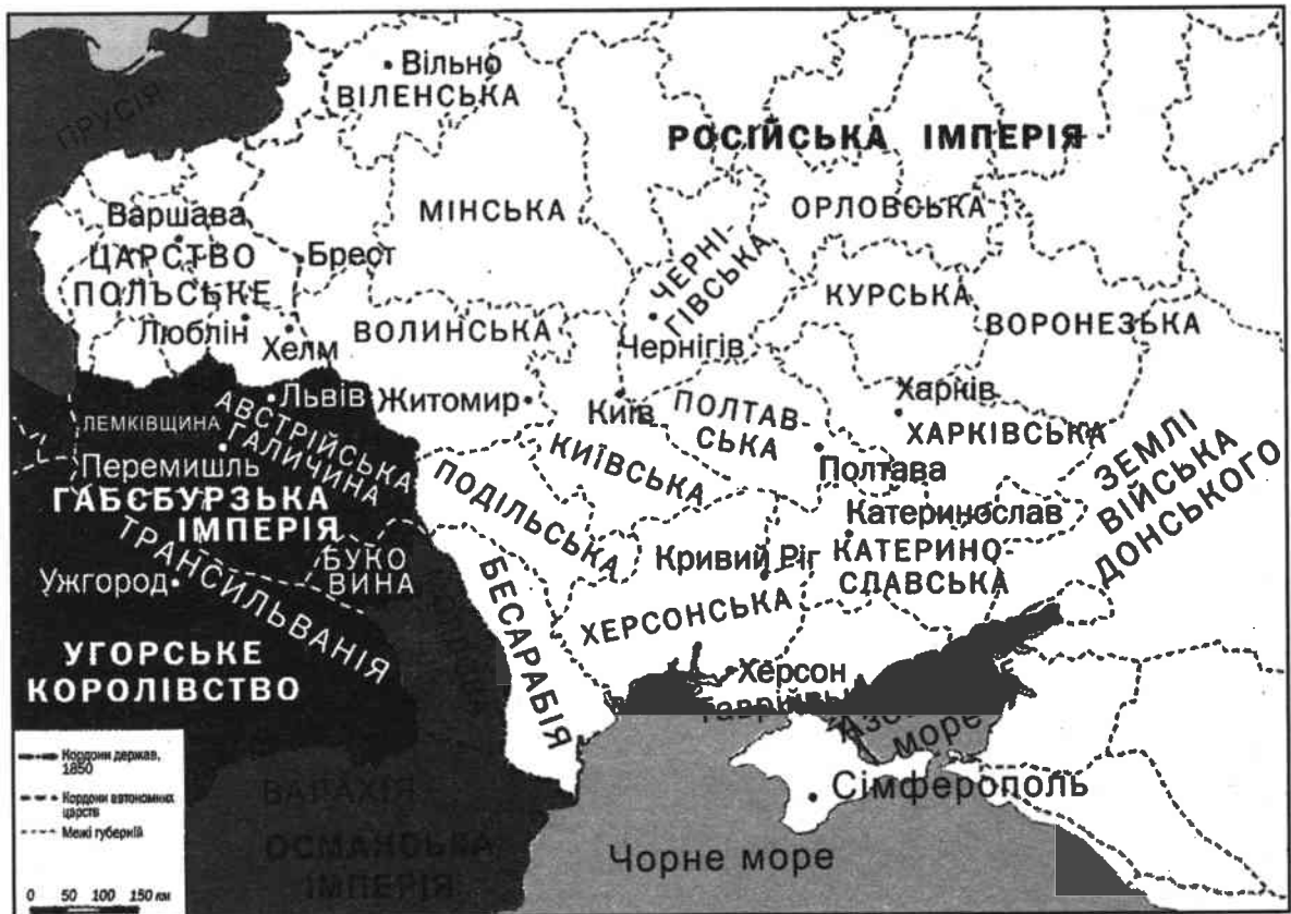
Карта 3. Україна в XIX столітті