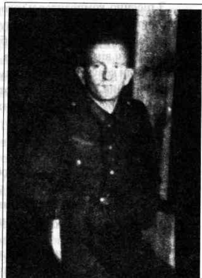
Роман Шухевич у лавах ДУНу

Настрій курсантів був діловий і разом з тим дружній, інколи й веселий. Кожен старався якнайбільше навчитись, пізнати, засвоїти. Характерною прикметою Романа Шухевича була його скромність, він ні в чому не показував своєї вищості над іншими, не хвалився своїми бойовими вчинками в минулому. Був такий, як усі, і в той же час трохи не такий. Виділявся своєю силою волі, сконцентрованою думки та цілеспрямованою енергією. На вечорах, що їх курсанти інколи влаштували, був дуже цікавим розповідачем. Любив згадувати про свої юнацькі пригоди. Спонукав інших розповідати про те, що у їх новому житті було найцікавіше чи найсмійніше. Коли було в хаті піаніно, він міг заграти на ньому якусь популярну народну чи стрілецьку пісню.