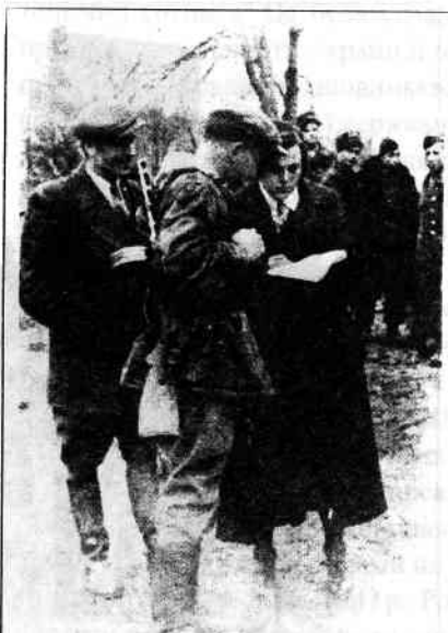
Роман Шухевич (перший зліва) на Конференції поневолених народів. с. Будераж Рівненської обл., листопад 1943 р.

боротьбу. Було ще й багато інших проблем, які вимагали негайних рішень. Збирати усіх членів Проводу для нарад було важко у зв'язку з фронтовими діями та вимогами конспірації.