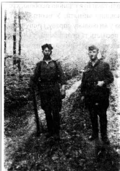
Роман Шухевич з охоронцем

них сил у боротьбі проти московсько-більшовицьких поневолювачів України та поширення цієї боротьби поза межі нашого краю.