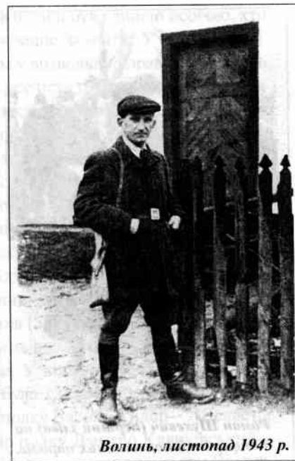
Волинь, листопад 1943 р.

вона зростає кількісно й якісно. Майже вся лісова смуга України, зокрема Полісся і Карпати, були опановані повстанськими загонами УПА й творили своєрідні повстанські республіки. Однією з ключових проблем повстанської боротьби була справа переведення багатотисячних відділів УПА в тили советської армії, для чого необхідно було пробратися через два фронти: німецький та советський. Частина кадрів потрібно було відправити в країни Західної Європи для пропаганди й поширення інформації про нашу