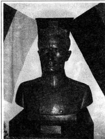
Погруддя Романа Шухевича роботи скульптора Михайла Череш- ньовського, 1980-ті роки

членів. Довгий час працює бойовим референтом у Крайовій ексекутиві ОУН на цьому посту віддає всю свою кипучу, молодецьку енергію, всі свої організаторські здібності й відвагу. За свою революційну, політичну та бойову діяльність проти польських окупантів потрапляє до польської тюрми. 1938-1939 рр. бере активну участь у створенні збройної сили молоді української держави на Закарпатській Україні – у створенні Карпатської Січі та в керівництві нею. У 1939-1940 рр. працює у Проводі ОУН на посаді референта зв’язку з Українськими Землями в ССР. У 1940-1941 рр. входить до складу Революційного Проводу ОУН. Навесні 1941 р. бере участь у II Великому Зборі ОУН. У 1940 р. був крайовим провідником ОУН на Західно-Українних Українських Землях поза межами ССР, у так званому генерал-губернаторстві. Впродовж усього цього часу