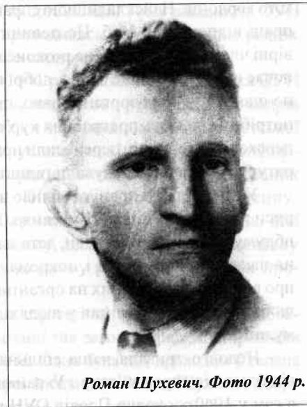
Роман Шухевич. Фото 1944 р.

З окупацією Західно-Українських Земель більшовиками всю систему зв'язку з Краєм треба було створювати заново. Зі старих зв'язків залишився діючим лише один пункт зв'язку у м. Гуменному для переправки підпільників через Словаччину на Закарпаття. Тепер ми вже спільно обдумували й налагоджували різні форми зв'язку з Україною вздовж усього німецько-советського та мадярсько-советсь-