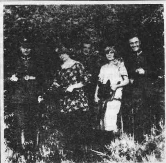
Під час служби у польському війську, 1929 р.

“Дзвін” разом із добрим своїм другом бойовиком Богданом Підгайним блискуче виконали доручене їм завдання. Поліції не вдалось викрити справжніх учасників цього замаху. Коли ж польський суд засудив за цей атентат зовсім не причетних осіб, Роман Шухевич і Богдан Підгайний просили командування УВО дозволити їм зголоситися й зізнатися у вчиненому атентаті, щоб звільнити невинних осіб, засуджених на довічну тюрму. Командування УВО такого дозволу не могло дати, бо це створювало б для польської влади прецедент на майбутнє. І хоч цей благородний намір Романа Шухевича і Богдана Підгайного не здійснено, він свідчить про їхні високоморальні духовні якості.