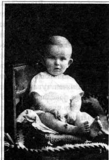
Світлина з дитячих років, 1908 р.

Був дуже здібним учнем, зокрема в математиці та українській мові... До професорів відносився з пошаною. Виклади усіх професорів слухав уважно, стараючись зрозуміти та запам’ятати все, про що даний професор говорив на лекції... До слів кожного, з ким розмовляв, прислухо-