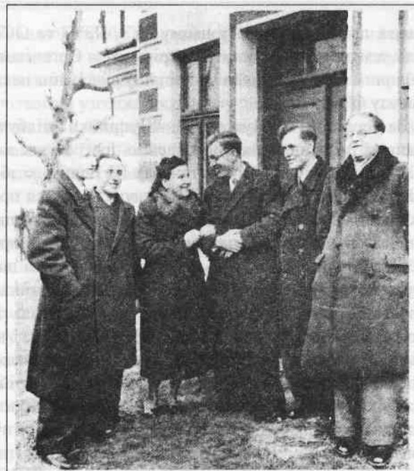
Роман Шухевич (перший зліва) в оточенні невідомих, 1943-1944 рр.

рішення відповідав перед “Богом, Нацією і власним сумлінням”, скасовано, замість нього впроваджено виборне трьохчленне Бюро (тріумвірат), відповідальне перед Проводом ОУН. Головні постанови й рішення Бюро та Проводу приймалися після їх спільного узгодження. При формуванні Бюро враховувався територіальний принцип,