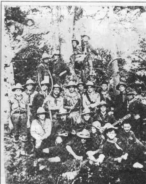
Роман Шухевич (другий ряд, третій зліва) під час пластових мандрівок, 1926 р.

ріках Західної України. Життя у “Пласті” дало юному Шухевичу прекрасне знання картознавства та теренознавства, що у військових операціях має першочергове значення. Та найголовніше, що давав “Пласт” своїм членам, – це виховання високої моралі, сильної волі, а передусім – формування активного патріота української нації.