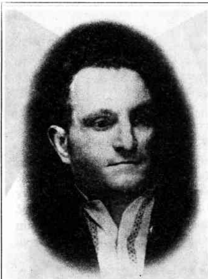
Посмертне фото Романа Шухевича

постійно працює у Головному Військовому Штабі ОУН як його член та викладає різні військові дисципліни на таємних курсах кадрів ОУН. 1941 р. славної пам'яті Роман Шухевич – “Тур” організовує й очолює як його командир, Український Легіон. Одночасно виконує різні особливі завдання Проводу ОУН. На цьому посту перебуває до кінця 1942 р. Навесні 1943 р. славної