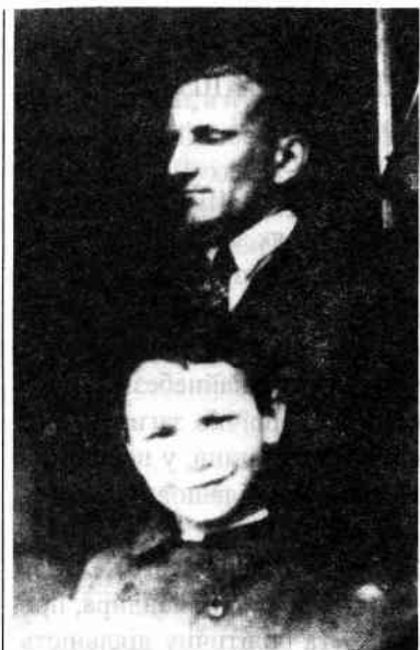
Роман Шухевич із сином Юрієм

Свій коротенький спогад обмежу подіями, про які досі нічого не сказано або сказано мало чи не зовсім так, як було насправді. Ім'я Романа Шухевича мені, як і тодішній молоді, було відоме ще з часу його діяльності у "Пласті", серед студентства та з преси, у якій згадувалось його ім'я у зв'язку з політичними процесами у Львові. Серед української інтелігенції родина Шухевичів була знана здавна, а у 1920-30-х рр. дуже популярним стало ім'я