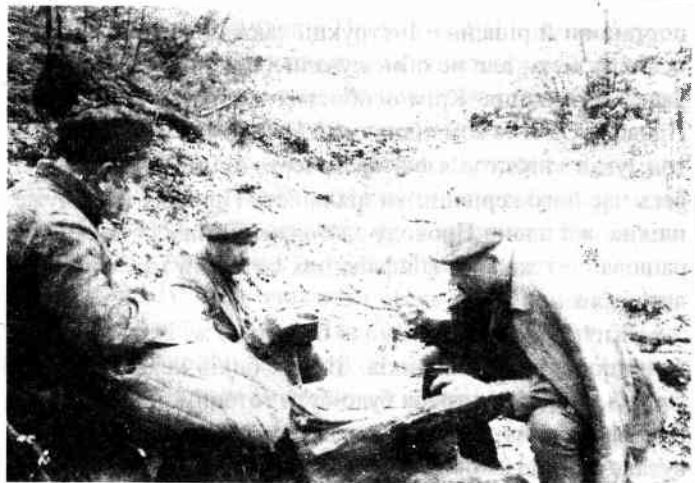
Роман Шухевич та Зіновій Тершаковець, провідник Львівського краю ОУН

Щоб бути в курсі світової політики, регулярно прослуховував закордонні радіоперсдачі. Добре володів німецькою мовою, а в підпіллі вивчив ще й англійську. Постійно поглиблював свої знання, зокрема уважно прочитував марксистську літературу.