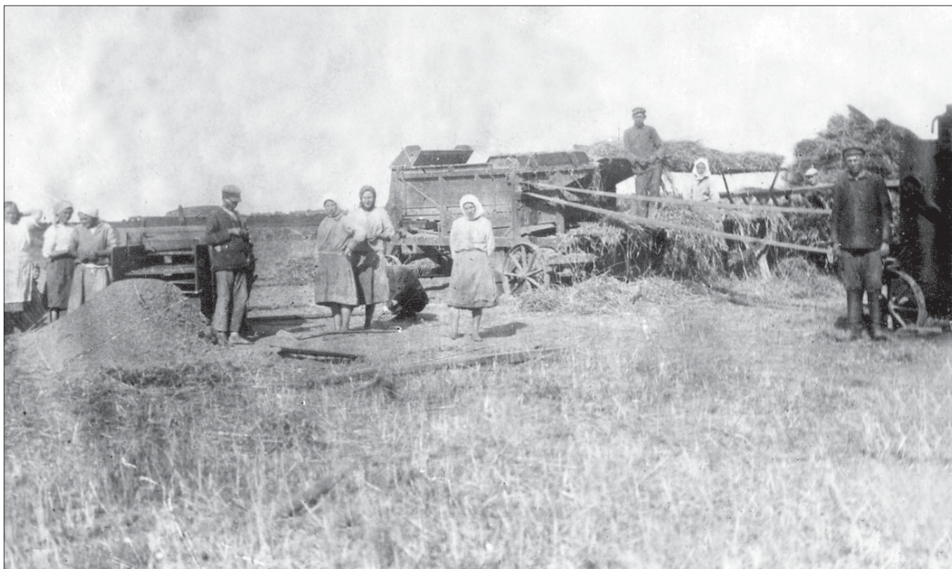
Молотьба в колгоспі ім. Комінтерна (с. Герасимівка Роменського р-ну). 1932 р.