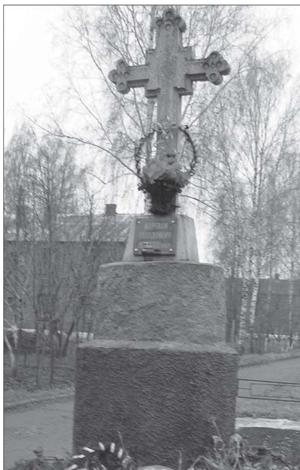
Пам'ятний знак жертвам Голодомору 1932-1933 років у м. Ворожба Білопільського району. Споруджено в 1993 році в центрі міста на місці масових поховань.