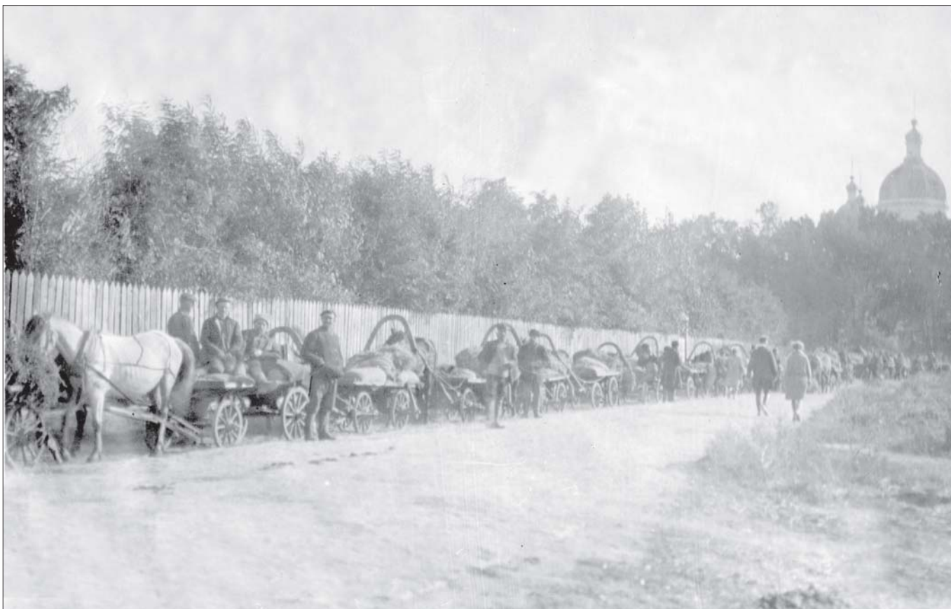
Червона валка із зерном урожаю 1929 р. (м. Ромни Олександрівська площа).