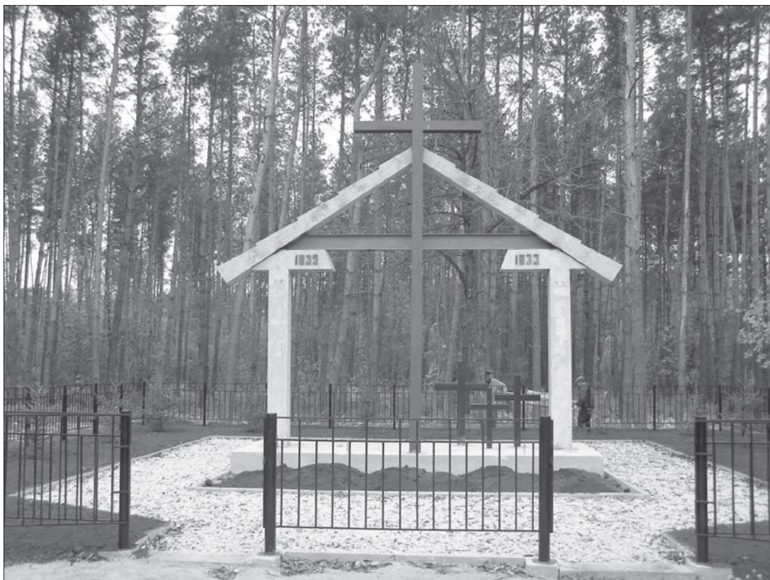
Обласний меморіал жертвам Голодомору 1932-1933 років у с. Піски Буринського району. Споруджено 24 листопада 2007 року на місці масових поховань.