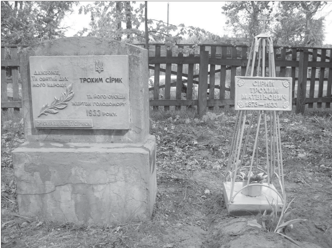
Пам'ятник Трохиму Сірику та його сусідам у с. Воронцове Кролевецького району. Споруджено у 1993 році за кошти сина-емігранта Григорія Сірика.