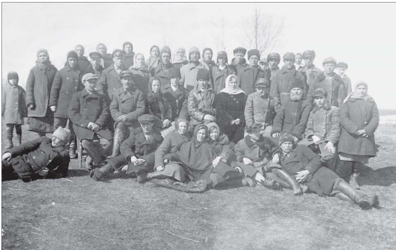
Колгоспні активісти "червона мітла" (с. Линове Путивльського р-ну). 1932 р.