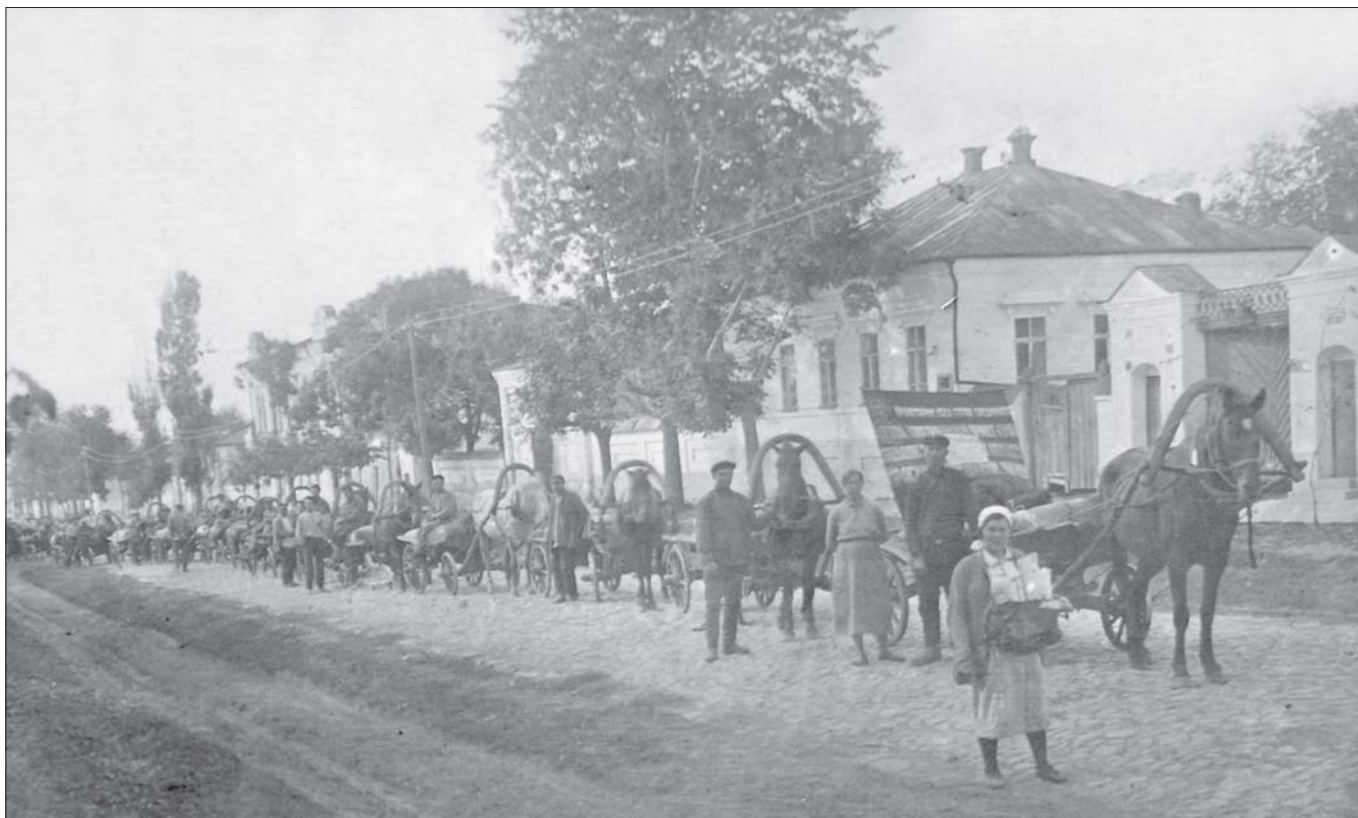
Заготівля зерна в колгоспі "Єдиний труд" (с. Яцине Путивльського р-ну). 1932 р.