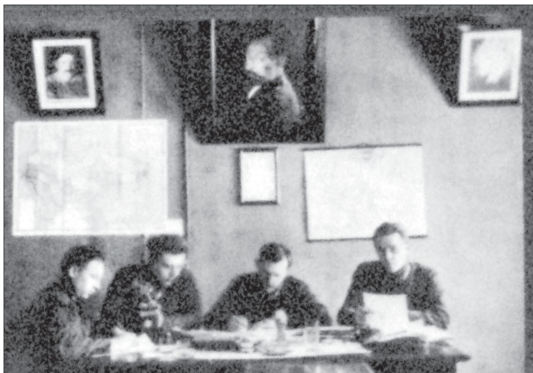
Співробітники Конотопського окрвдділу ДПУ активні учасники заходів щодо хлібозаготівель. 1930 р.