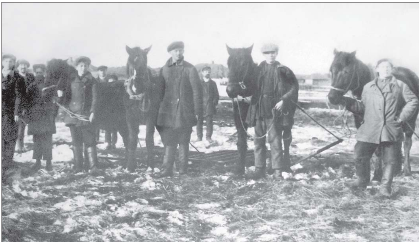
Виїзд на сівбу в колгоспі ім. Чубаря (с. Сиром'ятникове Путивльського р-ну). 1932 р.