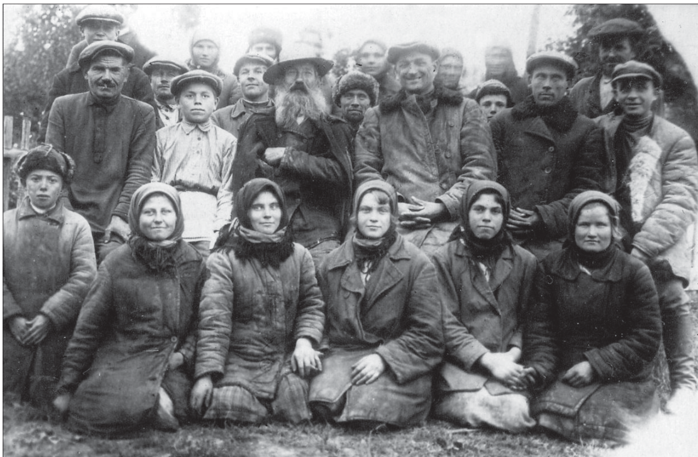
Ударники колгоспу ім. Петровського (с. Попівщина Роменського р-ну). 1933 р.