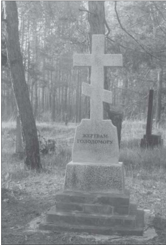
Пам'ятний знак жертвам Голодомору 1932-1933 років у с. Бишкінь Лебединського району. Споруджено 15 листопада 2007 року на центральному кладовищі.