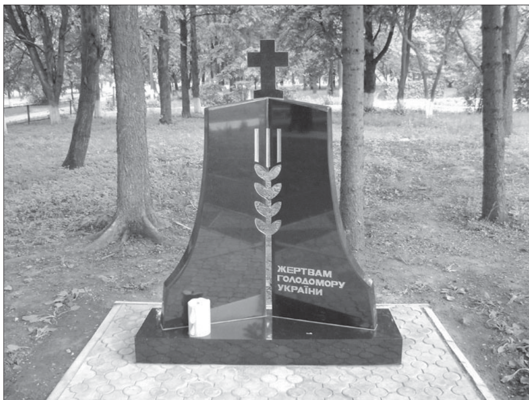
Пам'ятний знак жертвам Голодомору 1932-1933 років у с.Сад Сумського району. Встановлено 20 травня 2008 року на території сільського храму.