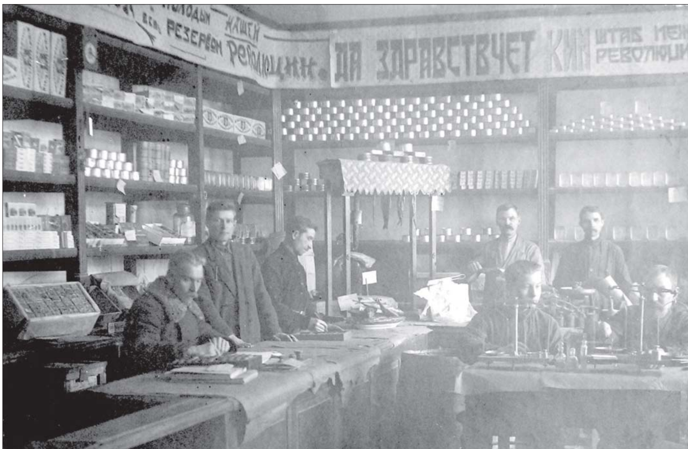
Магазин Торгсін (м. Путивль Путивльського р-ну). 1930 р.