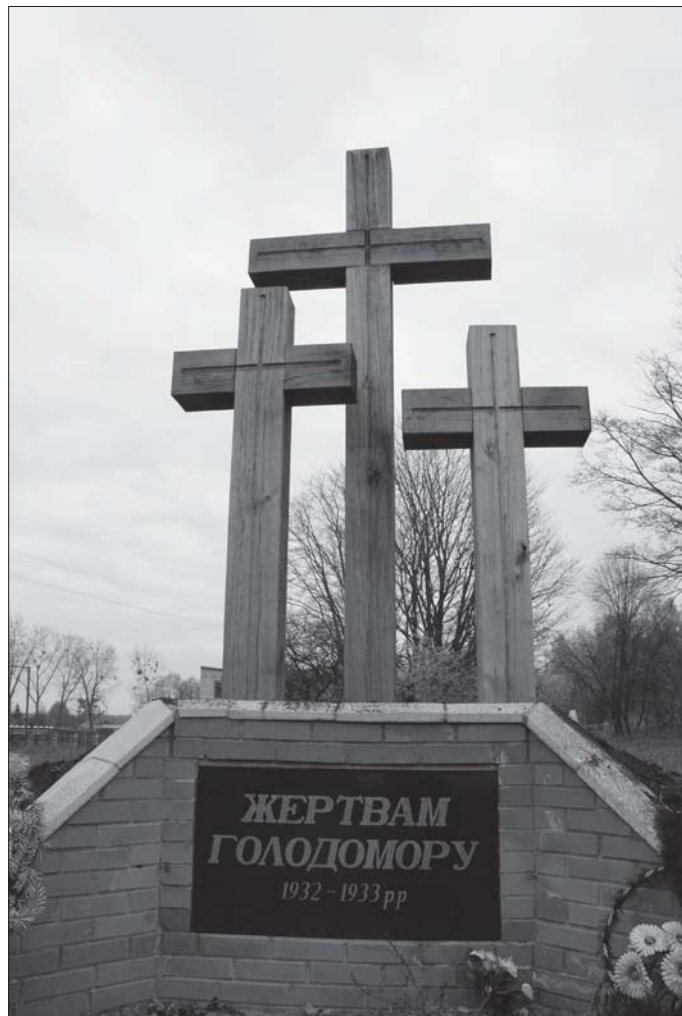
Пам'ятний знак жертвам Голодомору 1932-1933 років у смт Краснопілля. Споруджено в 2006 році на території старого кладовища.