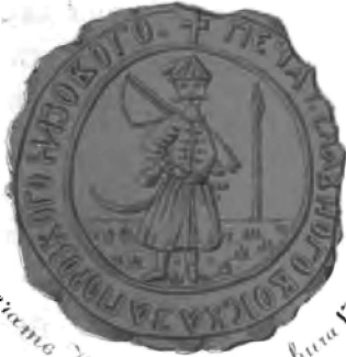
печатъ Новгородскаго Наместника 1734 г.