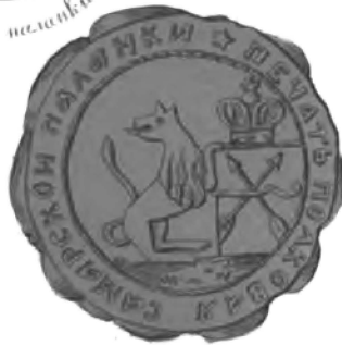
1770 г. г.