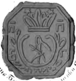
печатъ Благородной псалтыри 1740 г.