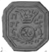
м. Покровской псалтыри 1750 г.