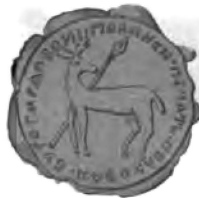
1770 г. г.