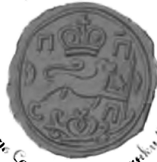
печатъ С.-успенской псалтыри 1750 г.