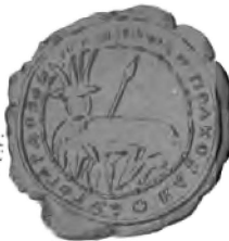
1750 г. г.