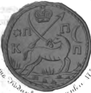
печатъ Покровской псалтыри 1770 г. г.