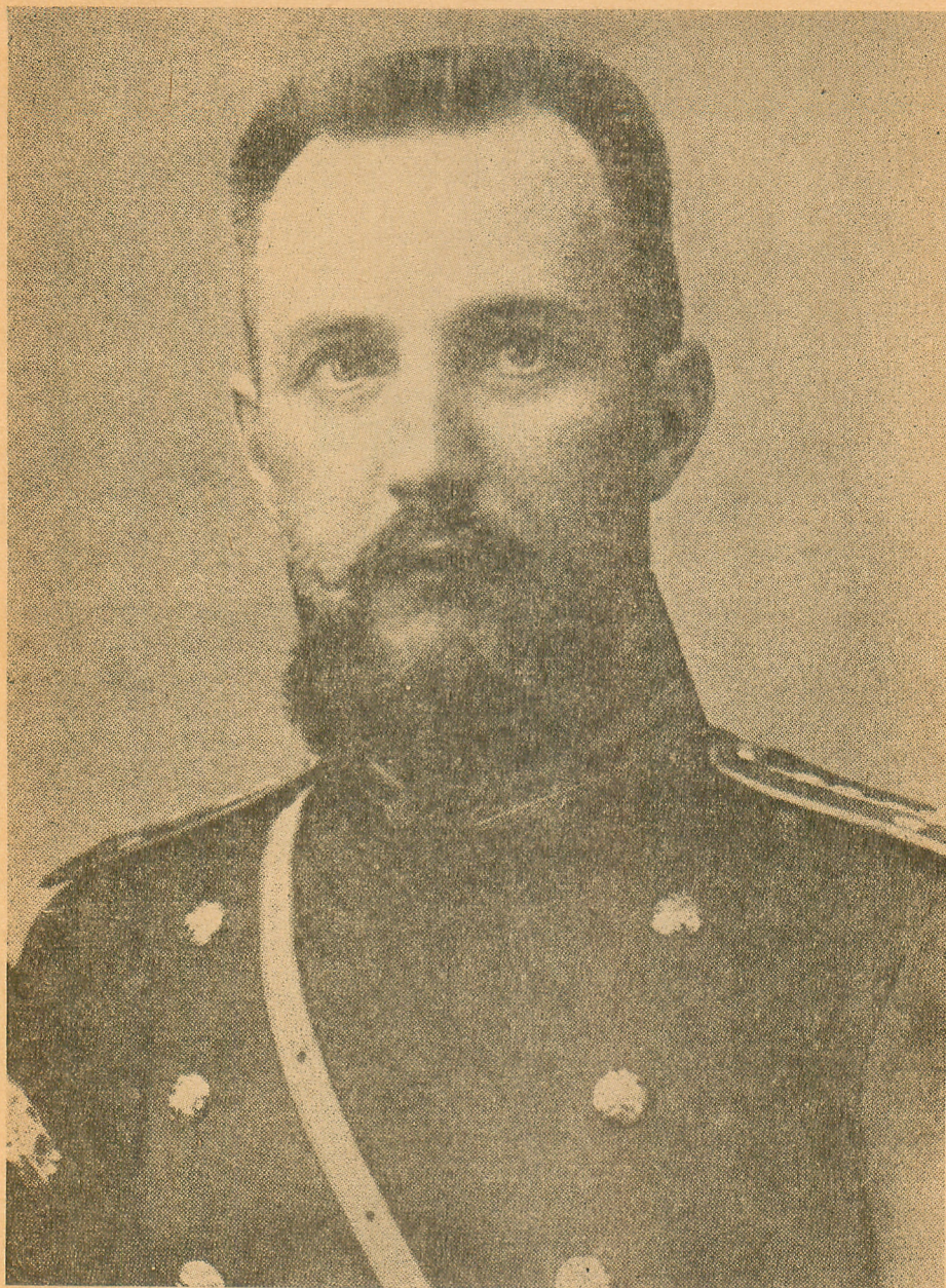
Ген. В. СІКЕВИЧ