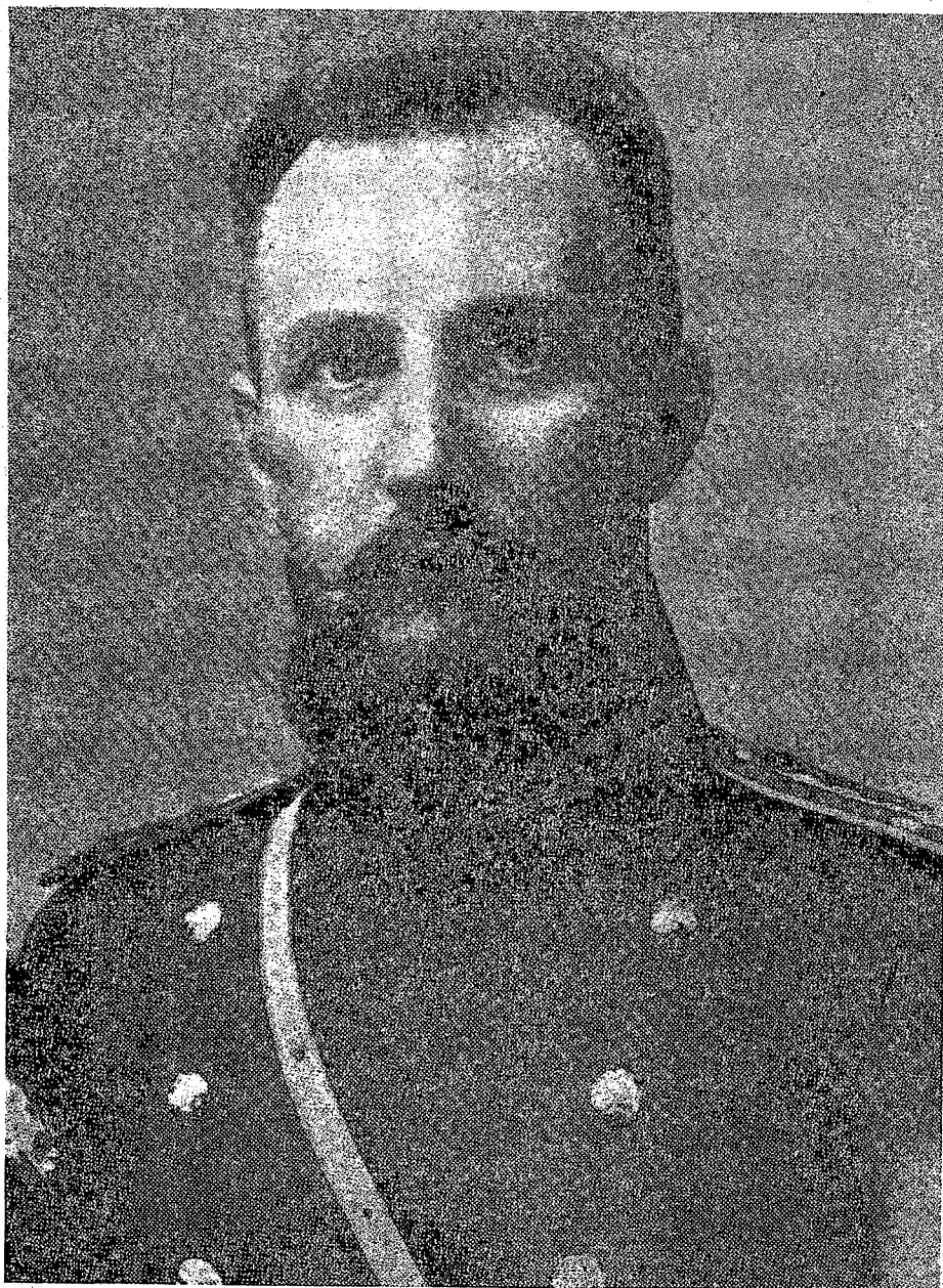
Ген. В. СІКЕВИЧ