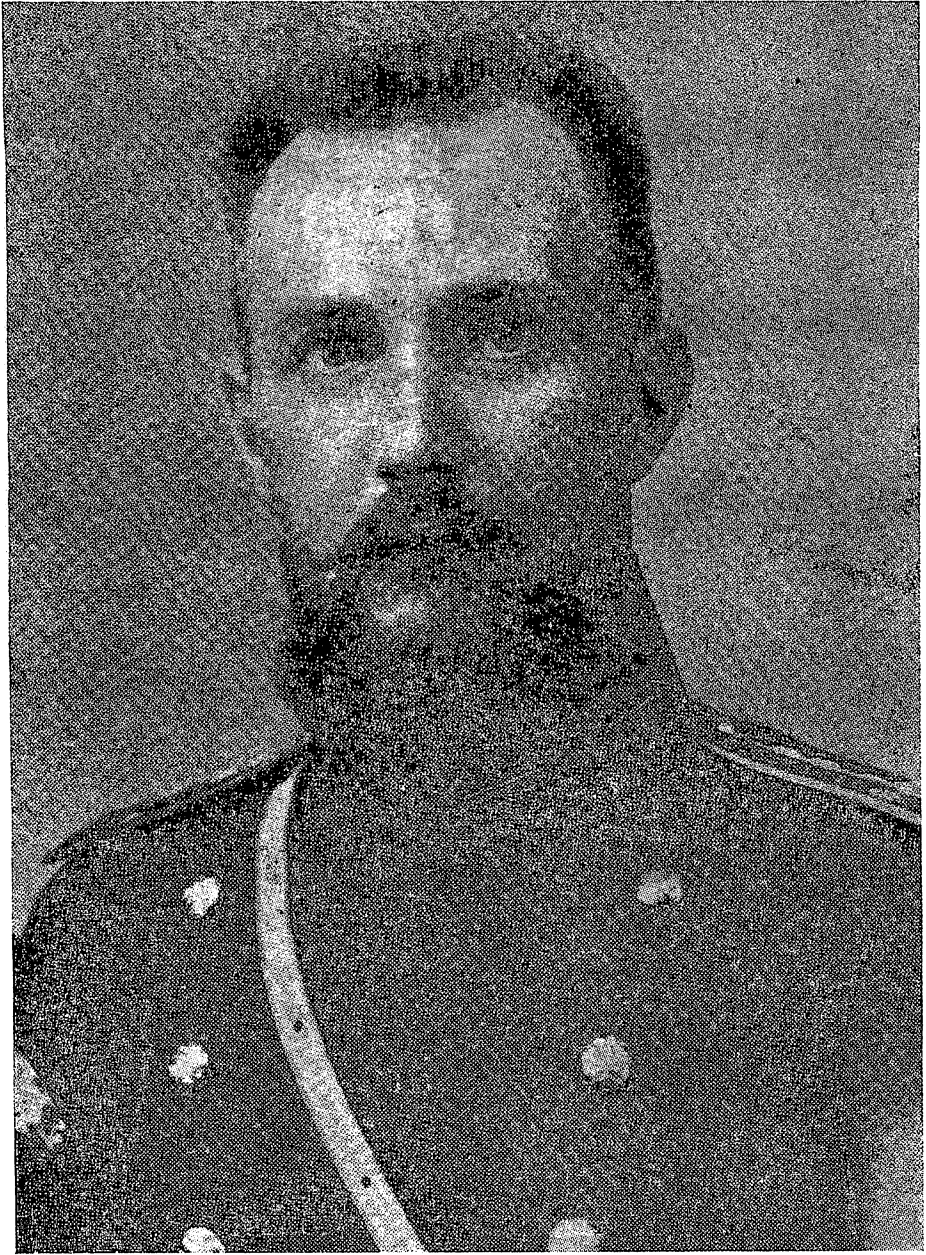
Ген. В. СІКЕВИЧ