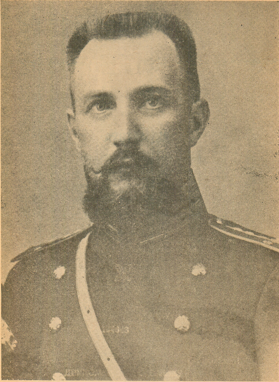
Ген. В. СІКЕВИЧ