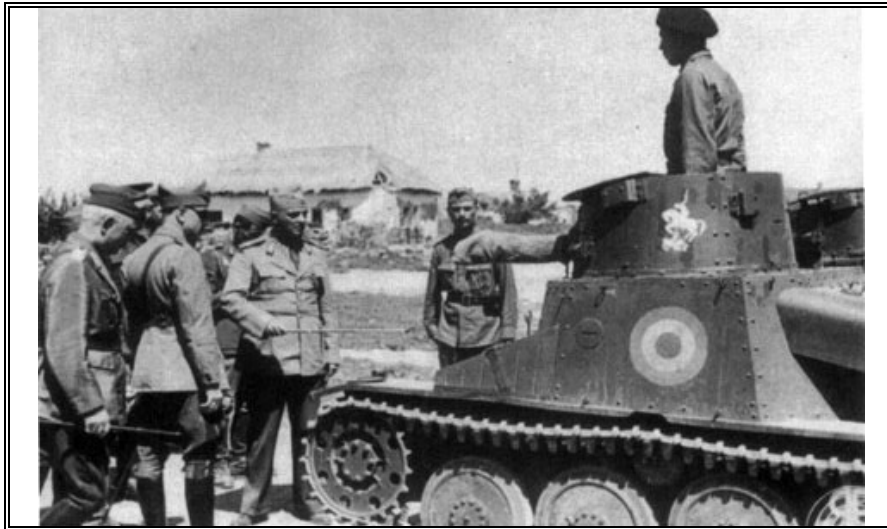
Фотография, которая хронологически «запаздывает», но дает весьма интересную пищу для размышлений – Крым, 08.08.1942 – министр обороны Румынии генерал Константин Пантаци инспектирует 5-й механизированный разведэскадрон 8-й кавдивизии, который, по некоторым, и видимо, ошибочным данным, в 1941 году входил в состав 7-й кавбригады...

каком-то таинственном румынском моторизованном полке и 8-й кавалерийской дивизии. Чрезвычайно характерная иллюстрация того, как военная история, подминаемая политпропагандой, быстро теряет не только свое «лицо», но и истинное предназначение. Неудивительно, что и оценка бронетанкового парка, находившегося в распоряжении командующего 11-й армией, до сих же пор осуществляется исключительно по фон Манштайну и не менее противоречивым и конъюнктурным работам советского и постсоветского периода.