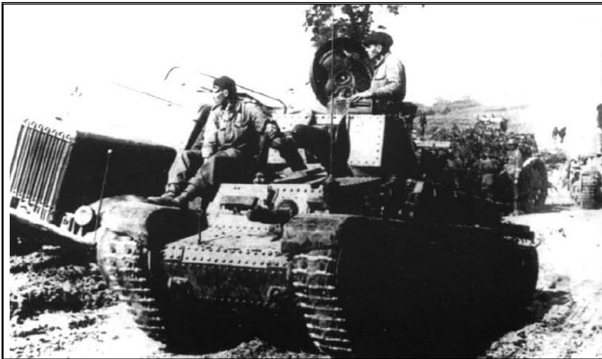
Бессарабия, июль 1941 года – легкий танк R-2 – основа румынских панцерваффе

Как известно, 11-я немецкая армия вместе с 3-й и 4-й румынскими армиями начали активные боевые действия позже, чем развернулись первые пограничные сражения. Это произошло 1 июля 1941 года на моголево-подольском направлении. В ночь со 2 на 3 июля 1941 года части 1-й танковой дивизии форсировали реку Прут. Хотя и вынужденные затем отступить, советские войска организовали на отдельных участках ожесточенное сопротивление, которое ощутили на себе и румынские танки R-2 из состава I батальона 1-го танкового полка (который в это время «вернулся в дивизию»), впервые задействованные в бою 4 июля 1941 года, когда выручили немецкий 203-й пехотный полк (76-я ПД) в районе Братусени, который оказался в критической ситуации ввиду советских танковых атак.