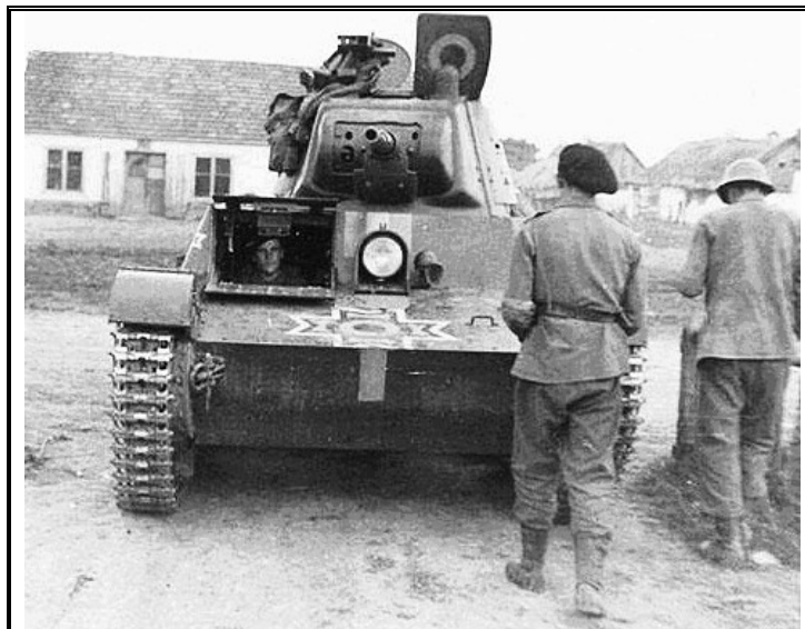
Редкий снимок, прекрасно иллюстрирующий истинное положение дел с использованием румынскими частями советской трофейной бронетехники. Обратите внимание на маркировку танка Т-26

Здесь же сделаем акцент и на том обстоятельстве, что далеко не всегда командиры подразделений спешили докладывать о своих призах, одновременно с этим решая проблемы восполнения собственных потерь. Эксплуатация техники в таких случаях не могла быть продолжительной, но она, бесспорно, имела место, что иногда играло ключевую роль в последующих боях этих частей.