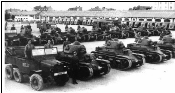
Бухарест, 1940 год. Танки Renault R-35 из состава 2-го танкового полка

С каждым новым месяцем нарастания напряженности на новых границах Германии, Румынии и СССР, для военно-политического руководство страны-сателлита становилась все более очевидной необходимость формирования полноценного танкового соединения на основе уже созданных 1-го и 2-го ТП, что однако, было нереальным, принимая во внимание коренные различия как в тактико-технических характеристиках двух типов танков, так и в концепциях их использования, которые закладывались в основу создания новых машин еще на этапе проектирования на заводах Франции и Чехии.