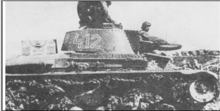
Румынский R-2 с тактическим номером «412» из 1-й ТД. СССР, 1941 год. Внизу – танки R-2 из 1-й ТД в районе Одессы