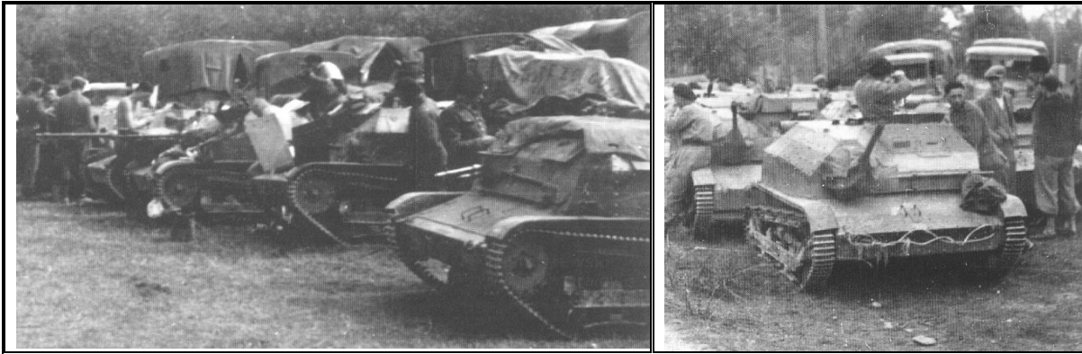
Слева – польские танкетки ТК-3, TKS и TKF из состава 10-й мехкавбригады перед эвакуацией в Венгрию. Справа – TKS с 20-мм орудиями из того же соединения, район венгерской границы, 19 сентября 1939 года

Любопытно, что сами поляки еще до начала известных событий обращались к румынам с предложением приобрести подобную технику, однако попытка продать ТК в 1934 – 1937 годах закончилась неудачей.