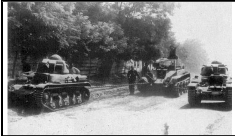
Бессарабия, июль 1941 года. На редком фото запечатлены два румынских R-35, а также трофейный советский БТ-2, взятый на буксир. Интересно, а сколько советских трофейных танков было использовано румынами в боях за Крым?..

ПТО, однако, не всегда, поскольку возможности машин существенно ограничивались короткоствольными 37-мм орудиями, не позволявшими стать эффективным средством поддержки собственной пехоты.