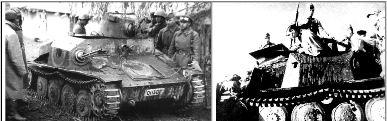
Трофейные танкетки R-1, захваченные бойцами Отдельной Приморской армии, сентябрь 1941 года. Как ни странно, самым любопытным здесь является не факт захвата или устройство машины, а принадлежность советских солдат, которые ее осматривают. Если танкетки были взяты во время боев за Одессу в СЕНТЯБРЕ 1941 года, то это означает, что машины принадлежат одному из механизированных разведэскадронов 1-й, 7-й или 9-й кабригад 4-й румынской армии, которые использовали R-1 в боях за Одессу. Захватили R-1 бойцы, скорее всего, 22.09.1941, когда в рамках советского контрнаступления под Одессой была проведена блестящая десантная операция, и в качестве трофеев всего было взято 6 танков...