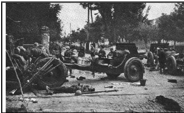
Центр Кишинева, 16.07.1941. Орудия советской артбатареи, захваченной 3-й танковой ротой I танкового батальона 1-го ТП дивизии «Великая Румыния»