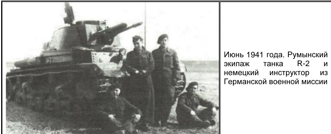
Июнь 1941 года. Румынский экипаж танка R-2 и немецкий инструктор из Германской военной миссии

2-й ТП вышел из состава дивизии «Ромэния Марэ» и стал полноценной отдельной боевой частью, подчиненной 4-й румынской армии.