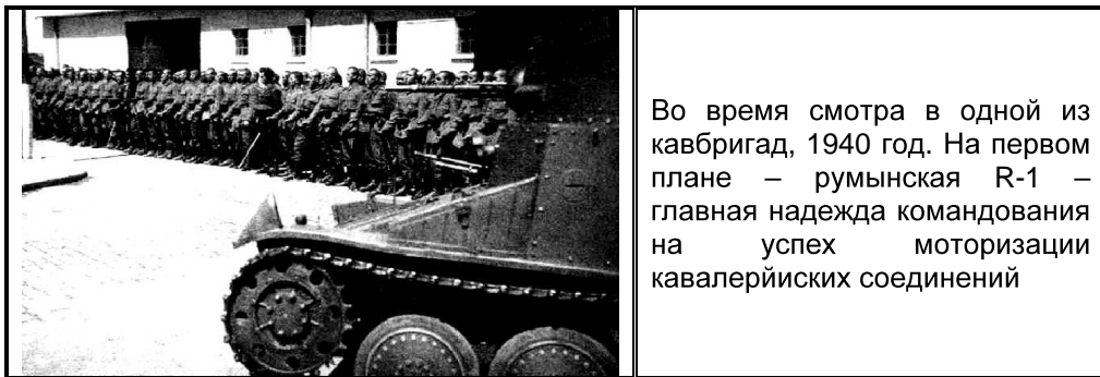
Во время смотра в одной из кавбригад, 1940 год. На первом плане – румынская R-1 – главная надежда командования на успех моторизации кавалерийских соединений

Одним из вариантов использования танкеток, видимо, был и проект формирования в составе 1-й кавалерийской дивизии полноценного танкового батальона трехротного состава, в связи с чем, на какое-то время все 35 машин попытались собрать в этой части.