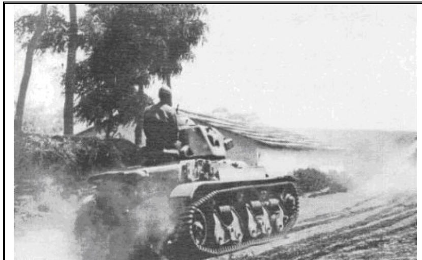
Еще один стоп-кадр кинохроники, запечатлевший румынский танк R-35 в движении. 1941 год.