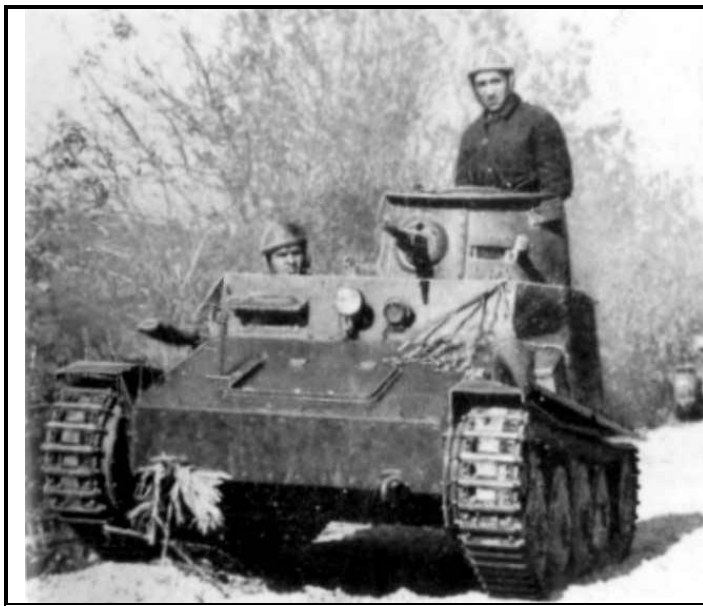
Танкетка R-1, входила в состав мехразведэскадронов румынских кавбригад. На этом фото запечатлены две такие танкетки, видимо, во время боевых действий на юге Украины (1941) или Крыму (1941/1942). На танкистах – французские шлемы образца 1923 года, окрашенные в темно-синие тона.

Подчеркнем, что на сегодняшний день вопрос об участии мотогруппы Корна в зимнем штурме Севастополя уже не является проблемным. Подвижная часть не только активно работала на этом участке фронта, но и сыграла ключевую роль в деле поддержки пехотных подразделений, в том числе, видимо, и за счет своей трофейной техники. В этом свете, вопрос о возможном пополнении импровизированной группы румынскими R-35, а быть может и танками R-2, требует дополнительного изучения.