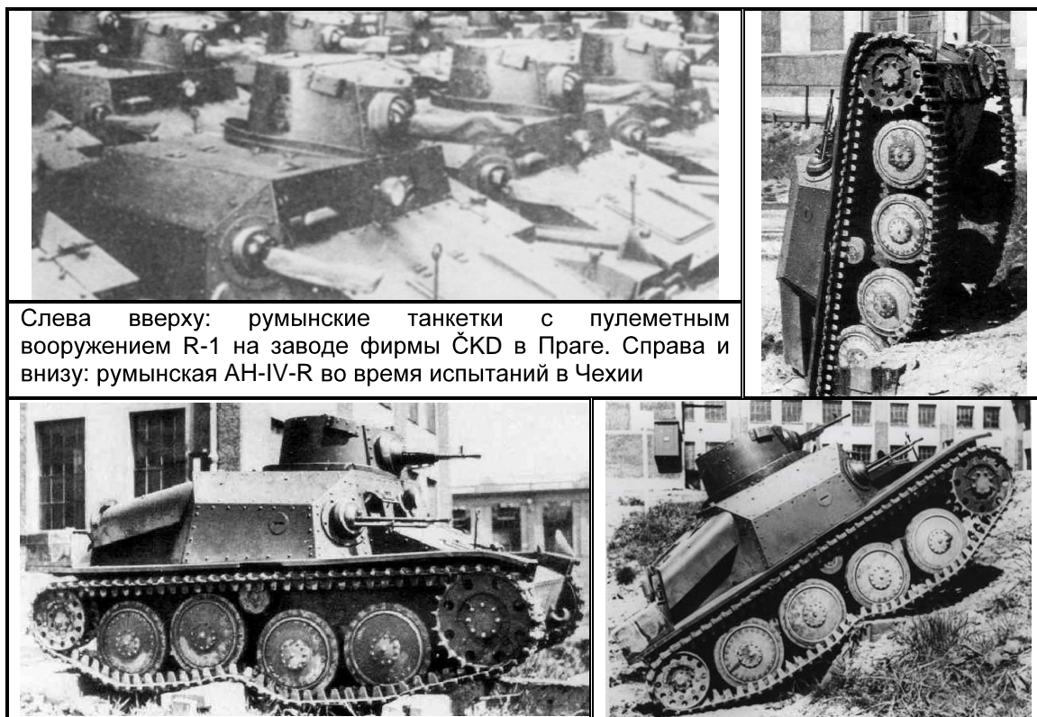
Слева сверху: румынские танкетки с пулеметным вооружением R-1 на заводе фирмы ŠKD в Праге. Справа и внизу: румынская AN-IV-R во время испытаний в Чехии

был подписан специальный протокол между поставщиками и премьер-министром Румынии. В последующие несколько месяцев, фирма «Шкода» сделала все, чтобы получить полное преимущество в борьбе с конкурентом, поставив также вопрос о закупке легких танков LT vz.35, вариант которого в исполнении «ЧКД» уступал машинам, произведенным «Шкодой». Румыны, заинтересованные, прежде всего, в этих легких танках, также приняли это обстоятельство во внимание.