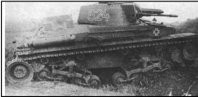
Один из подбитых R-2 с тактическим номером «624». Район станции Карпово, 18.08.1941 Танк №4 из второго взвода 6-й роты – II батальон 1-го танкового полка дивизии «Великая Румыния»

отметить и то обстоятельство, что лишь 25 танков были утрачены безвозвратно. Остальные машины в течение нескольких месяцев были полностью восстановлены на заводе фирмы-производителя в Чехии (г.Пльзень) и заводом UMP в румынском Плоешти.