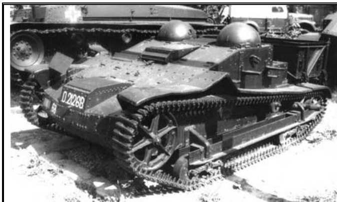
Румынский тягач Malaxa

Параллельно с переговорами декабря 1937 года представителями Румынии были проведены переговоры и о возможности приобретения лицензии на выпуск 300 знаменитых французских «шениллетов». Начиная со второй половины 1939 года и по март 1941 года на румынском заводе «Malaxa» в Бухаресте было выпущено 126 танкеток-тягачей, после чего производство прекратилось, поскольку технологически во многом зависело от французских поставок. Следует заметить, что танкетки выпускались изначально как тягачи, в роли которых и использовались на первом этапе войны в артиллерийских и кавалерийских частях, в частности, для буксировки 47-мм орудий, а также перевозки топлива и амуниции в составе моторизованных кавалерийских полков.