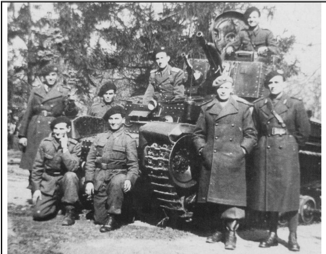
Январь 1941 года. На снимке – представители 1-го ТП возле танка R-1...

Хотя 1-й танковый полк был сформирован еще 1 августа 1919 года, с появлением в марте 1940 года в румынских войсках чешских танков LT vz.35 произошли коренные изменения как в структуре части, так и в планировании относительно его дальнейшего использования в реальных боевых условиях. В итоге, на базе 126 танков R-2 к 1941 году был фактически заново создан 1-й танковый полк двухбатальонного состава. В каждом батальоне полка имелось три роты и рота обслуживания. В состав роты входило 5 взводов по три танка в каждом. Таким образом, рота состояла из 16 машин (включая танк комроты), а батальон, в свою очередь, насчитывал 49 единиц техники, включая машину командира батальона. Роты обслуживания вместе с резервными танками имели по 13 машин, еще два танка приходилось на взвод управления полка.