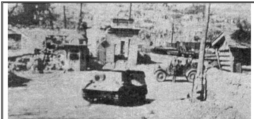
Трофейный советский тягач «Комсомолец» на румынской службе. Крым, 1942 год

Сведений о попытках использования этих машин в качестве средства поддержки пехоты не имеется. Более того, для этих целей скорее применялись импровизации с трофейной техникой, прежде всего, советскими тягачами «Комсомолец», которые в этом качестве пользовались популярностью у обеих сторон, особенно во время боевых действий на Крымском полуострове, где у немцев и румын на счету была каждая механизированная боевая единица.