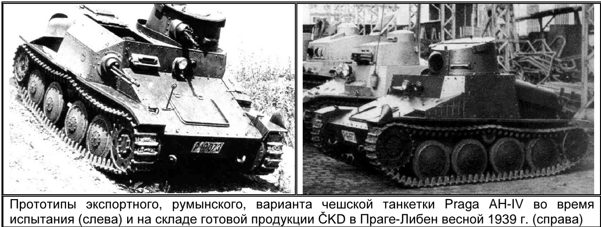
Прототипы экспортного, румынского, варианта чешской танкетки Praga AH-IV во время испытания (слева) и на складе готовой продукции ŠKD в Праге-Либен весной 1939 г. (справа)

Вечные споры с ближайшими соседями, которые, кстати, и стали основной причиной появления у гитлеровской Германии очередного сателлита, привели к тому, что во второй половине 1930-х годов руководство страны начало искать новых поставщиков. С учетом скромных возможностей военного бюджета и объективно сложившегося размещения производительных сил в Европе, а также принимая во внимание безрезультатные переговоры с британскими и французскими фирмами по поводу заказа легкого танка для кавалерийских соединений, выбор пал на знаменитую фирму «ЧКД», которая уже в то время освоило новый подход в своем развитии и занималось производством самой разнообразной продукции, в буквальном смысле, «от булавки до локомотива».