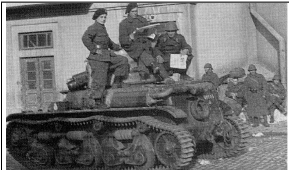
Бухарест, 1941 год. На снимке – один из румынских R-35

Как ни странно, но первое крещение, правда в боях с собственными гражданами, румынские танки получили еще в конце января 1941 года, когда было поднято восстание легионеров из знаменитой «Черной гвардии» (21.01.1941). Беспорядки были ликвидированы при деятельном участии танков Renault R-35, хорошая броня которых и слабые (для настоящих боев) 37-мм орудия очень пригодились новому правительству. Тем не менее, легионеры не были просто рядовыми гражданами, что и доказали на деле: один танк R-35 был полностью сожжен во время боев на улицах Бухареста.