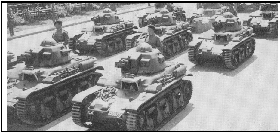
Румынские Renault R-35 во время парада в Бухаресте

В декабре 1937 года были начаты обстоятельные переговоры и с французскими партнерами, которые смогли предложить румынской стороне что-то более привлекательное, чем морально устаревшие машины времен Первой Мировой. На этот раз румынам уже почти удалось реализовать давнюю мечту о полноценном производстве танковой техники на лицензионной основе внутри страны, но на деле, производитель, планирующий в будущем торговлю с Югославией, Польшей и Турцией, не пошел на сделку в полном объеме, согласившись лишь на поставку танков на общих основаниях в соответствии с определенным графиком: 50 – в сентябре 1939 года, 25 – I.1940, 25 – V.1940, 50 – IX.1940, 50 – IX.1941. Реализация военной программы самой Франции, а затем и ее поражение в войне привели к тому, что румыны фактически получили лишь 41 танк. После захвата немцами более 4000 французских танков в качестве трофеев, вопрос был закрыт сам собой, что еще раз хорошо иллюстрирует жесткую политику Гитлера по отношению к собственным «союзникам» поневоле.