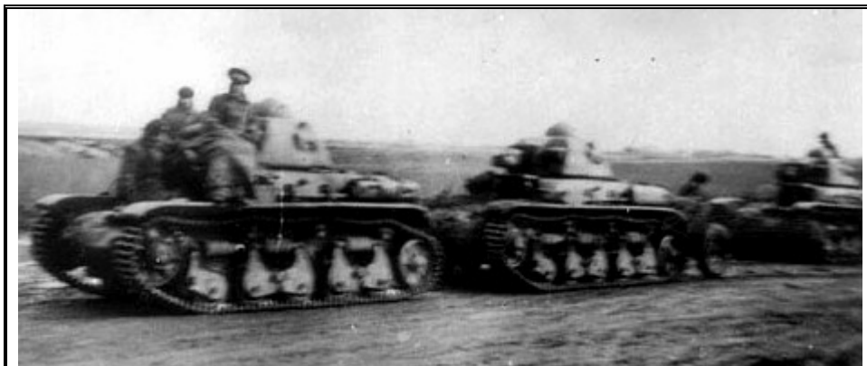
Танки R-35 из состава 2-го ОТП возвращаются под дождем из Одессы. Октябрь 1941 года

Итог был закономерным: уже по состоянию на 20.08.1941 в батальоне было только 19 боеспособных машин, а к середине октября 1941 года, когда бои за Одессу прекратились, 16 танков R-35 были утрачены безвозвратно (в том числе 8 сгоревших машин), еще 35 машин нуждалось в серьезном ремонте, который затянулся на долгие месяцы.