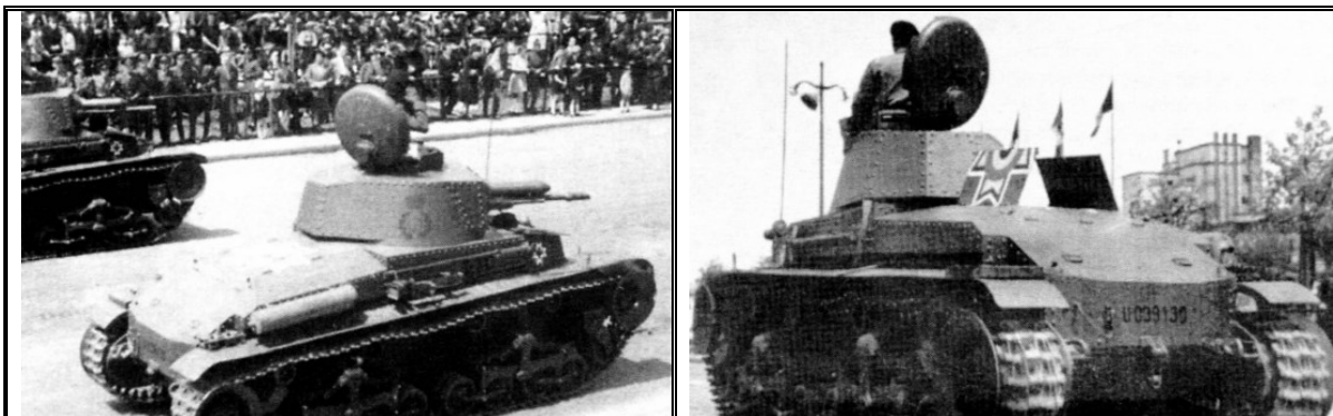
Октябрь 1941 года, Бухарест. Танки R-2 на параде

Обратим внимание, что производитель, в свою очередь, заинтересовавшись возможностью получить максимальный эффект от сотрудничества, представил румынской стороне в конце 1939 года улучшенную версию танка Š-liaR с одновременным предложением приобрести соответствующую лицензию на изготовление техники в самой Румынии, однако, не без интриг немецкой стороны, румынское руководство отказалось от этой перспективы, тем самым навсегда похоронив последнюю реальную возможность сформировать собственные полноценные панцерваффе уже в 1941 году.