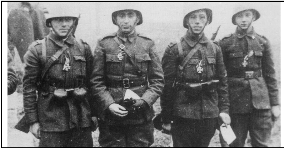
Кавалеры Железного Креста из состава 8-й румынской кавалерийской бригады сразу после награждения. Крым, 7 января 1942 года

После этой операции, механизированный отряд был направлен в район Геническа для обеспечения охраны морского побережья.