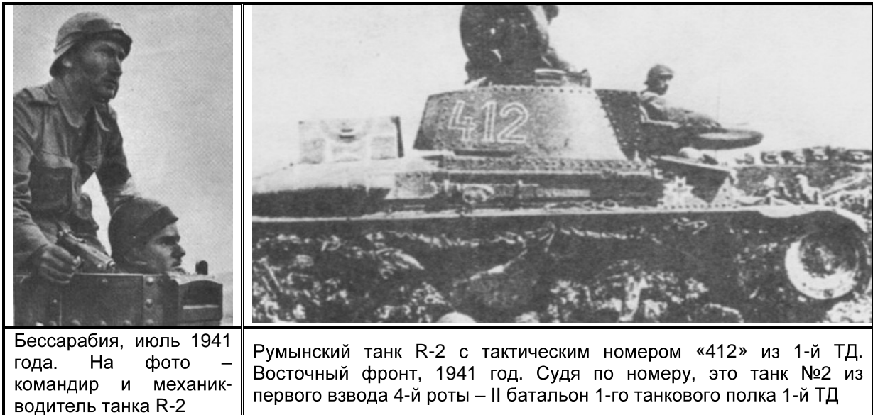
Бессарабия, июль 1941 года. На фото – командир и механик-водитель танка R-2

«необстрелянной» дивизии, привели к тому, что соединение было временно выведено в резерв 4-й румынской армии, после чего получило возможность отремонтировать поврежденные машины.