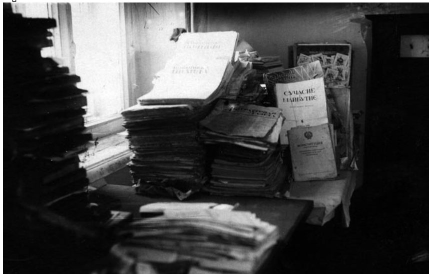
Підпільні видання ОУН, конфісковані НКВД (Хмельниччина, початок 1950-х рр.)

літератури слід надіслати. Також вони були зобов'язані нагляда-ти за транспортуванням літератури, забезпечувати зв'язкові лінії відповідними криївками для її зберігання, карати за невинуватну затримку вантажу. Постійної прив'язки до терену чи певних організаційних осередків не було — літературу скеровували туди, де її найбільше бракувало. Щоб запобігти втратам під час транспортування, керівники осередків пропаганди у звітах мали зазначати: коли, скільки і яку літературу одержано; хто і як перевіряв, чи дійшла вона до найнижчих організаційних осередків; скільки розкинено літератури в обласних центрах, по районах, селах 51 . Володіючи такою інформацією, керівники пропаганди могли оперативно реагувати на брак пропагандивних видань у тому чи тому районі. Поширенням літератури займалась не лише мережа ОУН, а й бійці УПА, з приводу цього вони були спеціально інструктовані 52 . Деякі акції бойових відділів мали на меті винятково поширення агітаційної літератури.