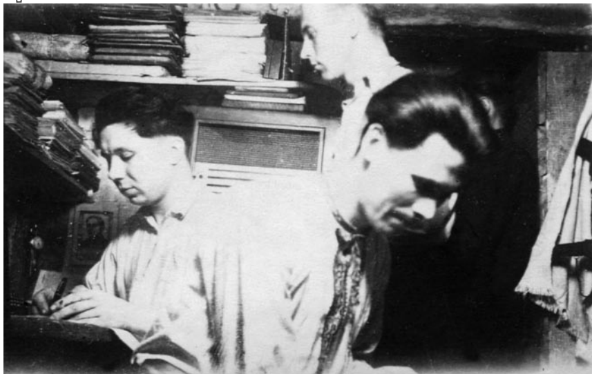
Підпільники за роботою над пропагандивними матеріалами в підземному бункері

ідейно-політичні аспекти програми, давали настанови щодо висвітлення подій та ідеологічних явищ, робили зауваження з приводу невідповідного використання деяких політичних термінів. Зокрема, в інструкції від 28 січня 1946 р. 'Петро Полтава' наказував публіцистам звернути увагу на реакційну сутність Організації Об'єднаних Націй, яка представляла інтереси імперських держав, не рекламувати Нюрнберзький процес як «тріумф міжнародної справедливості» (бо хто і кого судить?), бути обережними в оцінці антібільшовицьких рухів у країнах, окупованих СРСР, зокрема не називати польську АК силою політично аналогічною УПА («в нас є спільний ворог і більше, властиво, нічого») 28 . Одночасно керівник ГОСП застерігав від необачних і провокаційних висловлювань на адресу російського та інших народів, а також радив не перебільшувати власних досягнень, а саме: не писати про Фронт поневолених народів як про dokonаний факт, оскільки на даному