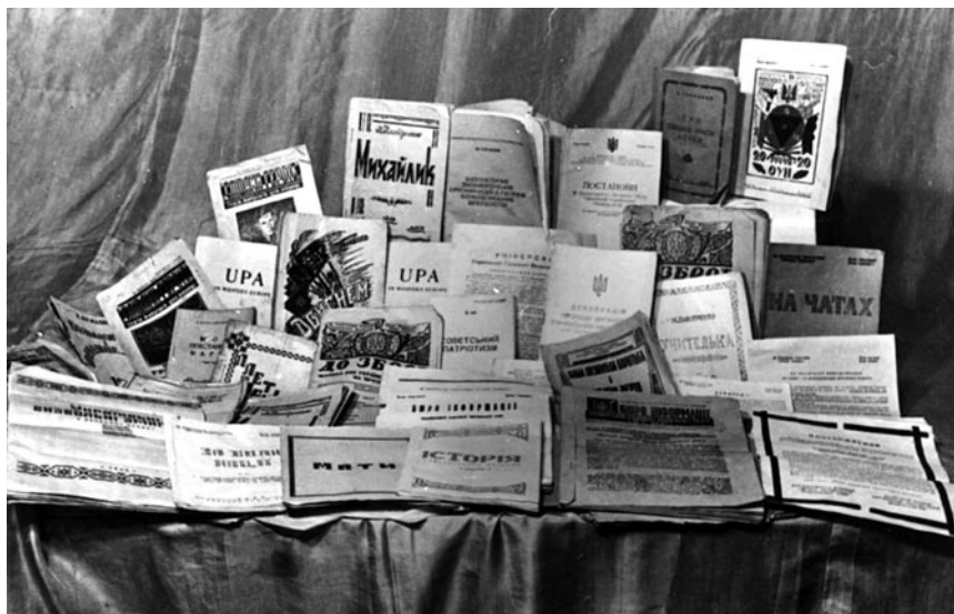
Підпільна література, конфіскована НКВД в будинку в с. Білогорця 5 березня 1950 р.

У пропагандистських інструкціях є численні поради кольпортерам стосовно методів поширення літератури, а також засад конспірації: літературу не можна було тримати в одному місці, а слід було розосереджувати по різних пунктах; вона не повинна була залежуватися, а мала постійно перебувати в русі; підпільники мали виявляти кмітливість і щоразу застосовувати нові методи кольпортажу (вкидати листівки у відчинені вікна і двері, розклеювати на стовпах і мурах, вкладати між сторінок радянських видань, запихати у кишені червоноармійців тощо) 53 . В іншій інструкції наказувалося пересилати літературу на адреси різних радянських установ, висилати на фронт, користуючись польовою поштою, підкидати у військові ешелони 54 . Одночасно інструкції застерігали від поширення друкованих видань у місцях, де це могло б викликати масову відповідальність населення.