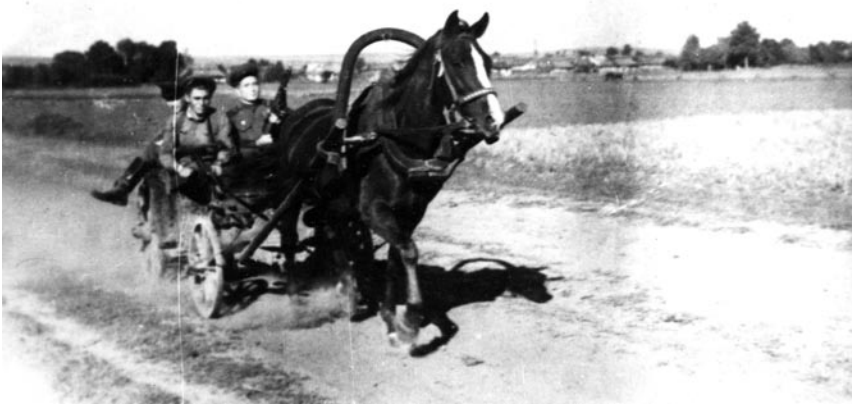
Вїзд бійців внутрішніх військ МГБ в с. Жовтанці Львівської області на появу підпільників. 1950 р.

препарату, щоб не втрапити в перестрілку між отруєними підпільниками і чекістами.