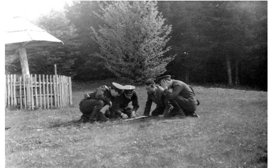
Нарада співробітників МГБ на місцевості. Івано-Франківська область, початок 1950-х рр.

вання апаратів для подання сигналів про появу підпільників суттєво допомогло військовим підрозділам розшукувати їх. У тих управліннях та відділах МГБ, де правильно застосовували цю техніку, були досягнуті значні успіхи в боротьбі з ОУН і УПА 28 .