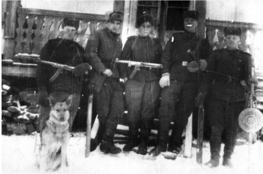
Чекістсько-військова група Славського райвідділу УМГБ у Дрогобицькій області зі службово-розишуковим собакою перед операцією проти підпільників ОУН(б). 1951 р.

співробітники МГБ УРСР готували приманки — наприклад, цінний вантаж начебто без охорони, або імітували нечисленні військові групи.