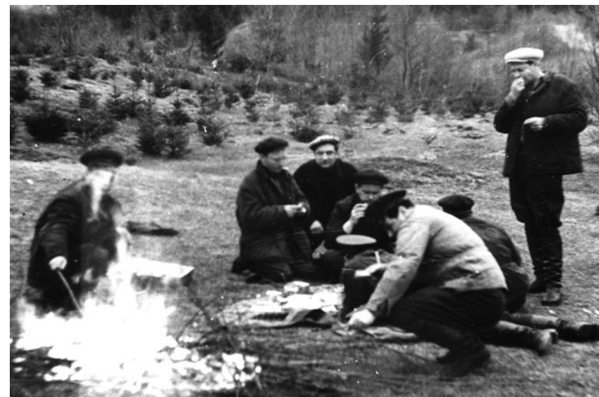
Чекісти на привалі під час операції з розшуку підпільників

У багатьох відділах 2-Н обласних управлінь, райвідділах та міськвідділах МГБ начальники мало популяризували радіосигналізаційну техніку серед оперативного складу. Багато оперативних