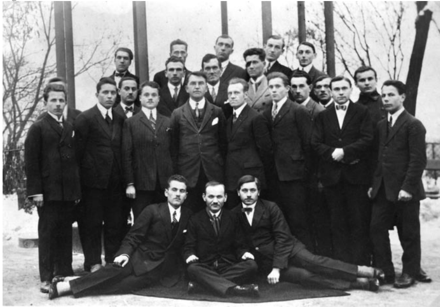
Члени УВО Долинського повіту. 1920-ті рр.