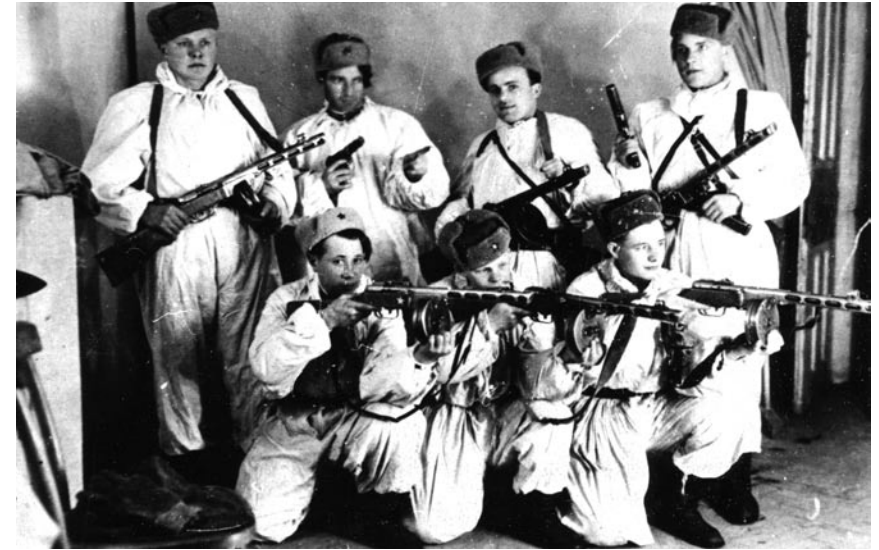
Чекістсько-військова група Дрогобицького райвідділу МГБ перед операцією з розшуку Дублянського районного проводу ОУН(б). 1949 р.

Для захоплення «Яроша» та «Василя» господареві будинку, де вони перебували, конспіративно вручили «Нептун-47» із завданням застосувати його — розчинити в молоці й віддати підпільникам, як тільки стемніє. Аби уникнути розправи підпільників над господарем у разі виявлення спеціального засобу, неподалік від будинку засіла чекістсько-військова група, яка мала роззброїти й