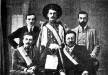
Січова делегація на злеті хорватських “Соколів” у Загребі. 1911 р.

літичних та культурних діячів. Посвячення прапорів товариств “Січ” закордоном відбувалося також. Так 19 листопада 1910 р. у Нью-Йорку члени українського товариства “Запорозька Січ” (товариство налічувало 85 членів) в урочистій обстановці посвятили свій прапор. Посвятив прапор о. Н. Підгорецький у церкві святого Юрія 22 .