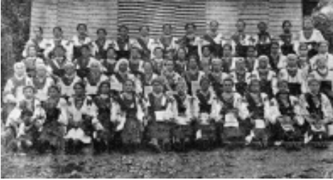
Січовички з с. Ілинець Снятинського повіту

Носіння відзнак та використання прапора членами організації “Січ”, згідно з розпорядженням Міністерства внутрішніх справ від 10 вересня 1895