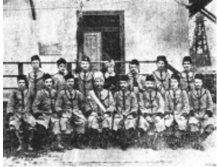
Повітова “Січ” у Бережанах

никами-аматорами і були не завжди високої мистецької вартості. Окремі заможні товариства “Січ” винаймали для цієї справи професійних художників. Одним серед них був Ярослав Пестрак, видатний український художник родом з покутського містечка Гвіздця, автор прекрасних картин з життя селян на Покутті 14 . Починаючи з 1910 р. повітові “Січі” використовують синьо-жовті прапори з малиновими стрічками. Взагалі поєднання синього, жовтого та малинового кольорів було надзвичайно характерним для початку ХХ ст. Це простежується на прикладі символіки таких пожежно-спортивних та спортивних товариств як “Сокіл-Батько”, спортивне товариство “Україна” та ін.