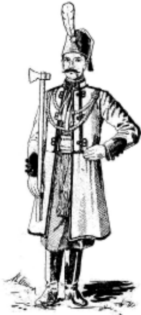
Січовик в однострої

На Шосте січове свято, яке відбулося в липні 1912 р. у м. Снятині, К. Трильовський привіз прапор з прозорою тканини, який його коштом виготовила одна віденська фабрика. Це було прямокутне полотнище червоного кольору з 6-сантиметровою лиштвою, складеною з синіх і жовтих трикутників 19 . Крізь прозору тканину посередині полотнища з обох боків