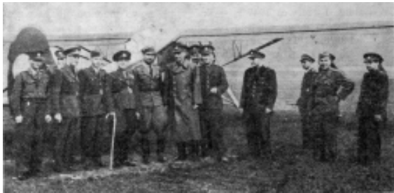
Зустріч чехословацьких та польських старшин. 1947 р.

За твердженням польських істориків Антоні Щесняка і Веслава Шоти, початки антиповстанської співпраці між СРСР та Польщею припадають на другу половину 1944 та першу половину 1945 років, коли польські війська ще не могли виставити біль-