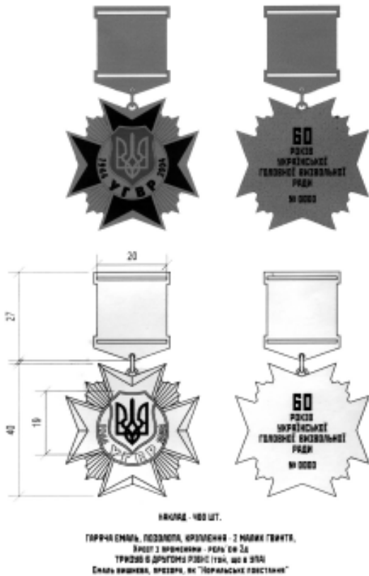
Аверс та реверс ювілейної відзнаки "60 років УГВР"

Наклад відзнаки "60 років УГВР" виявився досить невеликим, як на звичайну ювілейну відзнаку. Ветеранам національно-визвольних змагань та активним учасникам державотворення серед ветеранських організацій в Україні і за кордоном було надано всього 400 екземплярів відзнаки. Така невелика кількість відзнаки "60 років УГВР" тільки підкреслила її особливий статус серед інших українських ювілейних відзнак.