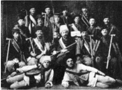
Пожежно-гімнастичний курс у Коломиї. Жовтень 1908 р.

Серед січових відзнак слід виокремити ювілейні відзнаки. У 1914 р. за задумом Івана Боберського інженер Роман Грицай створив відзнаку для Шевченківського здвигу, який відбувся 28 червня 1914 р. у місті Львові на честь 100-річчя від дня народження Т. Г. Шевченка 35 . Відзнака мала форму трикутника, який по трьох боках мав півкруги. В цих півкругах поміщені