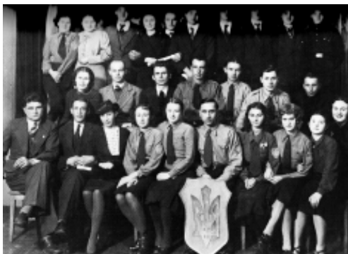
СУМ у Харбіні