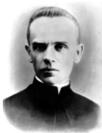
о. Микола Хмільовський

Народився Микола Хмільовський у селянській сім'ї 18 травня 1880 року в селі Покропивна, що на Тернопільщині. Незважаючи на матеріальну скруту, батьки постановили дати добру освіту своєму сину. Навчатись йому було легко, і 1901 року він стає студентом теологічного факультету Львівського університету. Закінчивши його, Микола Хмільовський одружується з Софією Підсонською, а згодом виїжджає до Відня продовжувати теологічні студії. У 1907 році він став священником 1 . Цього ж року подружжя Хмільовських перебирається у Золочів, де о. Микола стає членом “Просвіти”, Українського Педагогічного Товариства, а також активним учасником громадсько-політичного життя Золочівщини. Тут він обіймає посаду катехита місцевих шкіл і державної гімназії. В період з 1913 по 1917 роки о. Хмільовський очолював Золочівську школу ім. Маркіяна Шашкевича 2 . Подальше керування цією школою перервала Перша світова війна. Його вихованці зголошуються добровольцями до Легіону УСС, який розглядали, як основа майбутньої української армії в боротьбі за незалежність України. Отець Хмільовський теж прагне потрапити до цієї формації. У листі до В. Старосольського, який займався формуванням Легіону УСС, він пише: “[...] голоситься ще один воїн, а то