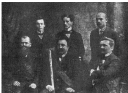
Генеральна Старшина "Українського Січового Союзу" у Львові

та інших українських землях. Сучасні дослідження І. Андрухів 1 , А. Доценка 2 , М. та Н. Лазарович 3 , Є. Приступи та О. Винничука 4 , Б. Трофим'яка 5 та інших висвітлюють більше історію українських молодіжних товариств та організацій, а символіка в їхніх працях лише