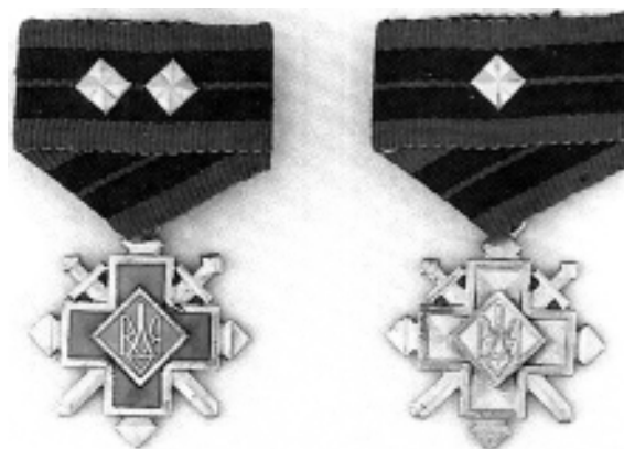
Фото 5. Хрести бойової заслуги УПА. Золотий хрест бойової заслуги 1-го класу помилково зображений з двома зірками-ромбами (перший зліва)

Далі ця помилка була повторена в першому в Україні ґрунтовному три-томному фалеристичному дослідженні «Нагороди України» (Київ, 1996). Тут вказано, що «знаки вищого класу того самого ступеня різнилися як кольоровим вирішенням, так і кількістю чотирикутних зірок на стрічці. Наприклад, знак Золотого хреста бойової заслуги 1-го класу від знаку Хреста 2-го класу відрізнявся тим, що поле хреста і ромба залите відповідно червоною та синьою емаллю, а крім того, наявністю двох золотих зірок на колодці. На стрічці Срібного хреста бойової заслуги 1-го класу розташовувалось дві срібні зірочки, а на стрічці 2-го класу – одна. Золотий хрест заслуги 1-го класу мав у центрі хреста золотий тризуб на синьому тлі та подвійний