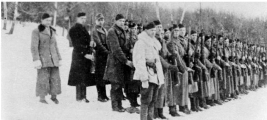
Фото 1. Невідома сотня Третьої ВО «Лисоня» готова до звіту (після команди «Почесть крісом дай!»). Зима 1943–1944 рр.