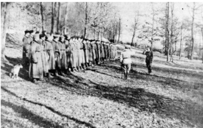
Фото 2. Командир відділу УПА, мабуть сотенний (у білому кошушці), звітує шефові штабу Третьої ВО «Лисоня» перед виструнченою в трилаві сотнею. Поч. весни 1944р. – в гущавині, між деревами, ще біліє сніг