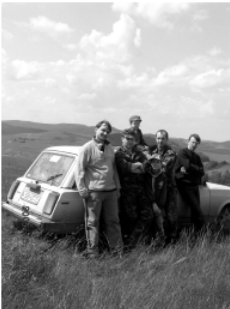
Під час польової експедиції в с. Кальна (Долинський р-н Івано-Франківської обл.)

мендованих джерел та літератури, планується підготувати курс лекцій.