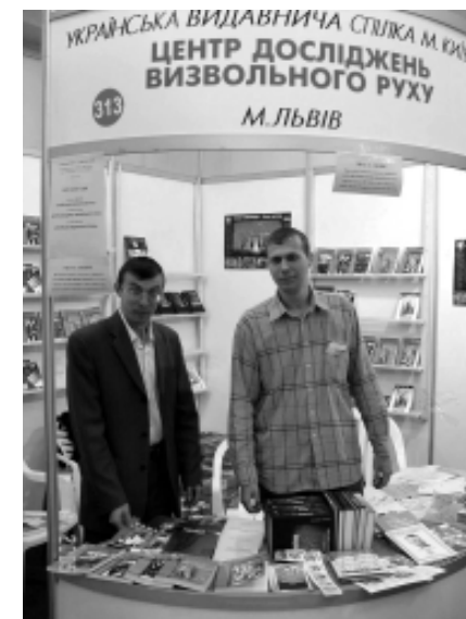
Стенд ЦДВР та Української видавничої спілки на Форумі видавців у Львові

Традиційним стало проведення щорічної наукової конференції ЦДВР. 2005р. це була науково-практична конференція «Український визвольний рух 1920-х – 1950-х років: проблеми теорії та методології досліджень», що відбулася 19 листопада в конференц-залі Наукового товариства ім. Тараса Шевченка. Науковці розглянули питання, пов'язані з особливостями вивчення політичної думки та ідеології, усної історії, гендерних відносин, джерел, біографій, періодизації, статистики, пам'яток та символіки українського визвольного руху. Під час жвавого обговорення цих питань присутні зробили низку важливих