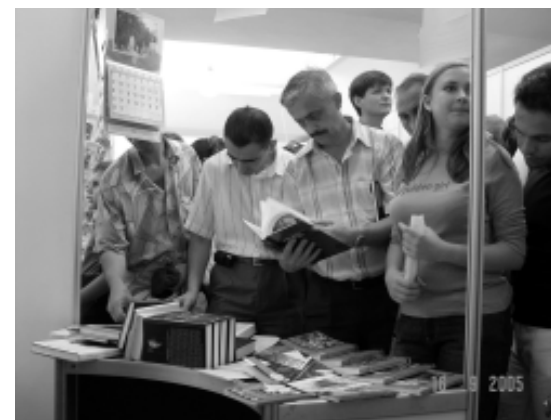
Відвідувачі стенду на Форумі видавців у Львові

концептуальних висновків, необхідних, щоб удосконалити методологію досліджень визвольного руху. Найважливіший із них полягає в тому, що подібні конференції потрібно організувати й надалі, адже, як стало зрозуміло, дослідники руху слабо обізнані з основними принципами методології та найновішими здобутками теорії історичної науки.