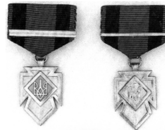
Фото 6. Хрести заслуги УПА. Золотий хрест заслуг 1-го класу помилково зображений з двома пасками (перший зліва)