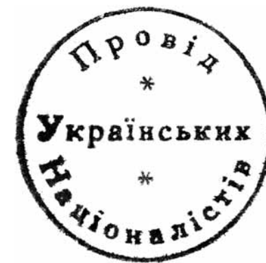
Печатка Проводу Українських Націоналістів. 1929 р.

У липні 1927 р. Д. Андрієвський підготував перелік тем доповідей і доповідачів на майбутній конференції та переслав його Є. Коновальцю, котрий схвалив пропозиції. Постало питання критеріїв добору делегатів. Є. Коновалець писав Д. Андрієвському: «[...] треба би нам порозумітися, кого саме будемо притягати до участі в конгресі, а іменню, чи будемо запрошувати на нього індивідуально поодиноких людей чи може представників певних організацій» 9 . Д. Андрієвський як голова підготовчого комітету підкреслив: «[...] треба змагати, щоби то був справжній Конгрес Українських Націоналістів» 10 . Водночас він вважав, що участь у конгресі мають узяти не лише емігранти, а обов'язково й делегати крайових організацій з Галичини, Волині, Прикарпаття, Буковини та Наддніпрянщини, хотів він також бачити представників зі США й Канади. Є. Коновалець особливо наголошував на широкому представництві українських земель, щоб конгрес набув загальноукраїнського, а не емігрантського характеру. Труднощі з делегатами від галицьких націоналістів, на думку Д. Андрієвського, не мали б перешкодити проведенню конгресу; він наполягав на тому, що «навіть коли б з краю ніхто б не приїхав, нам не можна кидати справу. Навпаки, приступити негайно до практичних заходів до організації як Конференції» 11 . Тут