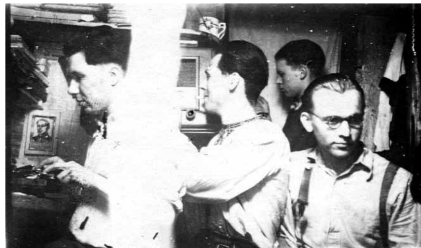
Кременецький надрайоновий провідник «Алас» та інші підпільники в бункері. 1950 р.

були залякані та сумнівались у перемозі ідей ОУН, порівнюючи сили ОУН і радянської влади 39 .