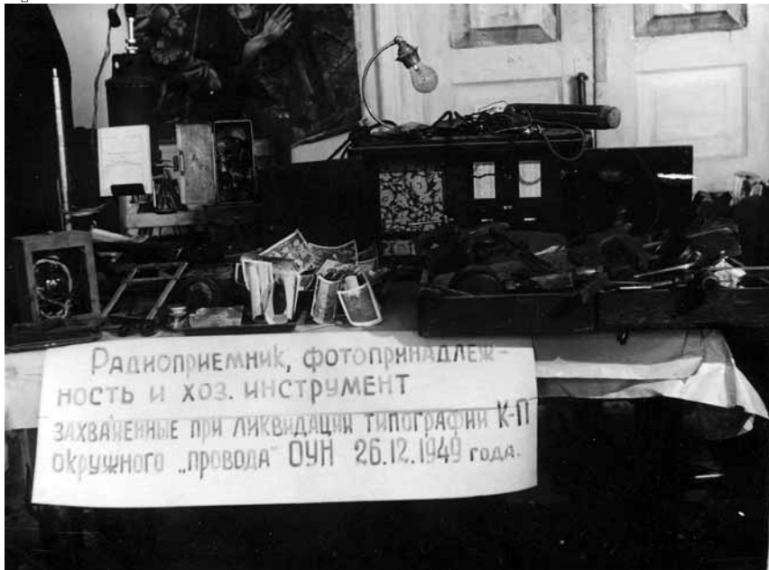
Майно типографії ОУН Кам'янець-Подільського окружного проводу ОУН