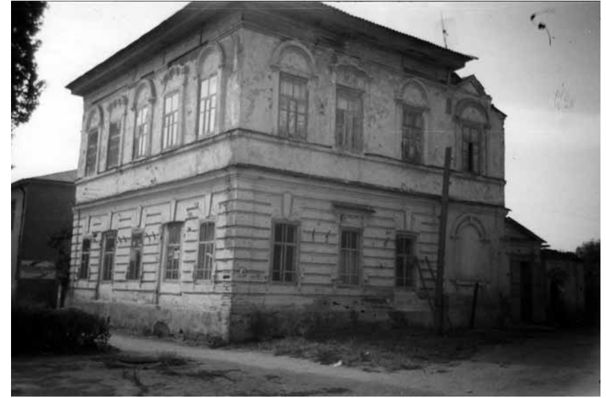
Будинок Челюканова в Дубовці, де мешкали 18 старшин і підстаршин. Серпень 2006 р.

Василя Різника. Величезне враження зробив цей хор на мешканців міста в часі похорону хорунжого УСС Михайла Дорошенка, що мабуть в травні 1917 р. згинув трагічно, під час купелі в річці Волзі. Безсмертне «Святий Боже» і «Со святими» заворожили масу народу, що мовчазно посувалися вулицями за труною. Православні священники, які провадили похорон, постійно просили диригента, щоб хор співав «Святий Боже». Зворушливу промову сказав тоді Андрій Мельник. На пам'ятнику, що його коштами УСС і з допомогою українців на православному цвинтарі в Дубовці побудовано, була вмурована металева таблиця з написом: «Тут спочиває хорунжий Українських Січових Стрільців сл. п. Михайло Дорошенко» 12 .