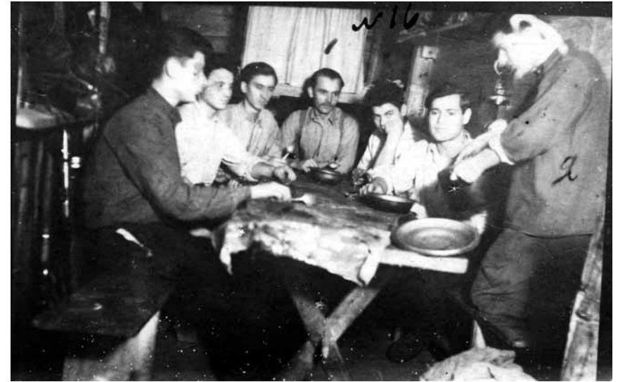
Керівник Кременецького надрайонового проводу ОУН проводить вишкіл з молоддю. 1950 р.

антирадянською 41 . На початку 1990-х рр. усі учасники цієї ланки ОУН були реабілітовані.