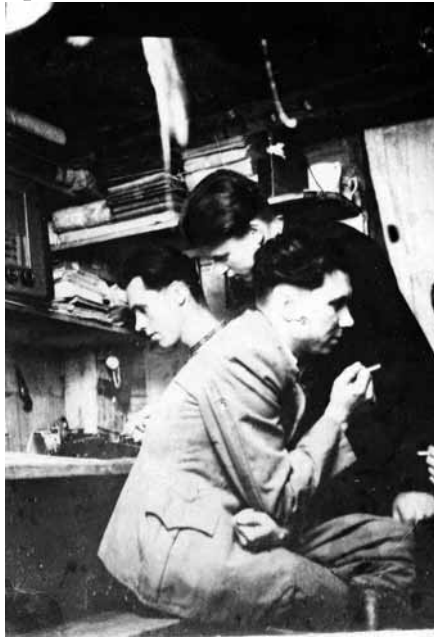
Кременецький надрайоновий провідник «Алас» та інші підпільники в бункері на території Хмельницької області. Фото 1950 р.

кримінального кодексу УРСР до 6 років виправно-трудових таборів. 28 жовтня 1991 р. прокуратура Луганської області реабілітувала Л. Безпалько через відсутність у її діях складу злочину 40 .