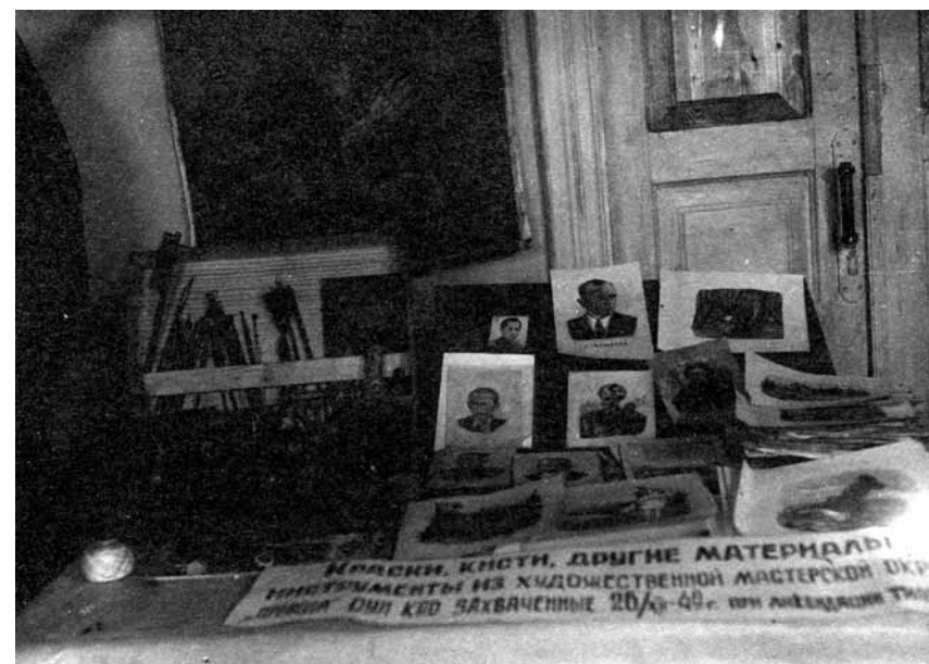
Майно типографії ОУН Кам'янець-Подільського окружного проводу ОУН

їзду в Лисичанськ невідомих осіб із західних областей України, для яких В. Адамович намагався придбати документи 56 .