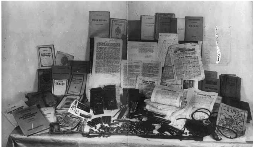
Література, листівки, зброя та інші речі, вилучені в учасників Київської молодіжної ланки ОУН 1948 р.

Підсумовуючи результати дослідження діяльності ОУН(б) в Центральній та Східній Україні, варто зазначити, що найактивнішою вона була за часів німецької окупації в 1941—1943 рр. Саме тоді ОУН(б) вдалося здобути певний авторитет серед молоді. Можливо, це пов'язано з тим, що німці, перебуваючи у стані війни з СРСР, не мали можливості приділити достатньо уваги розгрому підпілля на контрольованих територіях. З іншого боку, частина місцевого українського населення в надії на кращу долю співпрацювала і з німцями, і з ОУН.