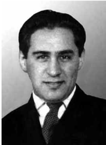
Павло Судоплатов. Берлін, 1936 р.

Подіям 23 травня 1938 р. в Роттердамі присвячено низку наукових та популярних публікацій. Проблема була піднята після розсекречення 1992 р. імені вбивці Євгена Коновальця. Ним виявився голова відділу Головного управління державної безпеки НКВД СРСР та заступник керівника 2-го Головного управління МВД (розвідка за кордоном) генерал-лейтенант Павло Судоплатов (1907—1996). Проте діяльність агента ОГПУ-НКВД* у 1934—1938 рр., як і загалом радянської агентури в структурах ОУН, до сьогодні залишається темою, фактично не дослідженою в українській історичній науці.