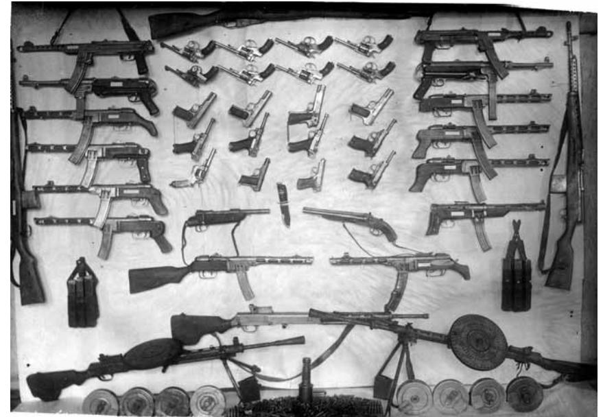
Частина зброї, яку співробітники МГБ вилучили в учасників ОУН Кам'янець-Подільського окружного проводу ОУН у 1950—1952 рр.

Молодіжні структури ОУН(б) діяли у цей період на території різних областей Центральної та Східної України. Статистика свідчить, що їхня кількість була порівняно незначною. Першопричиною цього, на нашу думку, стало те, що вільно висловлювати думки та створювати різні політичні партії в СРСР було заборонено. Водно-