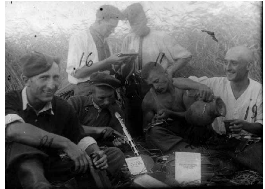
Підпільники з Кам'янець-Подільського окружного проводу ОУН