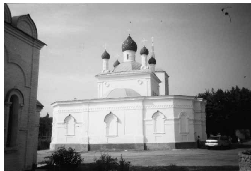
Церква Св. Покрови. Дубовка, серпень 2006 р.

робив усе, щоб старшини не гаяли часу, готувалися до нових битв за волю України. Організовував регулярне навчання з предметів військового мистецтва, а І. Чмола, піонер пластової організації в Галичині, — щоденні спортивні вправи просто неба, навіть у лютий мороз. Крім усього, Є. Коновалець домігся від адміністрації поліпшення побутових умов, зокрема щодо житла, яке тут не було пристосоване до холодної зими. Відтак, на початку березня 1917 р., всіх 32 галицьких старшин перевели у табір Дубовки, де умови перебування, насамперед житло, були набагато кращими 5 .