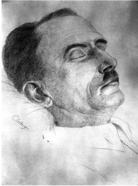
Посмертний портрет Є. Коновальця

Однак мова йде про розмір коробки, який безпосередньо пов'язаний з потужністю вибуху. Згідно зі спогадами П. Судоплатова, бомбу було вмонтовано у коробку цукерок. Механізм спрацьовував при перевертанні коробки з вертикального в горизонтальне положення через 30 хвилин 44 . Але там само П. Судоплатов говорить, що перед врученням коробки він тримав її у внутрішній кишені свого піджака 45 , тобто вона була дуже маленькою. Можливо, йдеться не про цукерки, а про пачку цигарок, оскільки Є. Коновалець був курцем. Але тоді вибух не мав би такої сили, щоб поранити пере-