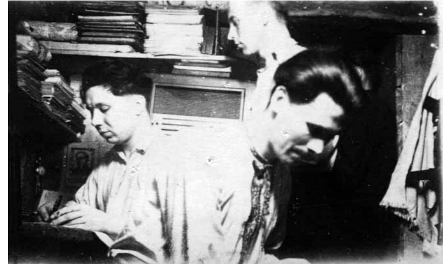
Підпільники ОУН працюють в бункері. Хмельницька область, 1950 р.

на другий план, бо інакше може статися катастрофа 25 . Очевидно, Р. Шухевич мав на увазі те, що якщо ОУН не зуміє завоювати довіру всього українського народу, то не отримає належної підтримки. Відповідно, без неї рано чи пізно радянські каральні органи розгромлять ОУН у західних областях України і покладуть край українському національно-визвольному руху.