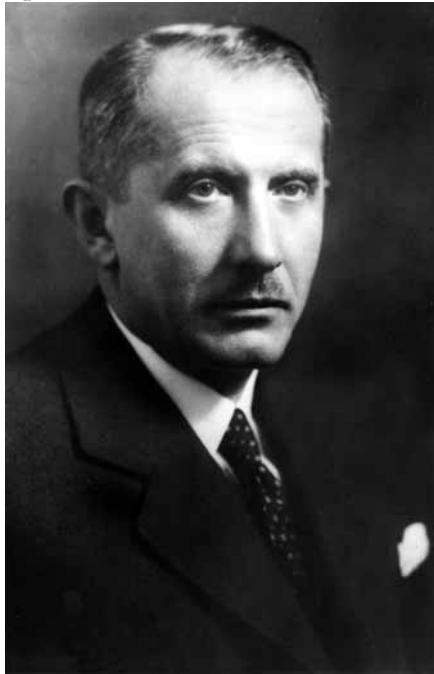
Одна з останніх прижиттєвих світлин Євгена Коновальця. Відень, весна 1938 р.

інформацію». На доказ, що він прибув з СРСР, П. Судоплатов дав деякі речі: плакати, хліб, зубну пасту та папірці від цукерок 42 .