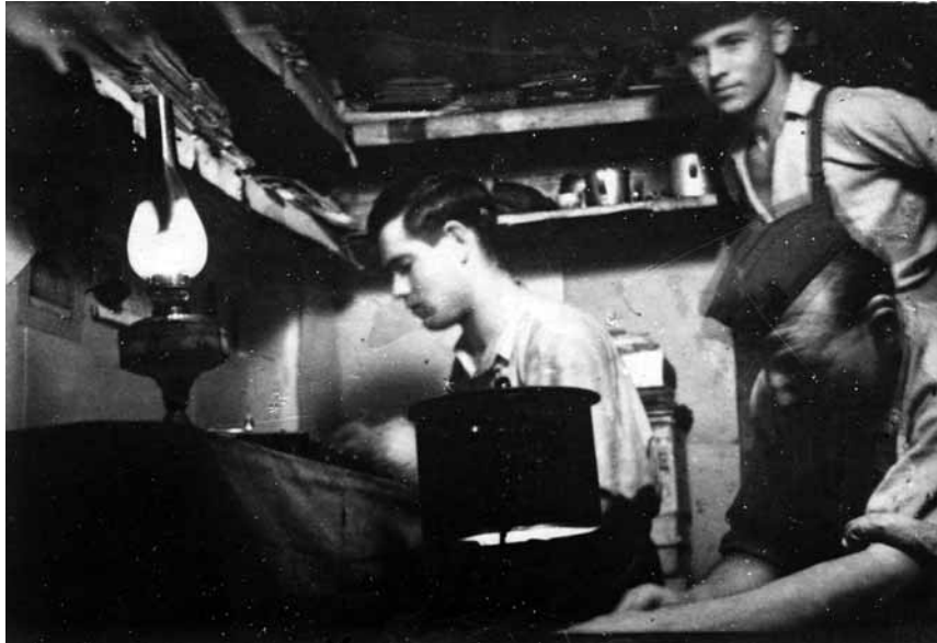
Підпільники ОУН працюють в бункері. Хмельницька область, 1950 р.

ся з українцями-східняками, переважно молоддю, та підкидали листівки й літературу в потяги, надсилали їх у листах робітникам.