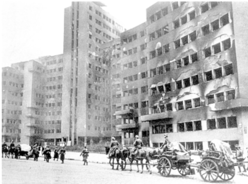
Німці в Харкові