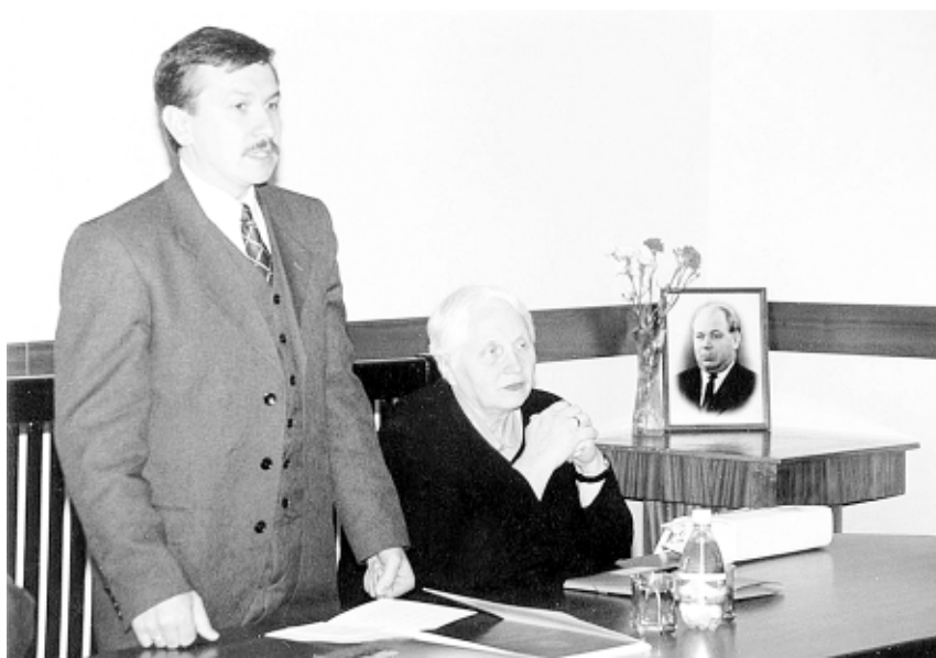
Відкриття V Астаховських читань

Після обговорення доповідей відбувся круглий стіл з проблем викладання спеціальних історичних дисциплін. У «Харківському історіографічному збірнику», як завжди, у першому розділі публікуються матеріали Астаховських читань.