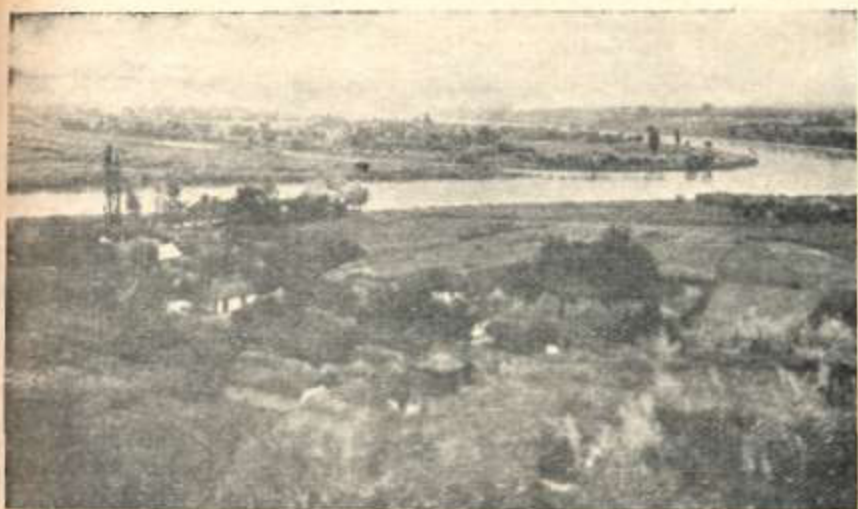
Вид з Пітрицької гори