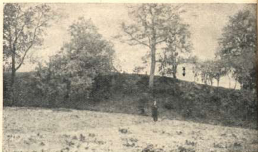
Золотий тик (місце означене стрілкою — княжий терем)