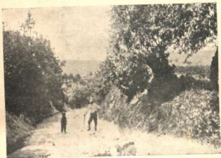
Дорога в Погариці (на „Воротницях“)