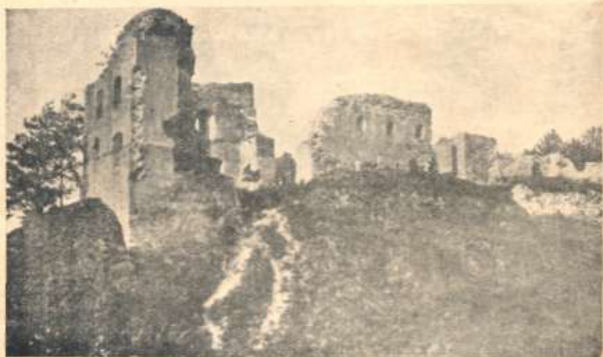
Руїни старостивського замку в Галичі