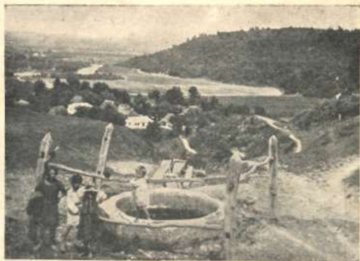
„На керниці“ — Кринос