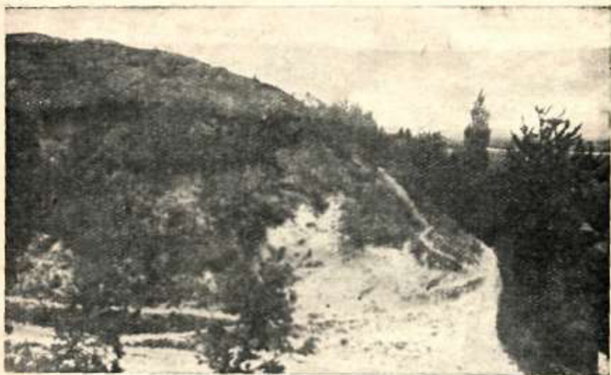
Пірич — Городице