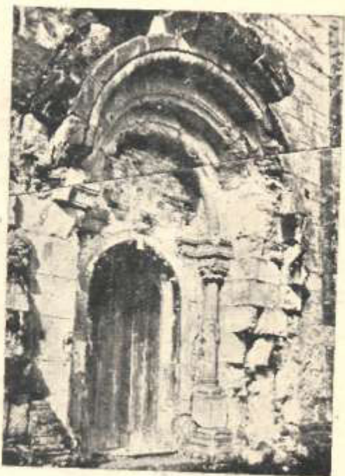
Церква св. Пантелеймона — порталъ.