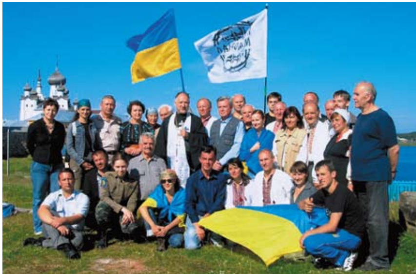
Делегація української громадськості на Соловках (серпень 2007).