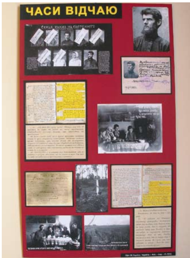
Один зі стендів виставки про Голодомор 1932–1933 років.