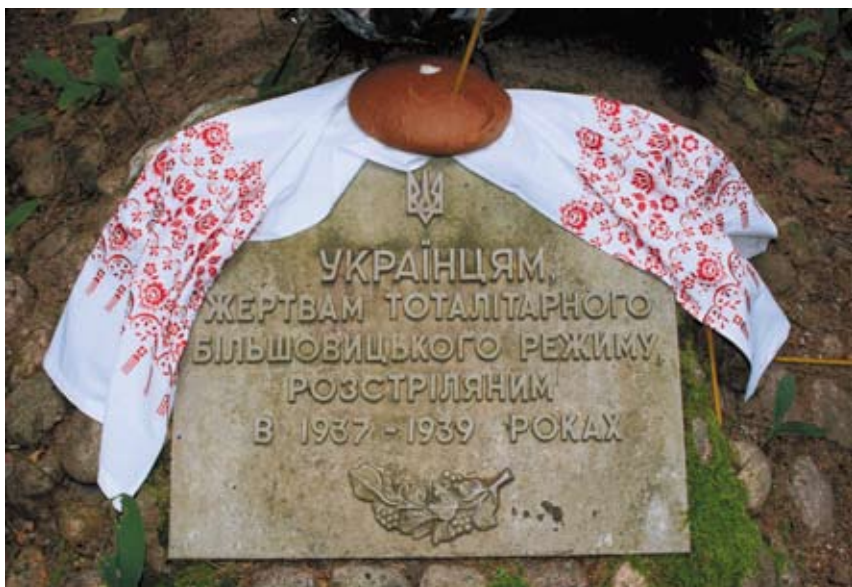
Представницька делегація громадськості, сформована Українським інститутом національної пам'яті, відвідала меморіал у Левашово під Санкт-Петербургом, де поховано тисячі жертв політичних репресій 1930-х років (серпень 2008).