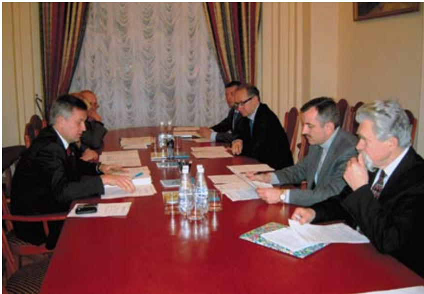
Засідання Громадської ради при Службі безпеки України.

Широким контактам Служби безпеки України із провідними вітчизняними й іноземними засобами масової інформації сприяє те, що спецслужба оприлюднює соціально значущу, правдиву, фахово коректну, юридично обґрунтовану інформацію. Через Прес-центр журналістам надаються відповіді на офіційні запити до СБУ з поточних питань, роз'яснення та коментарі. Лише протягом 2008 року кореспонденти двох десятків видань мали змогу безпосередньо спілкуватися з першими керівником СБУ. Змістовні, різнопланові інтерв'ю були не лише вміщені в цих виданнях – їх широко цитували інші ЗМІ.