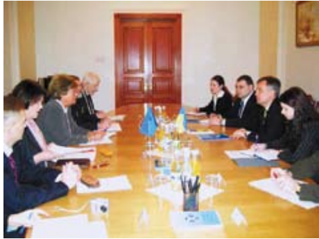
Робоча зустріч з представниками Моніторингового комітету ПАРЄ (Київ, січень 2008 р.)

Особлива увага в рамках співробітництва СБ України з європейськими безпековими структурами надається питанням залучення матеріальної та технічної допомоги партнерів, зокрема в