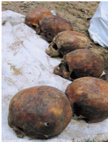
На місці поховання жертв політичних репресій 1930-х під Биківнею на Київщині (2007).