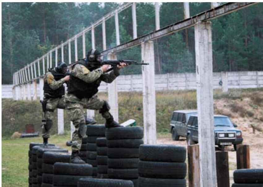
Тренування антитерористичного підрозділу СБ України (2008).