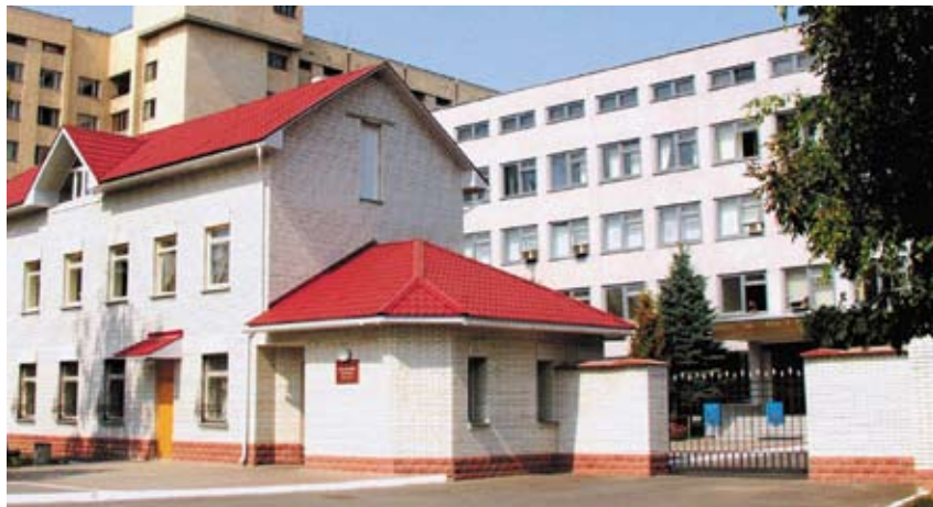
Національна академія Служби безпеки України.

співробітників та організацію роботи з резервом на керівні посади в Службі безпеки України, сприяти перетворенню цих чинників у дієві механізми підвищення ефективності кадрового забезпечення Служби;