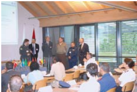
Навчальний семінар у рамках Програми професійної підготовки (Шпіц, Швейцарія, серпень 2008 р.)

наданням інструкторської допомоги представникам підрозділів спецпризначення правоохоронних органів та спеціальних служб Афганістану.