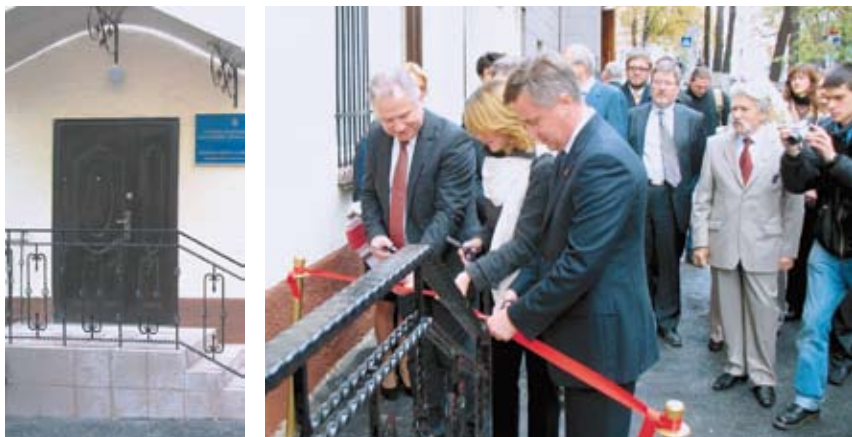
Відкриття Інформаційно-довідкового залу (2008).