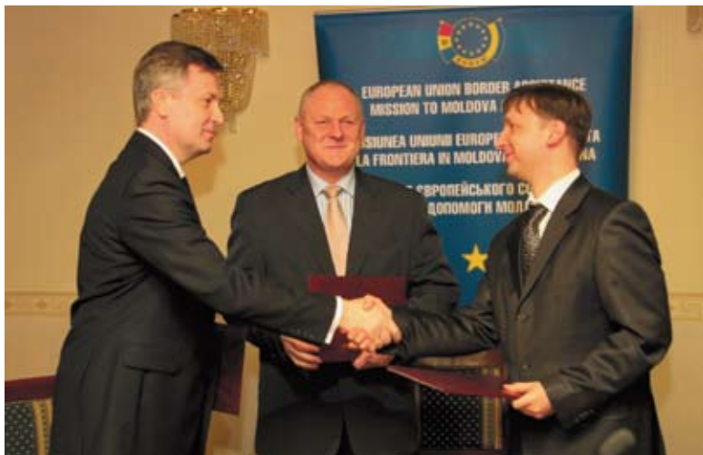
Щорічна спільна нарада керівників СБ України і Служби інформації і безпеки Республіки Молдова за участю Місії ЄС з прикордонної допомоги Україні та Молдові

рамках участі в програмах «Проект проти відмивання грошей та фінансування тероризму MOFI-UA2» та «Підтримка належного врядування: проект проти корупції».