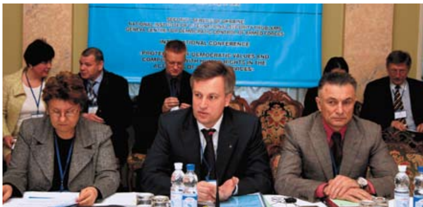
Міжнародна конференція «Захист демократичних цінностей та дотримання прав людини в ході діяльності спеціальних служб» (Київ, квітень 2008 р.)

вання державних органів у сфері національної безпеки та оборони, подальший розвиток цивільно-військових відносин, приведення структур сектору безпеки у відповідність до загальноприйнятих стандартів держав – членів НАТО, додержання міжнародних режимів експортного контролю та поглиблення двосторонніх контактів зі спецслужбами та правоохоронними органами країн-членів, створення