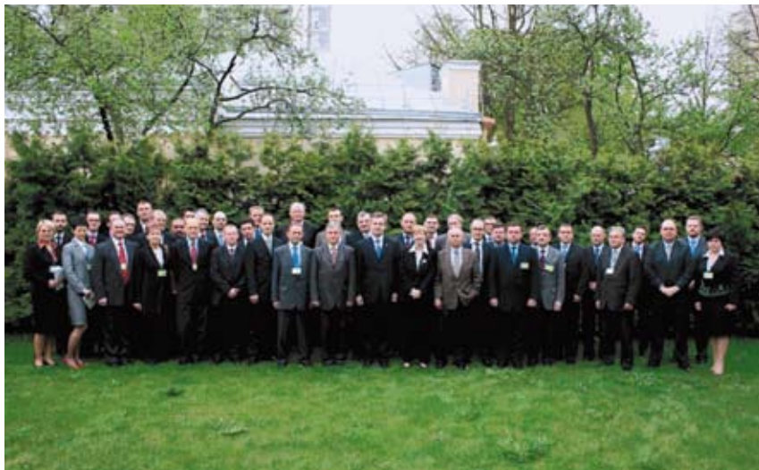
Проведення засідання СРГ ВР Україна – НАТО з питань протидії тероризму (Київ, травень 2008 р.)