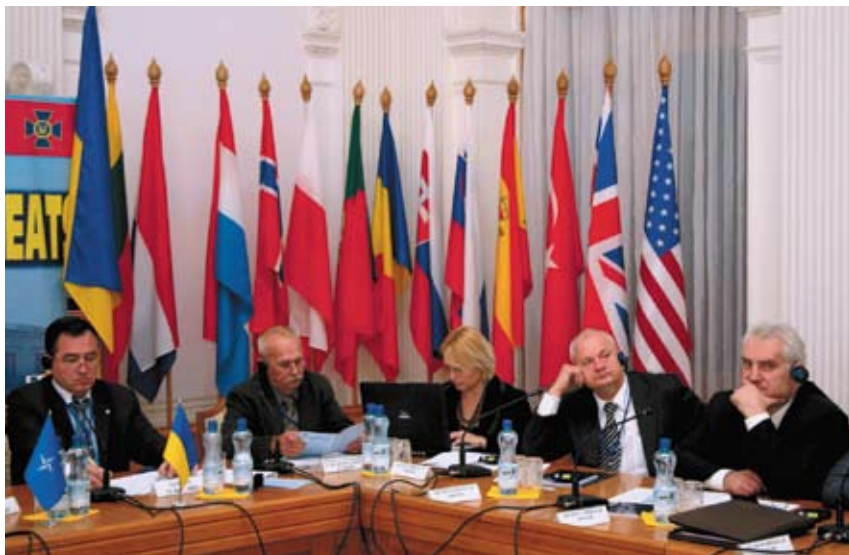
IV Спільний семінар Спеціального комітету НАТО – СБ України «Нові тенденції кібер-загроз» (Ялта, вересень 2008 р.)