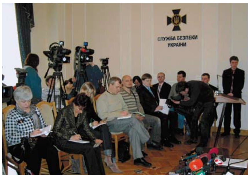
У Службі безпеки України за участю науковців і преси проводяться Громадські історичні слухання (2008).