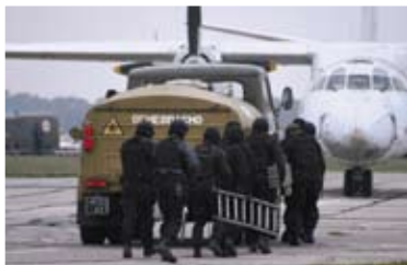
Антитерористичні навчання (Київ, травень 2008 р.)

З метою реалізації Указу Президента України про забезпечення проведення в Україні фінальної частини чемпіонату Європи 2012 року з футболу, а також на виконання домовленостей з Агентством внутрішньої безпеки Республіки Польща у сфері боротьби з міжнародним тероризмом Службою на базі Штабу АТЦ СБ України проведено ряд антитерористичних навчань з координації протидії терористичним актам під час масових заходів.