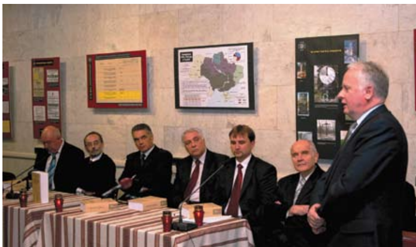
Під час презентації 7-го тому видання «Польща та Україна у тридцятих-сорокових роках ХХ століття...» (2008).