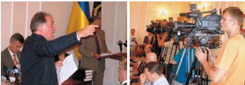
Публічні заходи в СБ України за участю громадськості (2008).

Протягом листопада 2006 р. – грудня 2007 р. в усіх регіонах України, а також у столицях Російської Федерації і Білорусі показано виставку «Розсекречена пам'ять». На сході й заході, у центрі, на півдні й півночі країни вона мала широкий суспільний резонанс. Виставку відвідали 100 тисяч осіб, які залишили у книзі відгуків майже 1400 зворушливих записів, у тому числі свідчень геноциду Українського