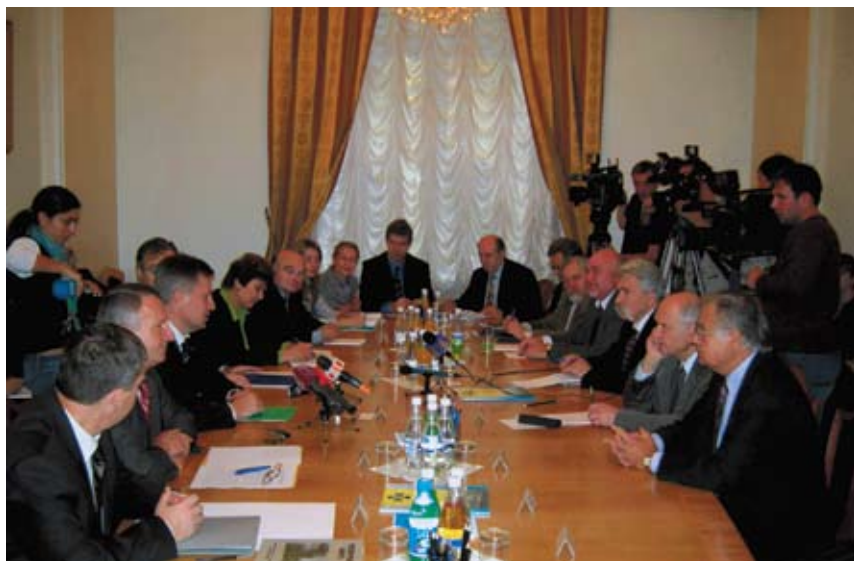
Круглий стіл з представниками української інтелігенції (2008).

На початку вересня 2008 року члени цього дорадчого органу взяли участь в опрацюванні проекту нового Закону України «Про Службу безпеки України» і висловили пропозиції та зауваження до нього. Йшлося, зокрема, про потребу врахування в процесі реформування СБУ перехідного стану українського суспільства та соціально-економічної сфери, а також проблем геополітичного рівня, що створюють істотні загрози національній безпеці, яких немає в більшості країн сталої демократії. Учасники обговорення наголошували на суспільній важливості законодавчого визначення функцій і повноважень спецслужби у сфері захисту інформаційної безпеки держави.