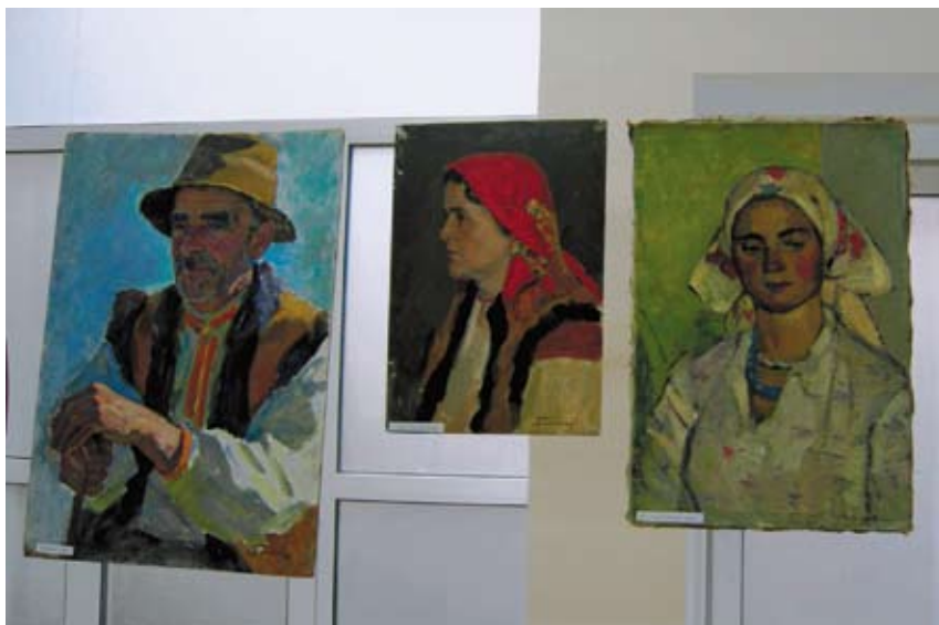
Врятовані культурні цінності поповнять музейні експозиції.