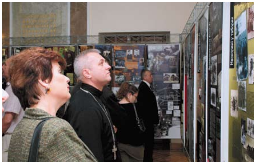
На презентації пересувної фотовиставки «Українська Повстанська Армія. Історія нескорених» (2008).

джерел, внутрішні документи ОУН і УПА. До відкриття виставки Служба безпеки надрукувала ілюстрований каталог «Українська Повстанська Армія: історія нескорених» (автори – співробітники Центру досліджень визвольного руху).