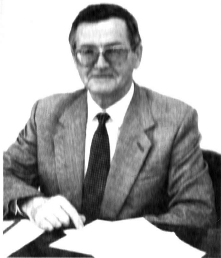
Олександр Ісайович Солженіцин