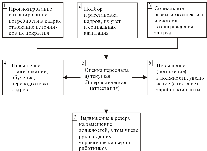
Рис. 2. Структурная схема задач, стоящих перед кадровыми службами предприятий на этапе перехода к рыночной экономике

способствовать усилению отдачи и одновременно развитию потенциала "человеческого капитала" на предприятиях. Структурная схема задач, стоящих перед кадровыми службами предприятий, представлена на рис. 2.