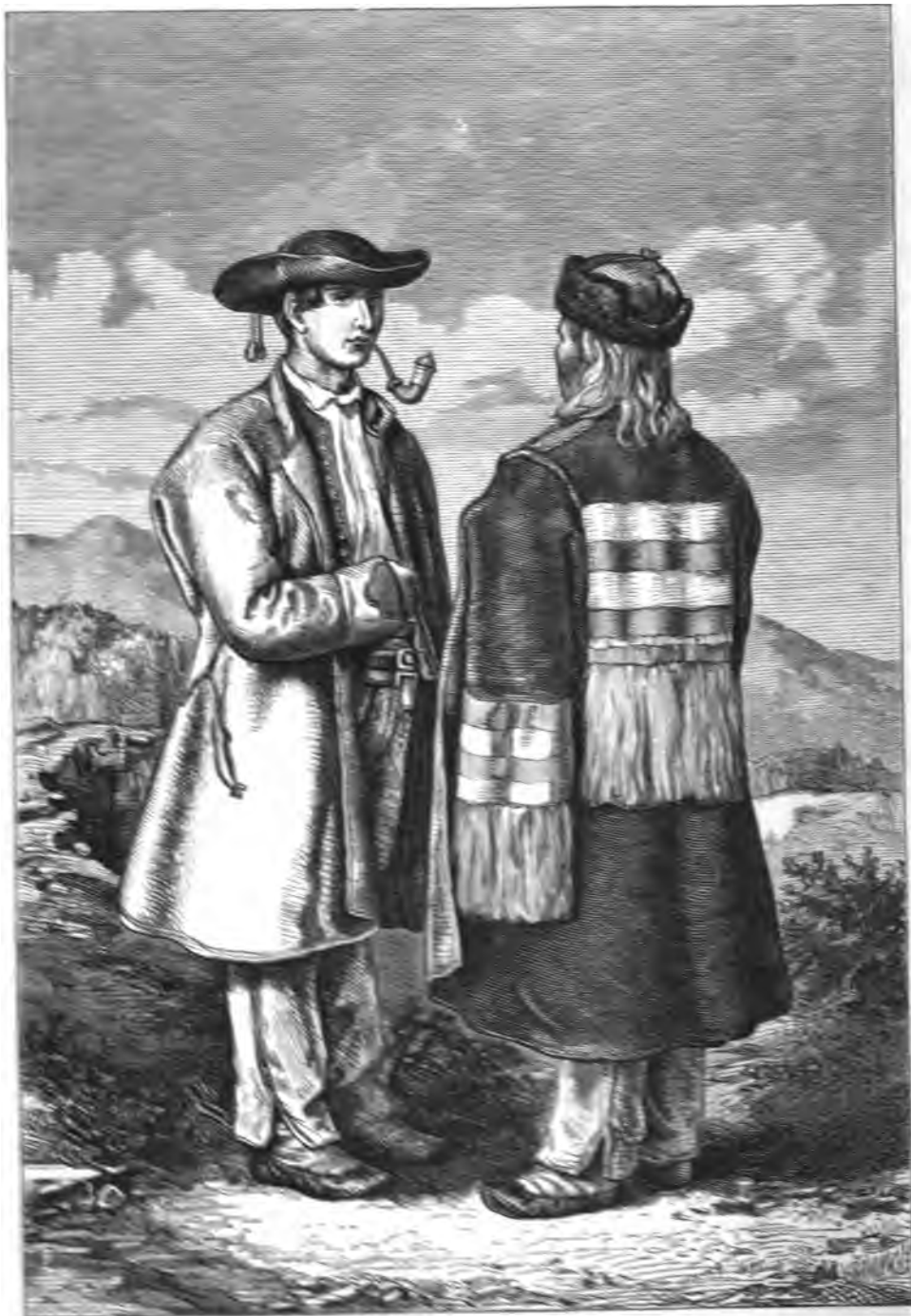
Русскіе горны сартыческіе уѣзда села Крунды въ западной Галлицѣ.