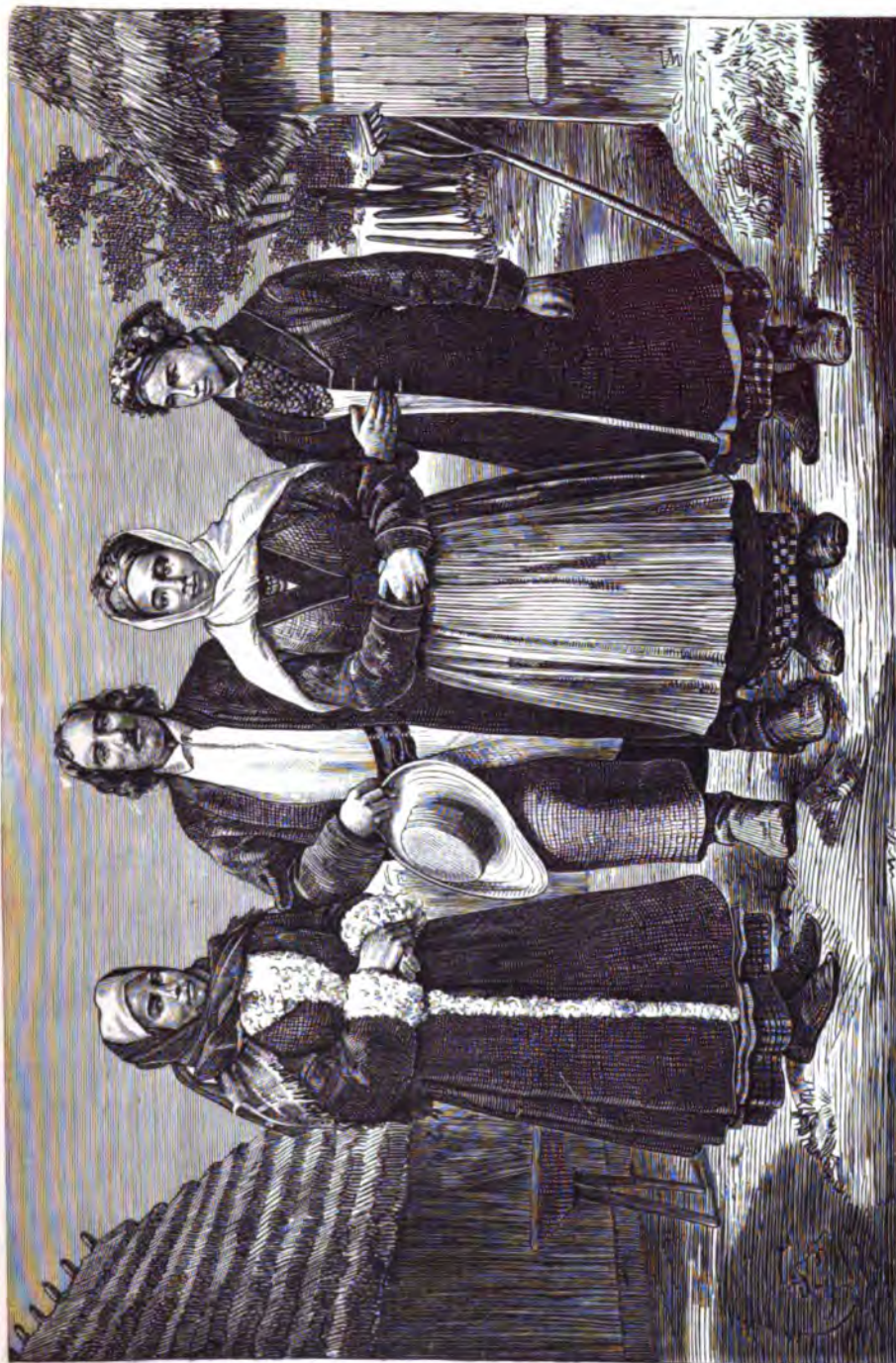
Рускіе крестяне Львовскаго уѣзда села Мальчиць въ Галичинѣ.