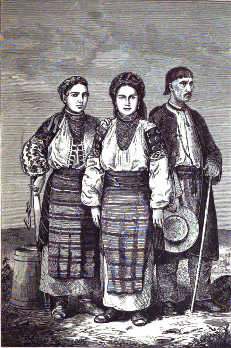
Рускіе крестьяне Чортковскаго уѣзда села Ермаковки въ восточной Галичинѣ.