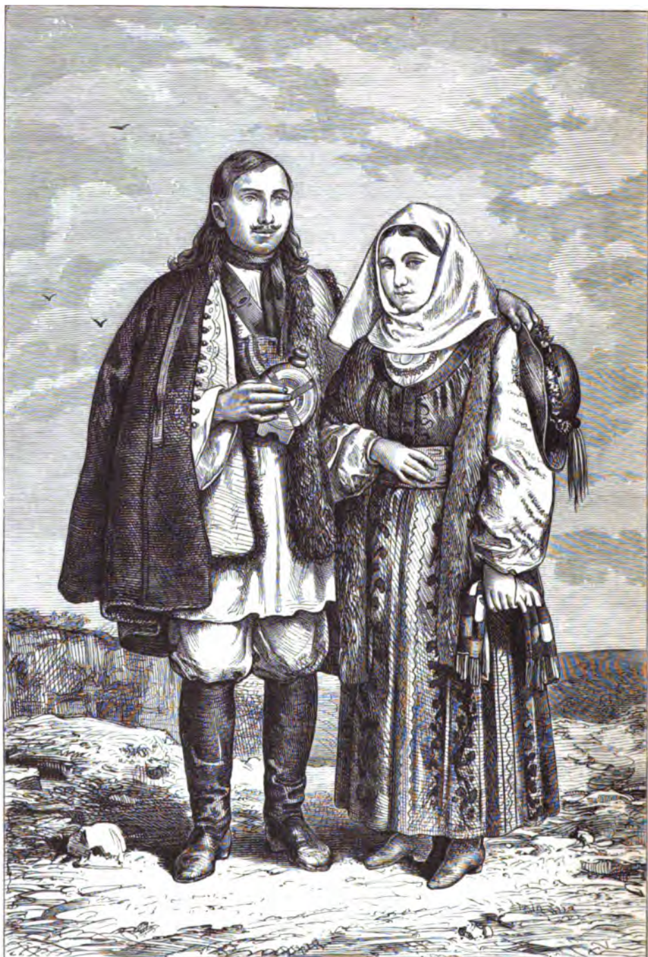
Рускіе крестьяне Черновецкаго уѣзда села Кучурмикъ въ Буковинѣ.