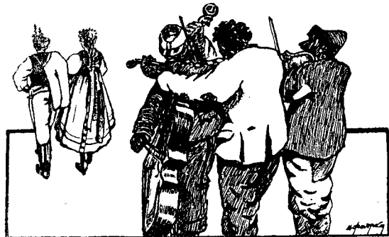
СПІВАНКЫ ВЕСІЛЬНЫ На Весілю

Капиталы все связали, До своего міха, Народ ходит, голодуе, И така потіха.