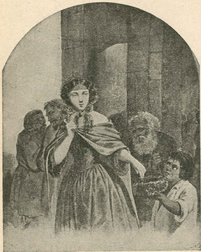
Д. Безперчий. Милостиня.