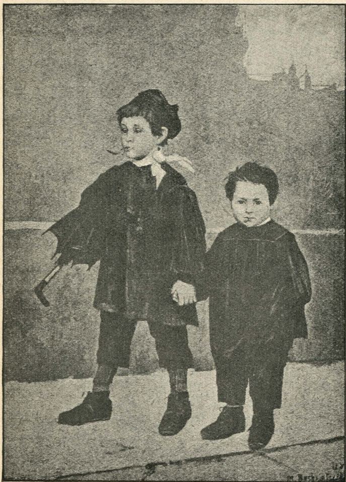
М. Башкирцева. Жан та Жак.