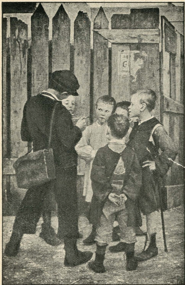
М. Башкирцева. Meeting.