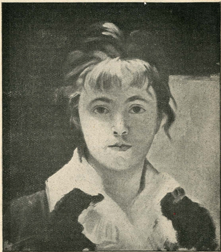
М. Башкирцева. Автопортрет.