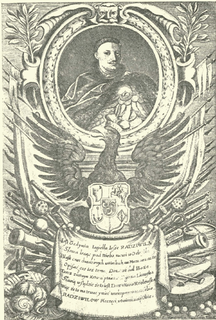
6. Портрет кн. Радзивила. Гравюра на міді Л. Тарасевича 1692 р.