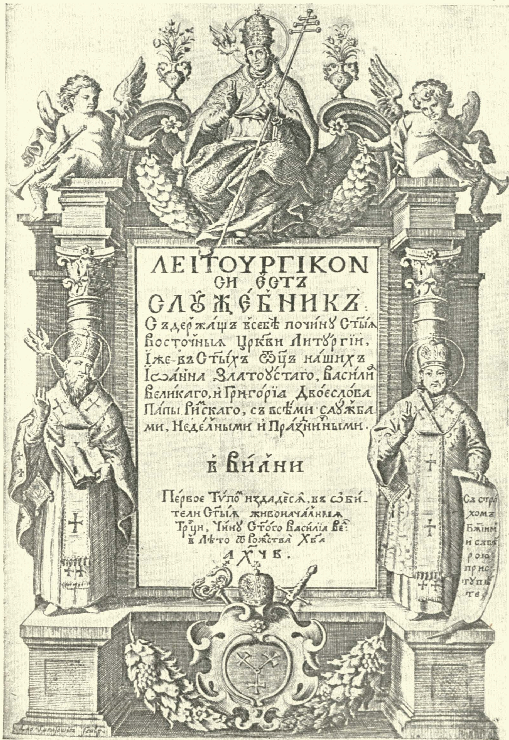
5. Вихідний аркуш Служебника Вильна, 1692 р. Грав. на міді Л. Тарасевича.