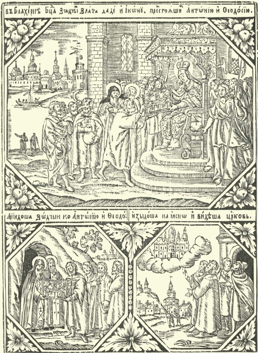
1. Сюжет з Київ-Печерського Патерика. Грав. на дереві майстра І. А. (XVIII ст.).