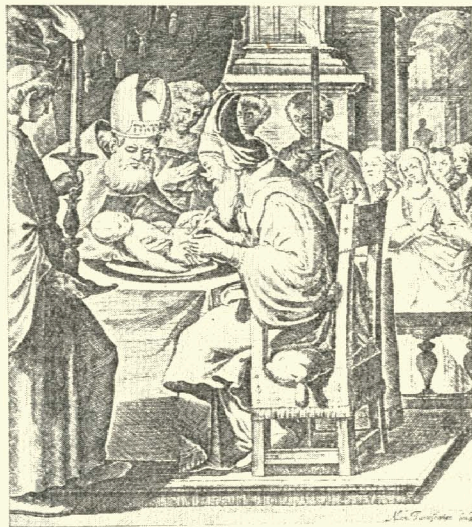
8. Обрізання Іс. Христа. Грав. на міді О. Тарасевича (70-ті роки XVII ст.).

1. Йому належить різаний на міді заголовний аркуш з таким написом на ньому: ЕҀҀхологїон си естѣ требникѣ кзикославенскїй.... Изданъ в Манастерї Ѣневском. Лѣта. 4740 (1739 р.). Навколо заголовка такі сюжети: вгорі монограма