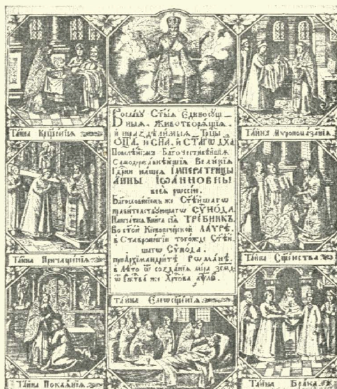
3. Вихідний аркуш до Требника Київського. Печ. видання 1736 р. Грав. на міді І. Макарія.

71 зв. І. Христу одягають на голову терновий вінок. „1762“. „І. Г.“. 6,3 × 9,1. 38. арк. 75 зв. Розпинають І. Христа. „І. Г.“ 6,2 × 9,4. 39. арк. 80 зв. Розп'ятий вже І. Христос. „І. Г.“ 6,4 × 9,2. 40. арк. 85 зв. І. Хр. обідає з двома апостолами. Без підпису. 6,3 × 9,7. 41. арк. 94 зв. І 176 зв. Зняття тіла І. Хр. з хреста. Без підпису. 6,2 × 9,3. 42. арк. 104 зв. По-