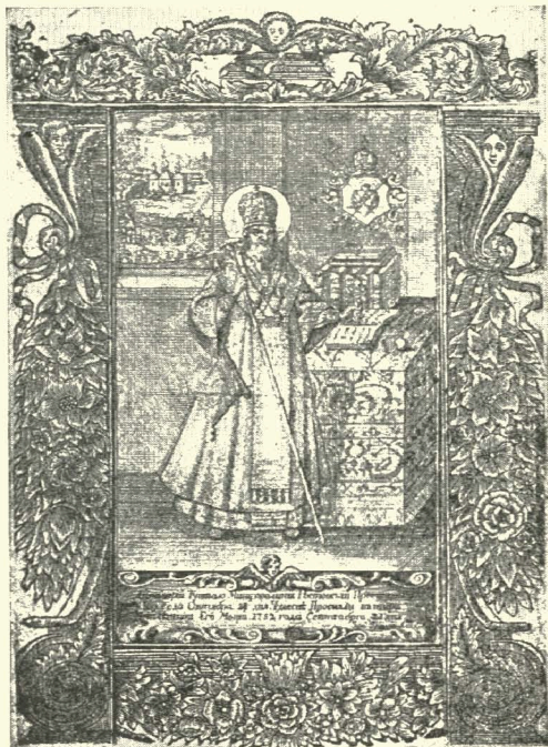
2 Св. Димитрій Ростовський. Грав. на міді Г. Левицького (50-ті роки XVIII ст.).

Цікаво також зазначити, що ті підписи „Георгій“, які поставлено під гравюрами на міді з образами євангелістів і апостолів в ранішому виданні „Нового