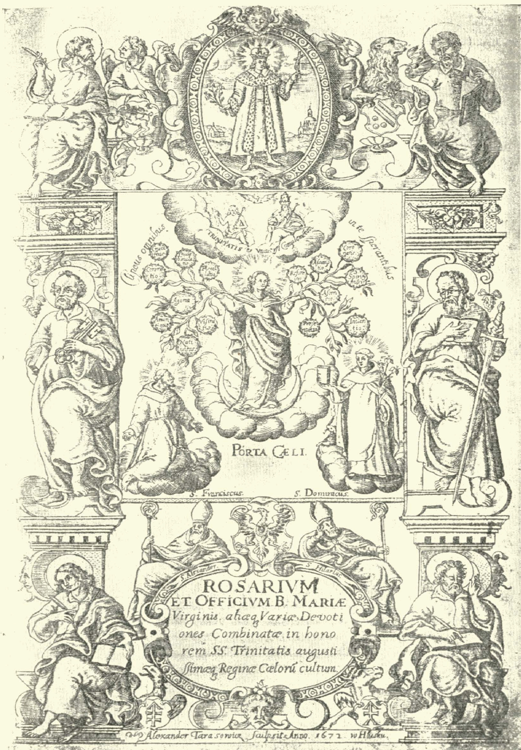
7. Вихідний аркуш книги „Rosarium...“ Грав. на міді О. Тарасевича 1672 р.