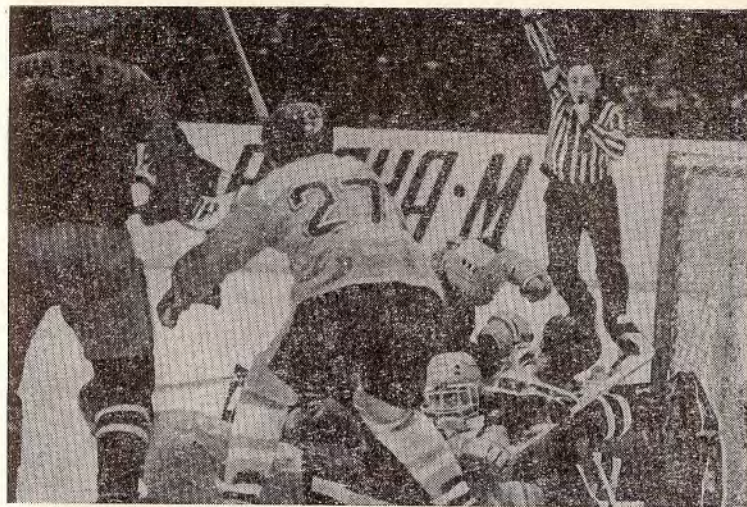
...і «Салавата Юлаєва»

3 березня. На київському льоду суперники зустрічалися вчетверте. Кияни програли 2:3. Лише за 2 хвилини до фінальної сирени ЦСКА вперед вивів Сергій Макаров. Тренери В. Тихонов і А. Богданов кинули в бій чотири трійки нападаючих. Вже на 2-й хвилині гості попе-