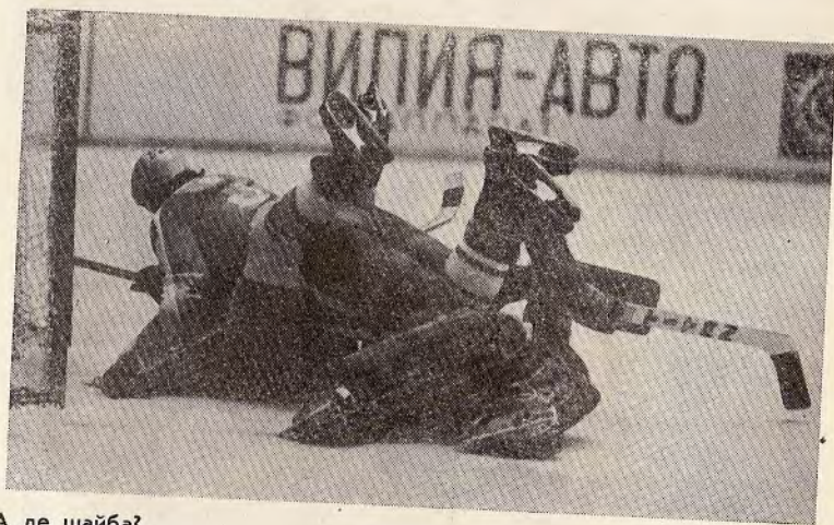
А де шайба?