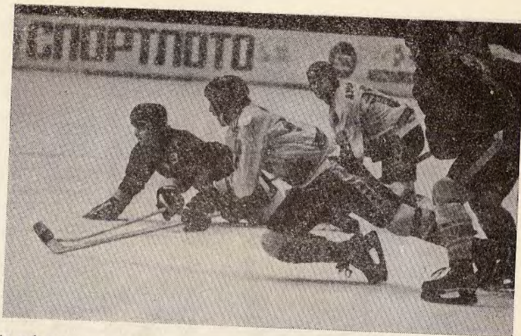
Від оборони — в атаку