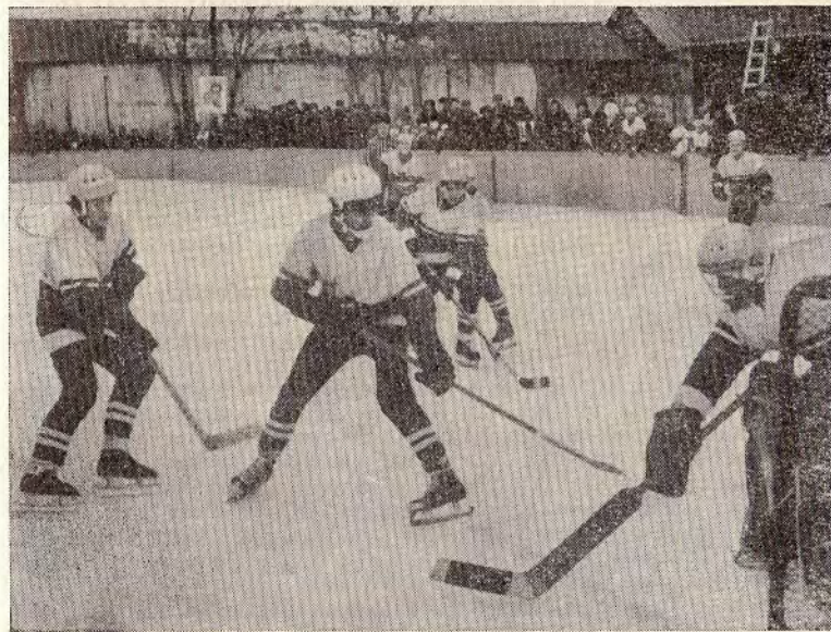
Росте зміна майстрам

реду (Крутов). Та рівновагу встановлює Овчинников. Відмінна гра Шундрова зводить нанівець намагання арміїців, і на 40-й хвилині Голубович вдруге робить в цьому матчі нічию. Цю гру з чемпіоном А. Богданов назвав однією з кращих у сезоні.