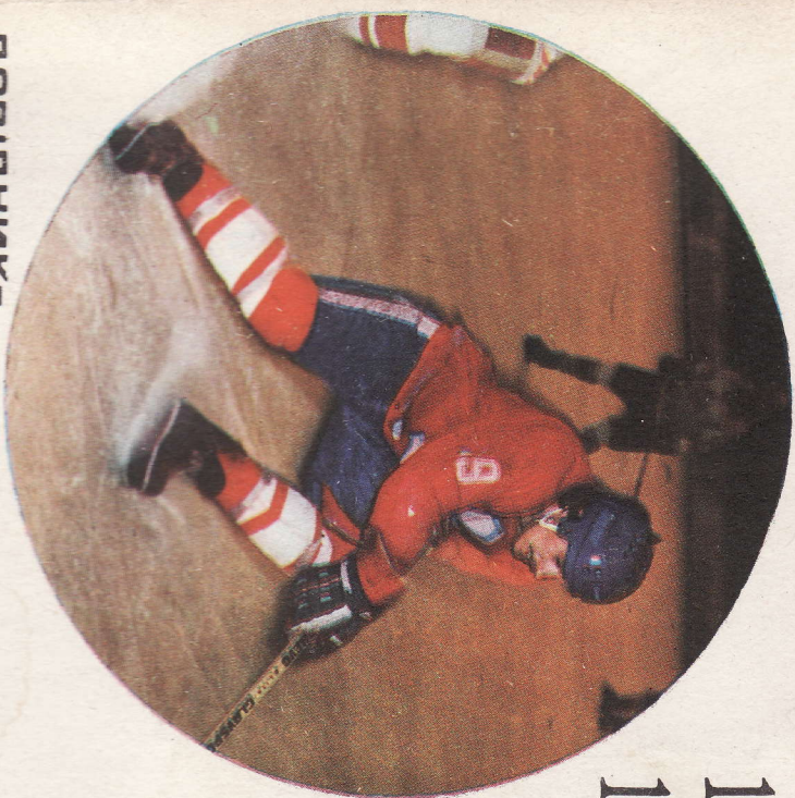
ДОВІДНИК - КАПЕДДАР