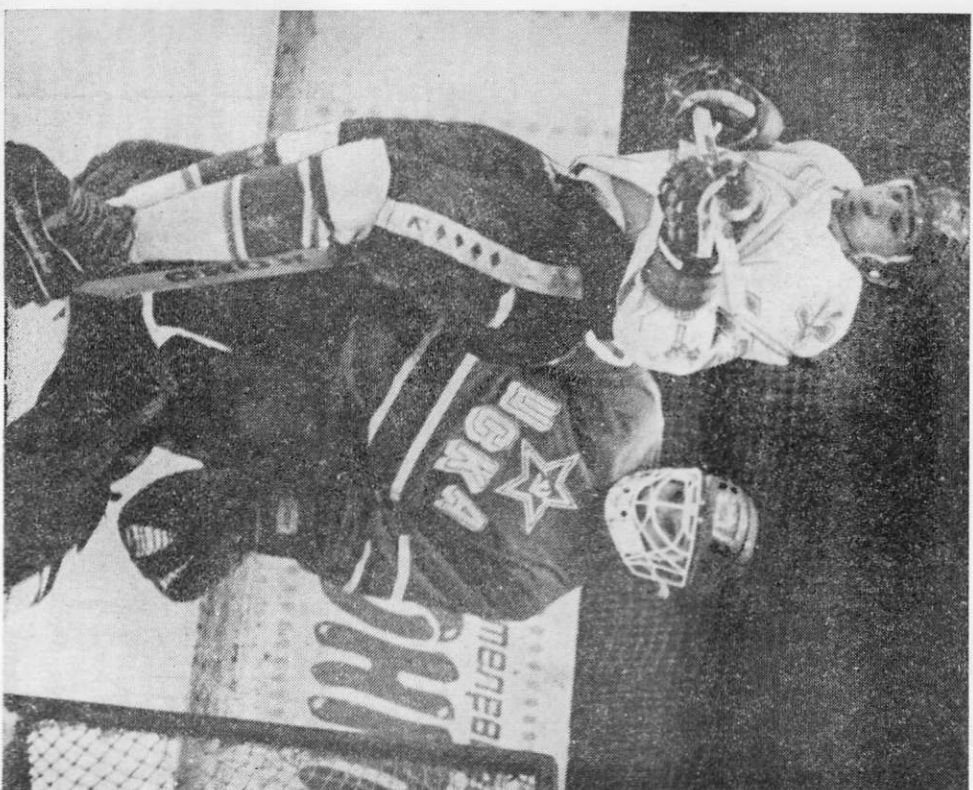
Ворота Владислава Третяка атакує Євген Шастін

17 березня 1983 р., четвер, Київ. 4:6. Останній матч «Сокола» у вищому дивізіоні чемпіонату. Кияни грали пасивно, гості весь час атакували. Лише у третьому періоді «Сокиль» «додав обертів» і спробував наздогнати суперника, але часу на це не вистачило.