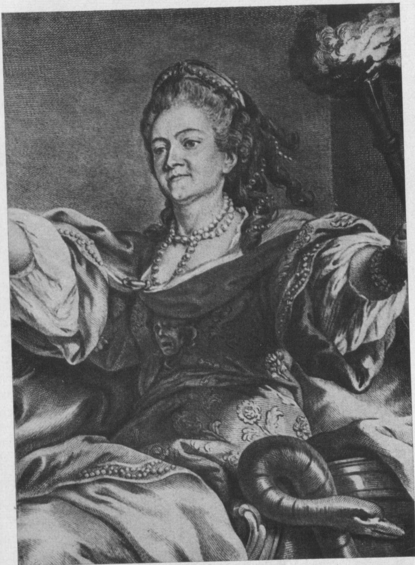
Актриса Клерон. З гравюри Г.-Ф. Шмідта (1757 р.).