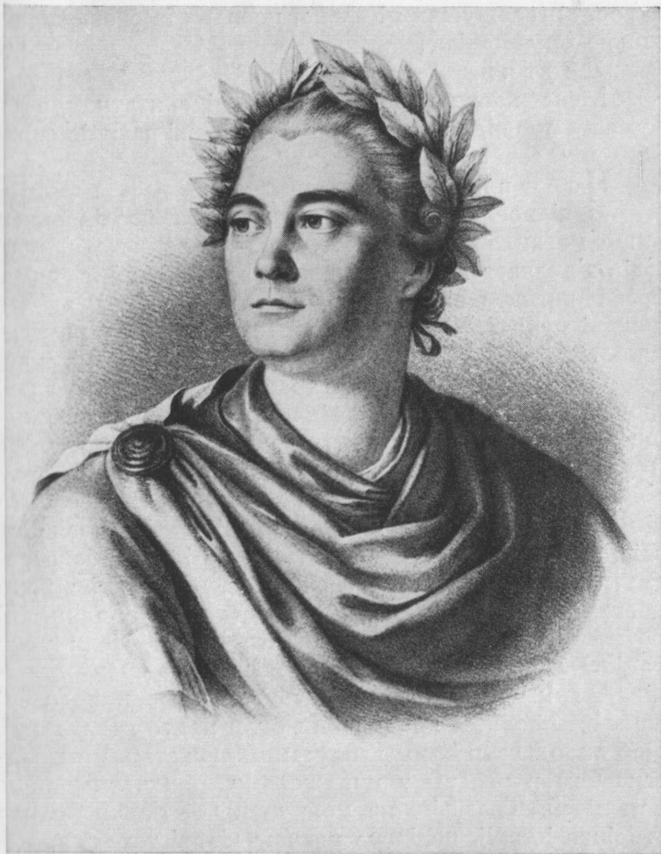
Актор Лекен. З літографії Беяра (XVIII ст.).