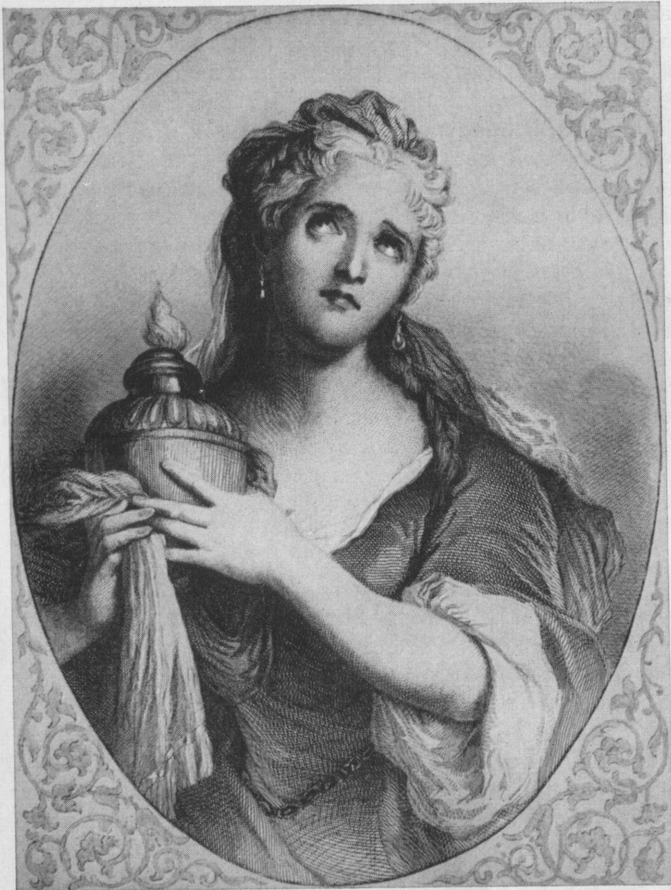
Актриса Адриенна Лекуврер в ролі Корнелії («Смерть Помпея» Корнелія).