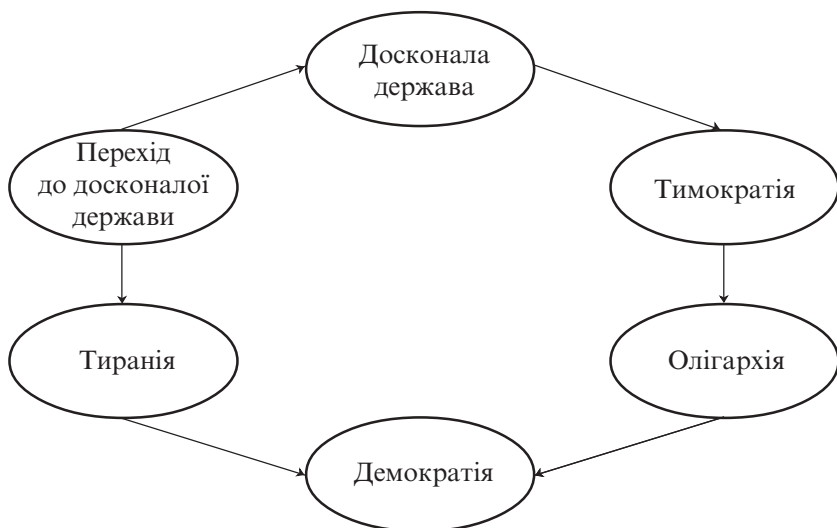
Мал. 1. Платонівський кругобіг державного устрою

аристократія, трудящі), поділ яких історично зумовлений виконанням різних соціальних функцій, що потребують різних здібностей і відповідають певним базовим цінностям.